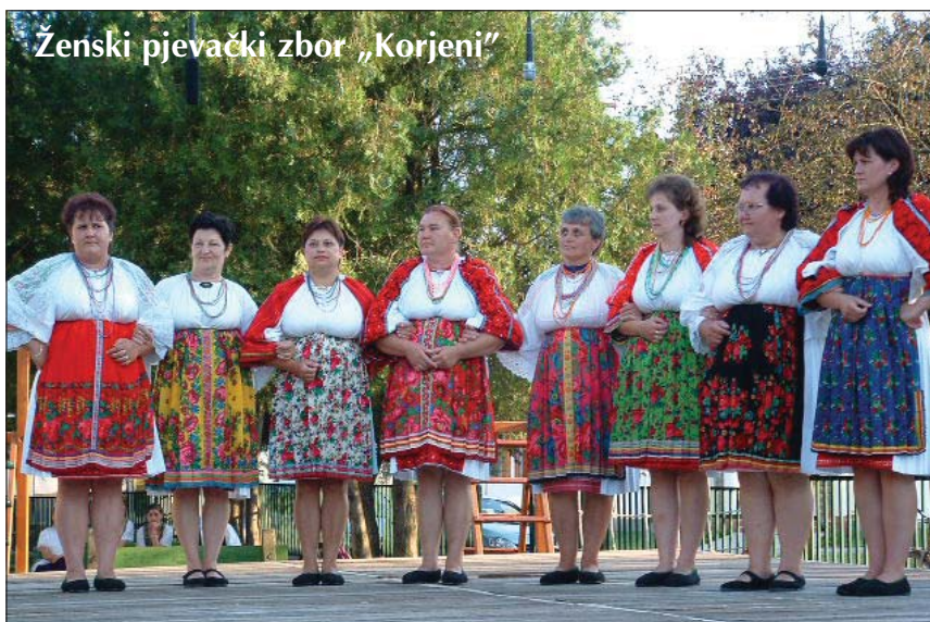
Ženski pjevački zbor „Korjeni“

međureligijske snošljivosti te prijateljstva i razumijevanja između naroda. Preuzimaju ulogu mostova suradnje između država, pa predjume vrijeme u koje Europa i svijet tek ulaze. Iznimno mjesto u duhovnoj sferi takve uloge manjina imaju književnici. Čuvajući i promičući ljepotu umjetnosti riječi i bogatstvo vlastita jezika, oni su stožerna mjesta čuvanja opstojnosti i svijesti o pripadnosti. Ovogodišnjim Susretima pribivat će vrsni znalci o problemima manjina, poznata književna imena naših manjina iz susjednih zemalja, manjina u Hrvatskoj, te drugi hrvatski pisci. Na književnim večerima o svom će književnom radu govoriti, svoje literarne uratke kazivati istaknuti autori, a na okruglim stolovima s temama pod naslovom: Književnost između dvije domovine, Veze i prožimanja između domaćih i matičnih kultura i jezika, te Europski standardi i hrvatska praksa u tretiranju kulturnih i jezičnih raznolikosti, te okrugli stolovi na naznačene teme uz podnošenje stručnih i znanstvenih priopćenja, nastupa domaćih književnika, razgovora s istaknutim intelektualcima, znanstvenicima i društvenim djelatnicima. U programu Susreta za sudionike predviđeno je upoznavanje s prirodnim ljepotama Istre, s njezinim kulturnim naslijeđem, s najvećim hrvatskim poluotokom kao kolijevkom glagoljaštva te kao s multietničkom i multikulturnom sredinom, saznali smo iz priopćenja Organizacijskog odbora drugih Susreta književnika hrvatskih manjina u susjednim zemljama s književnicima u Republici Hrvatskoj.