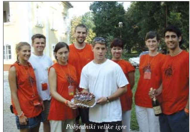
Pobjednici velike igre