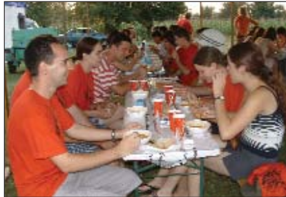
Prva večera u prisičkom taboru