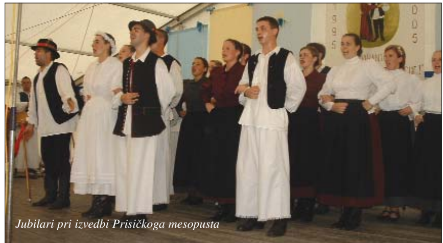
Jubilari pri izvedbi Prisičkoga mesopusta