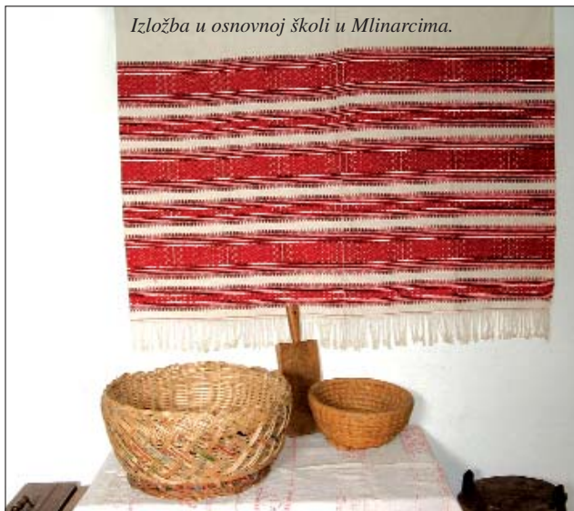
Izložba u osnovnoj školi u Mlinarcima.

Prijedloge za dodjelu Odličja treba dostaviti na adresu Ureda Hrvatske državne samouprave (1089 Budimpešta, Bíró L. u. 24) najkasnije do 5. rujna 2005. godine.