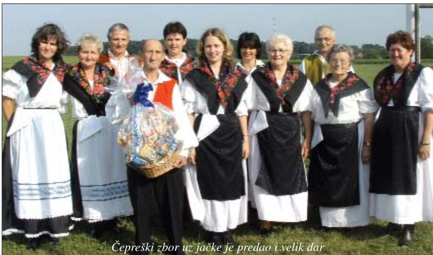
Čepreški zbor uz jačke je predao i velik dar