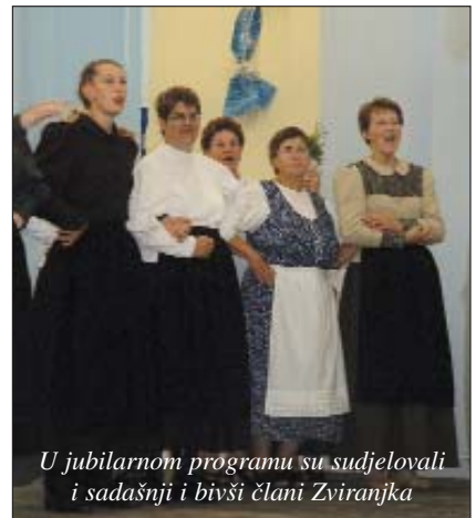
U jubilarnom programu su sudjelovali i sadašnji i bivši člani Zviranjka