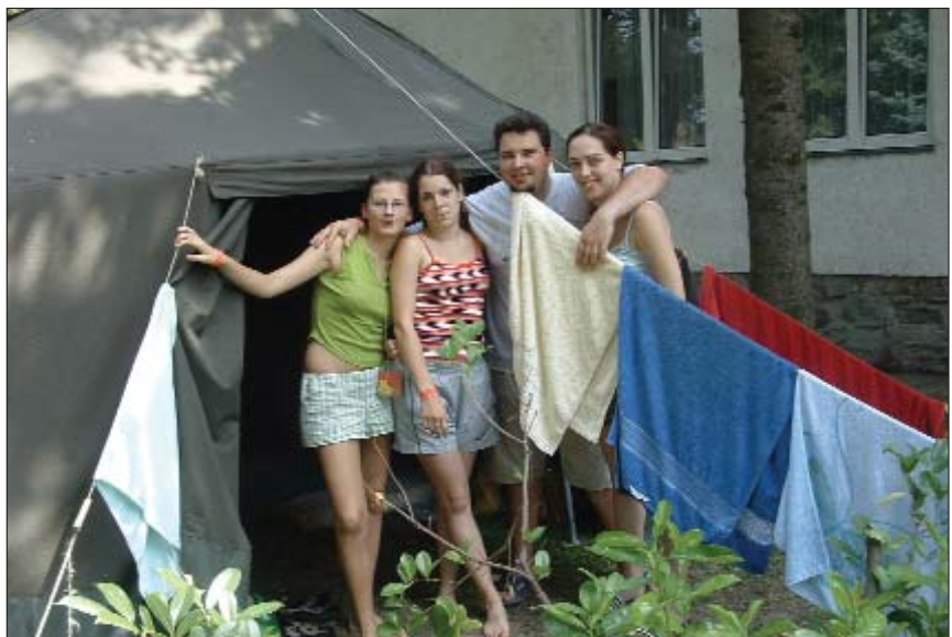
Umočani su u svoje društvo primili i Koljnosku