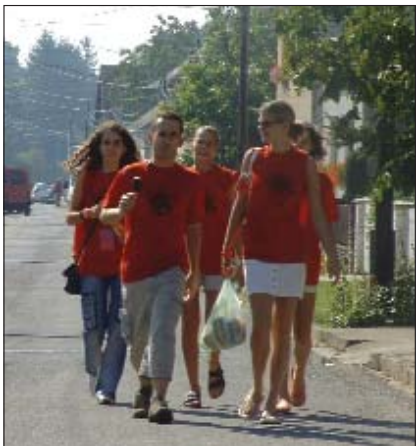
Črljena majica je bila hit-uniforma u Prisiki

Sridnjegradišćansko naselje – od kih pol jezero stanovnikov – na zadnji julijski vikend se je porumenilo. Na prisički ulica uz domačine su se pojavili u črljenu majicu obličeni junaki i divojke ki su od 28. do 31. julija gostovali u selu kao taboraši 12. gradišćanskoga omladinskoga tabora. Pod organizacijom KUD-a Zviranjak, Samouprave sela Prisike i DGHMU-a, ter uz materijalnu potporu Hrvatske državne samouprave, Društva Gradišćanskih Hrvatov u Ugarskoj, Hrvatske matice iseljenika, Odbora za narodne grupe u željeznožupanjskoj skupštini, a i uz brojne podupirače i sponzore je priredjen RE(peta)-PRITA (prisički tabor) koji je u drugom krugu jur treća štacija, treće selo kade se najde gradišćanska mladina. Ovput je dospilo u Prisiku oko četrdeset sridnjoškolcev, studentov, a med njimi, suprot prethodnih ljet, na ugarskoj strani smo imali sriću viditi i Hakovce (Hrvate iz Austrije) ter velik broj Gradišćanskih Hrvatov iz Slovačke. Četvrtak, 28. julija, u kulturnom domu sve nazočne su pozdravili eminentni peljači naše narodne grupe, predsjednik Hrvatske državne samouprave dr. Mijo Karagić ki je naglasio da na tlu naše zemlje je jedino