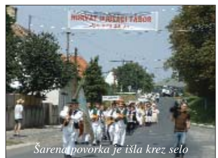
Šarena povorka je išla krez selo