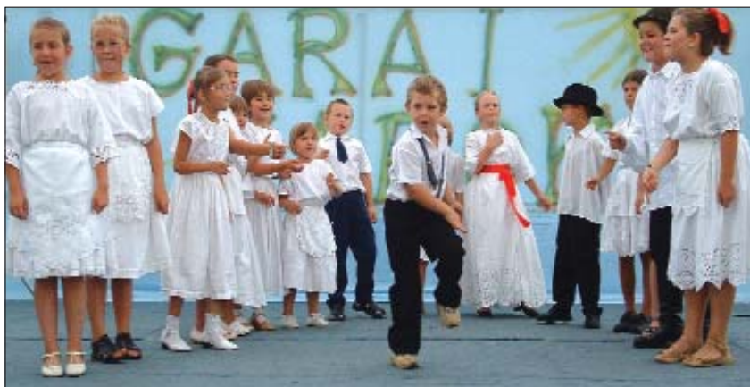
Velika skupina garskih učenika prikazala je bunjevačke i splitske plesove

U organizaciji mjesne samouprave, potkraj prošloga tjedna, od 19. do 21. kolovoza, održani su već tradicionalni Garski dani, koji su započeli u petak natjecanjem u stolnom tenisu, a završeni u nedjelju natjecanjem ribiča.