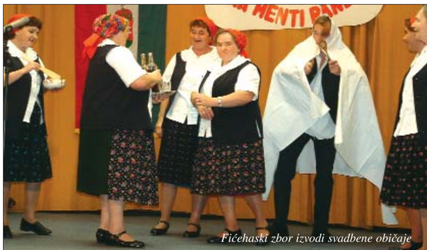
Fičehaski zbor izvodi svadbene običaje