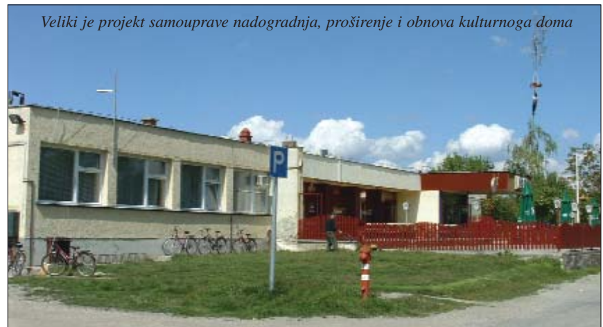
Veliki je projekt samouprave nadogradnja, proširenje i obnova kulturnoga doma