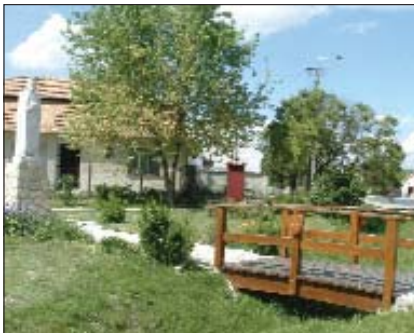
U čast milenija je postavljen spomenik kralju Beli IV.

Po broju stanovništva (2300) Kemlja je jedno od najvećih naselja u Gradišću, međutim negdašnji dušobrižnik, velikan našega naroda Mate Meršić-Miloradić i ljubitelj ter poštovatelj hrvatske riči danas bi razočarano konstatirao koliko je pao broj onih ki još ovde vladaju hrvatskim jezikom. Sa starijimi ljudi i jezik će se polako odseliti na drugi svit. Suprot toga peldodavno djeluje Hrvatska manjinska samouprava ka je jur 20 ljet dugo u kulturnoj suradnji s hrvatskim selom Pleternicom, i koja potpomaže nedavno utemeljeno društvo seniorskih folklorošev pod imenom Konoplje. Pokidob ovde djeluje i Nimška manjinska samouprava, općina s načelnicom Zsuzsannom Balsay se mora brinuti da obadvi na-