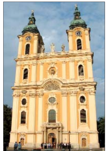
Prekrasna barokna kalačka katedrala