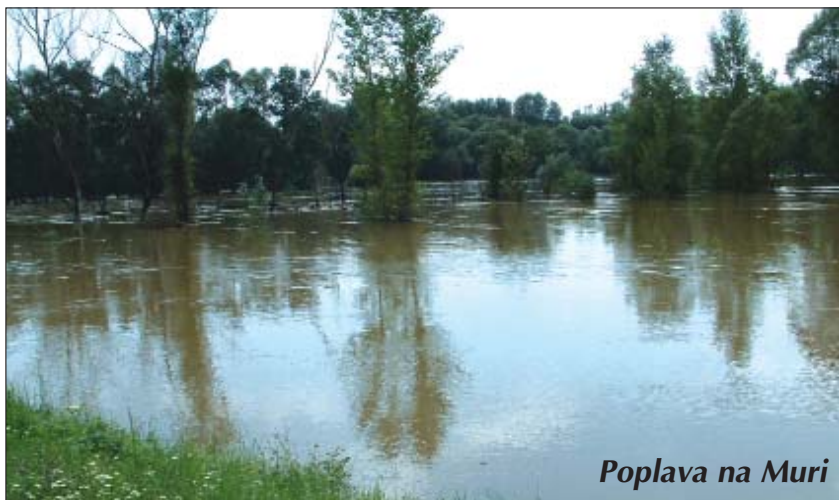
Poplava na Muri

a ljetos su uprav tako kot i projuće ljetu, gradski jačkari završili kulturni program na Glavnom trgu. Priključili su im se Koljnofski tamburaši, a pravoda s muzikom bolje zvuči i ljudski glas. Jačkari, najvećimi rodnom iz Koljnofa, Narde, Hrvatskoga Židana, Petrovoga Sela pretežito s pripadniki zrelije generacije, zato su imali pred nastupom tremu, ali je to u tom hipcu zabljeno, kad su dostali prvi aplauz sa strane publike. Dokle su si muži sami poskrbili negdašnju narodnu pratež s pruslekom i rupcem, žene su si izabrale črno-bijeli sastav za rublje. Kad sam zapitala mojega sugovornika, dokle će jačiti ovako u grupi, mi je odgovorio: „ Za svoje veselje? Dokle zna nek živiti hrvatska rič va Šoproni! “ A gledajuć njev nastup toga dana u kasnom otpodnevnu, već nikakovu dvojbu nisam imala da će to gvišno tako i biti. -Tiho-