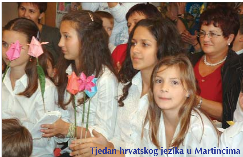
Tjedan hrvatskog jezika u Martincima

Treći odnosno točnije početak noći 4. listopada povijesni je hrvatski trenutak, i ništa od toga dana nije kao što je bilo do tada. Datum početka pregovora je 20. listopada. Pregovarački tim na čelu s Vladimirom Drobniakom stoji pred velikim zalogajem, ali imaju razloga za optimizam. Prvi pak pregovori, kaže premijer Sanader, vodit će se u području znanosti i istraživanja, što je više nego simbolično ako želimo razmišljati o Hrvatskoj kao državi koja se ubrzano razvija usvajanjem novih znanja i promišljanja. Branka Pavić Blažetin