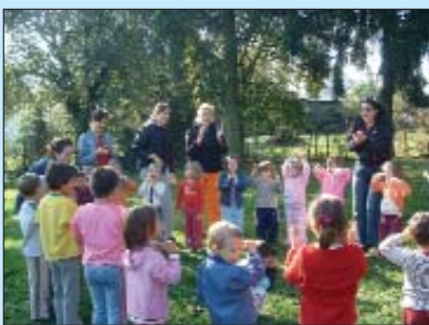
Studentice na dvorištu dječjeg vrtića

Vrtić je jako dobro opremljen, sve je djeci pri ruci, što god im uredba, mogu dohvatiti, ima mnogo prirodnih materijala, slagalica što razvija razne sposobnosti, lutkarskih igračaka kojima se mogu odigrati razne priče ili situacije. Djeca imaju dosta slobodnoga vremena, u Hrvatskoj se više ustrajava na zanimanjima. Nekoliko djece nešto razumije i hrvatski, da bi to što bolje išlo, treba puno pričica pričati, pjesmica, igrati lutkarske igre, gledati crtane filmove na hrvatskom jeziku. Uspjeli smo uspostaviti s njima dodir s dječjim igrama u kojima su rado sudjelovala. Zahvaljujemo na gostoprimstvu, vrlo je bilo lijepo u Serdahelu, a Budimpešta je prekrasan grad.