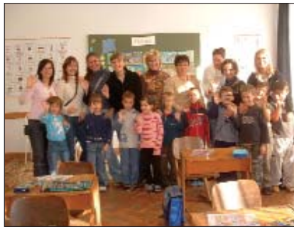
Studenti na satu engleskog jezika sprijateljili su se s učenicima 1. razreda

Jeseni 2002. g. prvi put su gostovali studenti Sveučilišta iz Zadra u serdahelskoj Osnovnoj školi Katarine Zrinski radi upoznavanja manjinskoga školstva u Mađarskoj. Od tada svake godine u listopadu dvadesetero studenata boravi tjedan dana u Serdahelu, a isto toliko učenika ljetuje tjedan dana u Zadru.