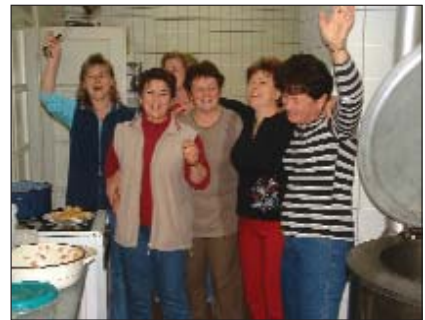
Nastavnice serdahelske škole očekuju goste iz Zadra s izvrsnom večerom

Drugi dan su već lakše stupili u dodir s djecom, skupa izrađivali figure, igrali razne igre. Djeca su uživala u lutkarskoj igri „Crvenkapa i vuk” i lako zapamtila i naučila igre na hrvatskom jeziku.