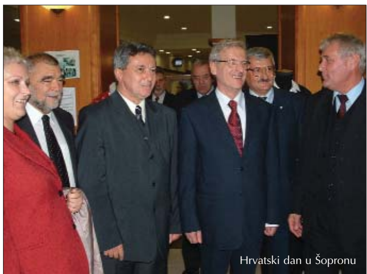
Hrvatski dan u Šopronu

Sačuvanjem osnovnih vrijednosti koje je krasi, u prvom redu jezika i pisma, samobitnosti njezinih pripadnika, plesom i pjesmom, isticanjem postignuća na kojima bi im pozavidjeli i oni znatno brojčaniji te zajedničkim lobiranjem političke i intelektualne elite.