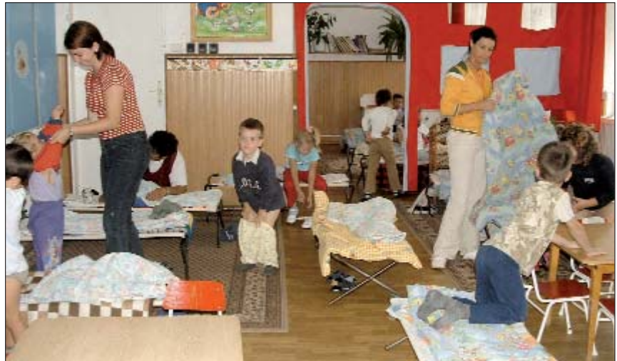
Priprava za otpodnevno počivanje

Ukinuta hrvatska grupa, jesenski piknik, stara-nova odgojiteljica, u svojoj funkciji treći put potvrđena peljačica