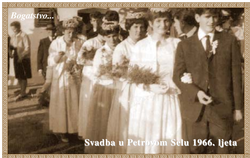
Svadba u Petrovom Selu 1966. ljeta

pučanstva u povijesti i danas, a Miklós Surján iz županijske knjižnice Győző Csorba govorio je o bibliografiji naslova novinskih tekstova koji govore o manjinama u Županiji Baranji, dok su Zsuzsanna Lukács i manjinska referentica Knjižnice za strane jezike Annamária Papp izlagale na temu kako smjestiti knjižničarsko blago manjina koje se nalazi u fondu Knjižnice za strane jezike u takozvani integralni knjižničarski sustav Hun-Téka.