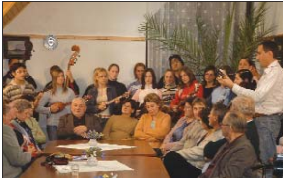
Tamburaši pri predstavljanju vlašće cedejke

Na 15-ljetnu proslavu Koljnofskoga hrvatskoga društva i u ljeti 30. obljetnice tamburaške aktivnosti u spomenutom naselju, je snimljena ter izdana druga CD-ploča koljnofskih tamburašev i jačkarov pod istim naslovom kao i prvi nosač zvuka Snočka mi se j' sanjala .