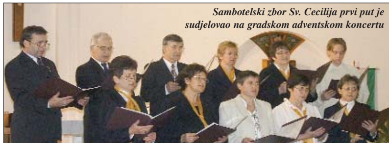
Sambotel'ski zbor Sv. Cecilija prvi put je sudjelovao na gradskom adventskom koncertu