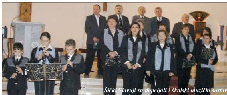
Šiški Slavuji su dopeljali i školski muzički sastav