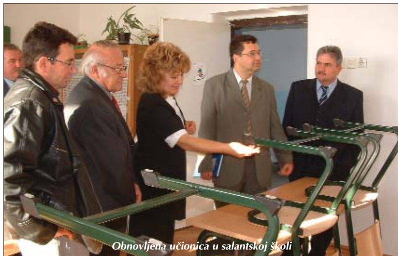
Obnovljena učionica u salantskoj školi

HRVATSKE ŠICE – Po dugoljetošnjoj tradiciji će mjesni školari od 5. do 8. razreda 24. decembra, subotu, pohoditi oko 60 seoskih hiž želeći blažene božićne svetke. U okviru pastirske igre na hrvatskom jeziku će se nazvisti stanovništvo o dolasku ter rodjenju Spasitelja. Hrvatske jačke i betlehemske strofe je s učenici zavježbala Ana Pehm-Moricz, učiteljica hrvatskoga jezika u četarskoj osnovnoj školi.