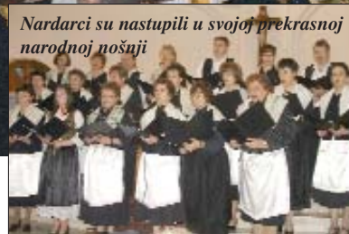
Nardarci su nastupili u svojoj prekrasnoj narodnoj nošnji