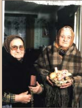
Bunjevke s Dolnjaka kreću na zornicu