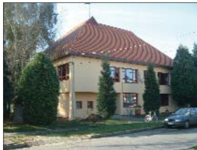
Obnovljena je zgrada mjesne samouprave

Nedavno je završena obnova i u mjesnoj osnovnoj školi, što je ulaganje od 19 milijuna forinti. U tome je samouprava imala 3 milijuna