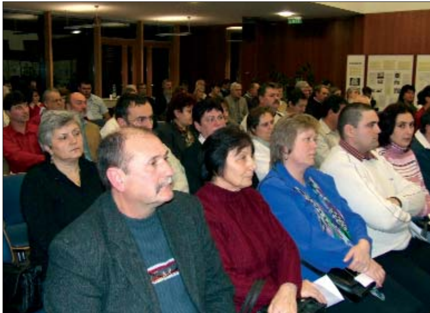
Skup zastupnika hrvatskih manjinskih samouprava u Baranji koji su na manjinskim izborima osvojili mandate u bojama Saveza Hrvata u Mađarskoj