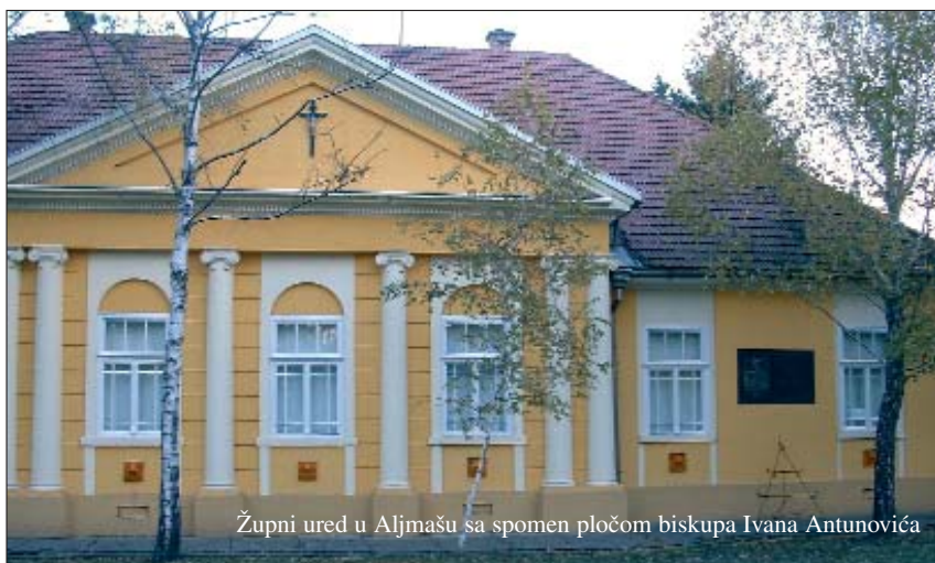
Župni ured u Aljmašu sa spomen pločom biskupa Ivana Antunovića