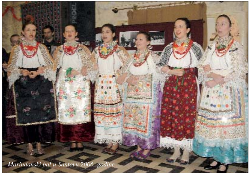
Marindanski bal u Santovu 2006. godine

GLAVNA I ODGOVORNA UREDNICA: Branka Pavić-Blažetin, tel.: 72/435-416, e-mail: branka@croatica.hu, NOVINARI: Stipan Balatinac (zajm. gl. i od. urednika), tel.: 79/454-614, e-mail: baltinac@croatica.hu, Bernadeta Blažetin, tel.: 93/383-034, e-mail: beta@croatica.hu, Timea Horvat, tel.: 94/315-479, e-mail: tih@croatica.hu, LEKTOR: Živko Mandić, tel.: 1/256-0765, e-mail: zsviko@croatica.hu ADRESA: 1065 Budapest, Nagymező u. 49. Tel./Fax: 1/269-2811, tel.: 1/269-1974, e-mail: glasnik@croatica.hu – ZA POŠTANSKE POŠILJKE: 1396 Budapest, Pf.: 495. OSNIVAČ: Savez Hrvata u Mađarskoj. IZDAVAČ: Croatica Kht. RAVNATELJ: Čaba Horvath. List širi posredstvom Mađarske pošte, na osnovi pretplate na žiroračun: CITIBANK Rt. 10800014-30000006-10612032, redakcija Hrvatskoga glasnika i alternativni širitelji. Pretplata na godinu dana iznosi: 4160,- Ft. List pomaže Javna zaklada za nacionalne i etničke manjine u Mađarskoj. Rukopise, fotografije i crteže ne čuvamo i ne vraćamo. TISKARSKA PRIPREMA, TISAK: CROATICA Kht., 1065 Budapest, Nagymező u. 49.