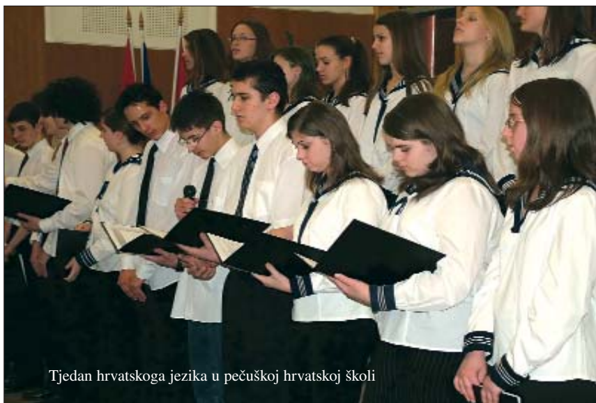
Tjedan hrvatskoga jezika u pečuškoj hrvatskoj školi