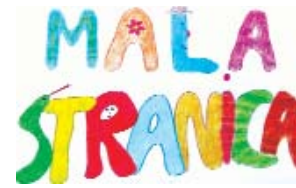
Izradila: Dijana Kovaci iz Fitehaza

U idućih nekoliko naraštaja više od 50 posto od sedam tisuća jezika na svijetu moglo bi nestati. Manje od četvrtine njih trenutačno je u uporabi u školama, a većina je u sporadičnoj uporabi, kaže se u poruci. Tisuće jezika, premda ih znaju stanovnici kojima su svakodnevni način sporazumijevanja, nisu prisutne u obrazovnim sustavima, medijima i izdavaštvu te u javnosti.