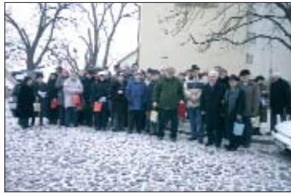
Senandrijski Hrvati Dalmatini nakon tradicionalne pastirske mise

Nakon mise smo doživjeli pravo iznenađenje. Na prostoru kraj crkve bio je stolnjakom prekriveni stol, na njemu dobra rakija i domaći