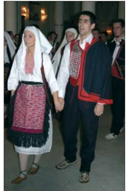
Koljnofski par u koreografiji Glamoč

su imali mogućnosti kupiti tombole, a na kraju se i veseliti na veliki nagrada, npr.: boravku na morju, televizoru ili tamburi. Kot se je vidilo, gosti bala su bili cijelu noć na terenu, tancali su do rane zore, a kako velu organizatori, to je već jako zdavno bilo ovako.