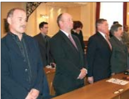
Zastupnici Županijske hrvatske samouprave pri utemeljenju u Sambotelu