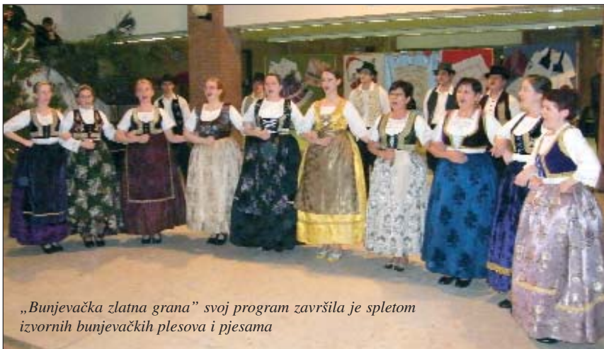
„Bunjevačka zlatna grana“ svoj program završila je spletom izvornih bunjevačkih plesova i pjesama