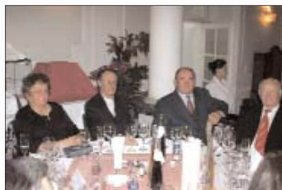
Koljnofci s prijateljem iz Slovačke