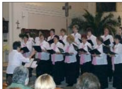
Na adventskom koncertu, organiziranom od samouprave, je nastupao uz ostalo i petrovski ženski zbor Ljubičica