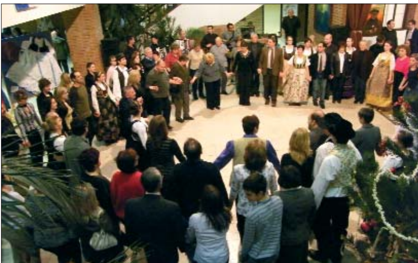
Nakon programa uslijedio je bal – sudionici i gosti u velikome bunjevačkom kolu

Tekst: S. Balatinac