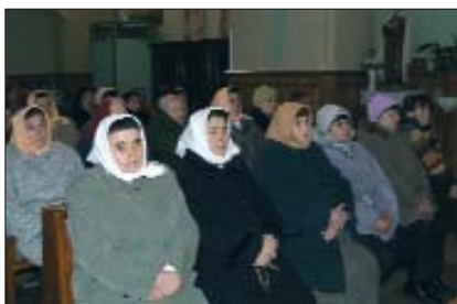
Dio okupljenih dušnočkih vjernika

U župnoj crkvi koja je sagrađena 1742. godine, posvećena Svetom Filipu i Jakovu, a oltarska slika prikazuje uskrsnuću i uznesenje Isusa Krista, okupio se velik broj racko-hrvatskih vjernika te članova domaćih i gostujućih pjevačkih zborova. Zanimljivo je kako je nekada i u Dušniku hrvatski bio liturgijski jezik, primjerice, između 1735. i 1835. g. crkveni obredi tekli su isključivo na našem jeziku. Hrvatski je još dugo živio u crkvi, a nakon II. svjetskog rata, zbog bojazni od prisilnog iseljavanja nemađarskoga stanovništva, službenim postaje mađarski. Zavičajni govor i dalje je ostao molitvenim jezikom, rabio se u obitelji i u određenim crkvenim obredima. Nažalost, danas nema redovite nedjeljne mise, ali se rackohrvatska misa služi svake mlade nedjelje, dakle mjesečno jedanput. Predvodi je župnik István Kistamás, i to veliku misu u 10 sati, a prije mise moli se krunica na dušnočkome hrvat-