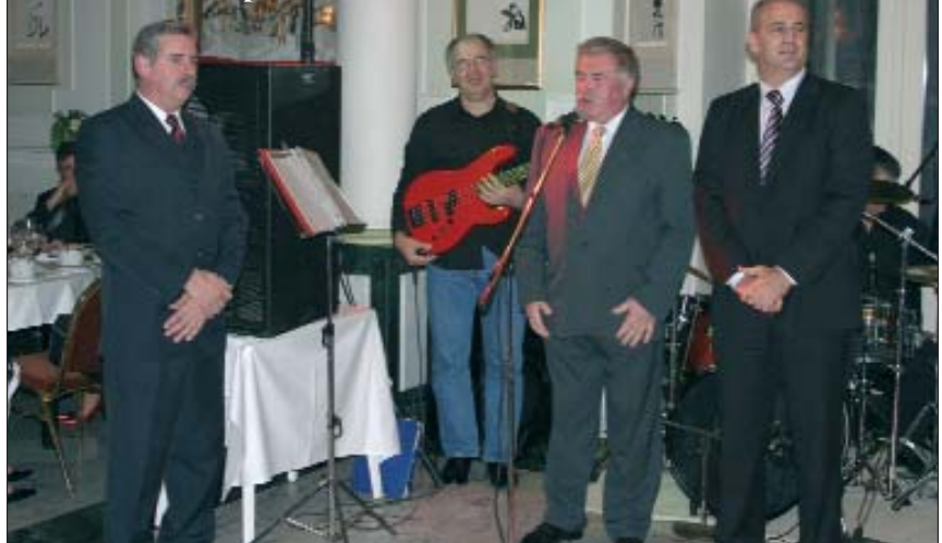
Goste su pozdravili (sliva): Franjo Grubić, predsjednik Koljnofškoga hrvatskoga društva, Mišo Hepp, predsjednik Hrvatske državne samouprave, te Ivan Bandić, veleposlanik Republike Hrvatske u Budimpešti