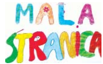
Izradila: Dijana Kovačić iz Fifehaza