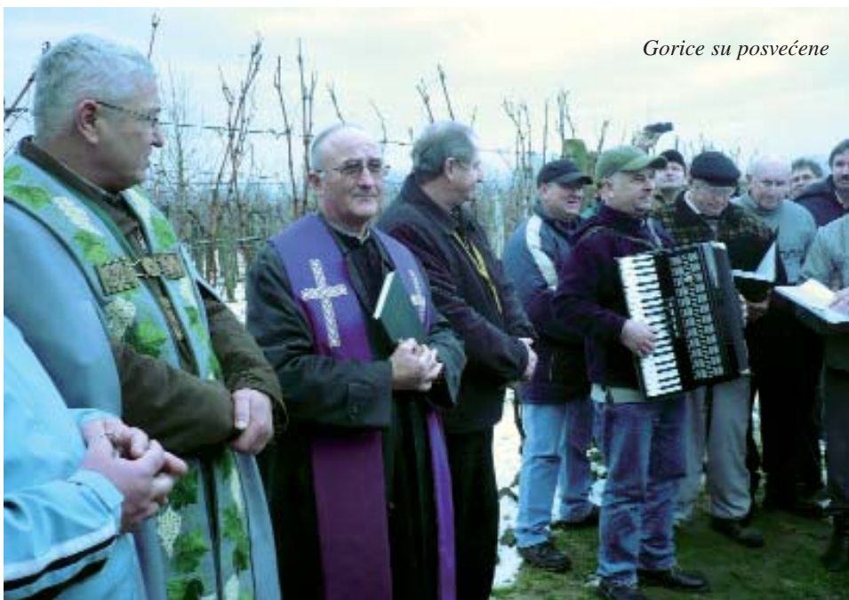
Gorice su posvećene

Otkako se osnovalo Društvo prijatelja vina u Sumartonu, tradicionalno se obilježavaju blagdani vezani uz vinovu lozu. Uz te se blagdane veže i Vinkovo, kada treba pogledati trs, gazda mora ritualno odrezati nekoliko grančica, po kojima se zatim nagada godina. Toga dana vinogradari zažele sretnu novu vinogradarsku godinu.