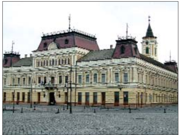
Gradska kuća na središnjem Trgu Svetog Trojstva u Baji (u pozadini zvonik župne crkve Svetog Antuna Padovanskog, nekadašnje franjevačke, hrvatske župe)

«Na naše zadovoljstvo, ova se suradnja širi i na ostala područja, i to sve snažnije na športskom području, počevši od džudaša do nogometaša. I na polju kulture, a budući da smo mi već u dva navrata imali izložbe naših umjetnika u Baji, upravo smo jučer dogovorili da ćemo ugostiti umjetnike iz Baje i upriječiti im izložbe. Razgovarali smo još i o suradnji u okviru projekta Zdravih gradova. To su programi koje mi vrlo uspješno radimo već četrnaest godina, bavimo se osobama od sedam do 77 godina. Imamo određene programe za svaku životnu dob, a posebno se posvećujemo djeci i mladima. I tu smo našli dodirnu točku s Bajom, radeći na programima sprečavanja