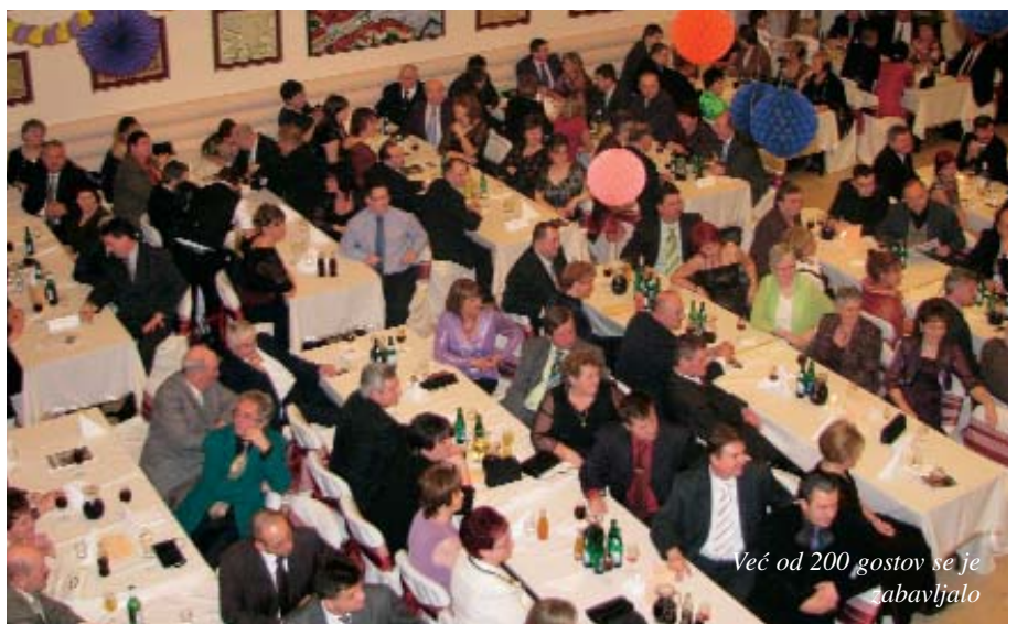
Već od 200 gostov se je zabavljalo