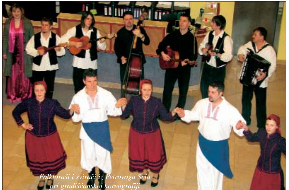
Folklorashi i svirači iz Petrovoga Sela pri gradišćanskoj koreografiji