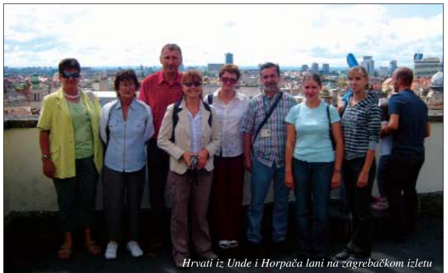
Hrvati iz Unde i Horpača lani na zagrebačkom izletu