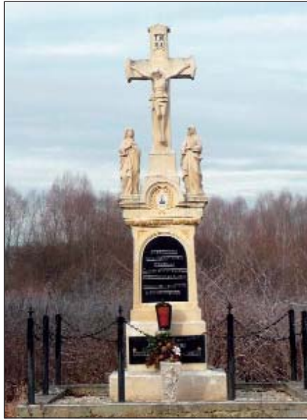
Za križom bi išla brza cesta, od zadnjega stana Plajgora udaljeno samo na 250 metarova

cem. Nažalost, na prethodni sastanki i većputi sam čuo da su rekli, a pak vi ste predložili tu treću varijantu, ali još i dandanas nismo našli toga človika ki je zapravo izmislio ta prijedlog. Morebit moj prethodnik, ki je počeo kupovati zemljišće uz granicu. Mislim da jedan načelnik nigdar to ne bi smio učiniti. I onako znate, više puta sam izjavio da je tomu već uzrokova da sam se ja naticao za načelnika. Sad ću nek reći jednu kvotu, sto ili dvisto tisuća forintova se more dobiti za tu zemlju ako tude će pojti autocesta. Za sto ili dvisto tisuća da si prodamo dušu ali selo? To se ne smi učiniti! Ali, nažalost, kad je takovih ljudi med nami ki nas prodadu, da tako velim, onda pravoda ovi uredi lako djeladu. Ja se ufam da čemo se moć suprotstaviti i dalje živiti prez autoceste S31. Kad Plajgor nije za prodaju!