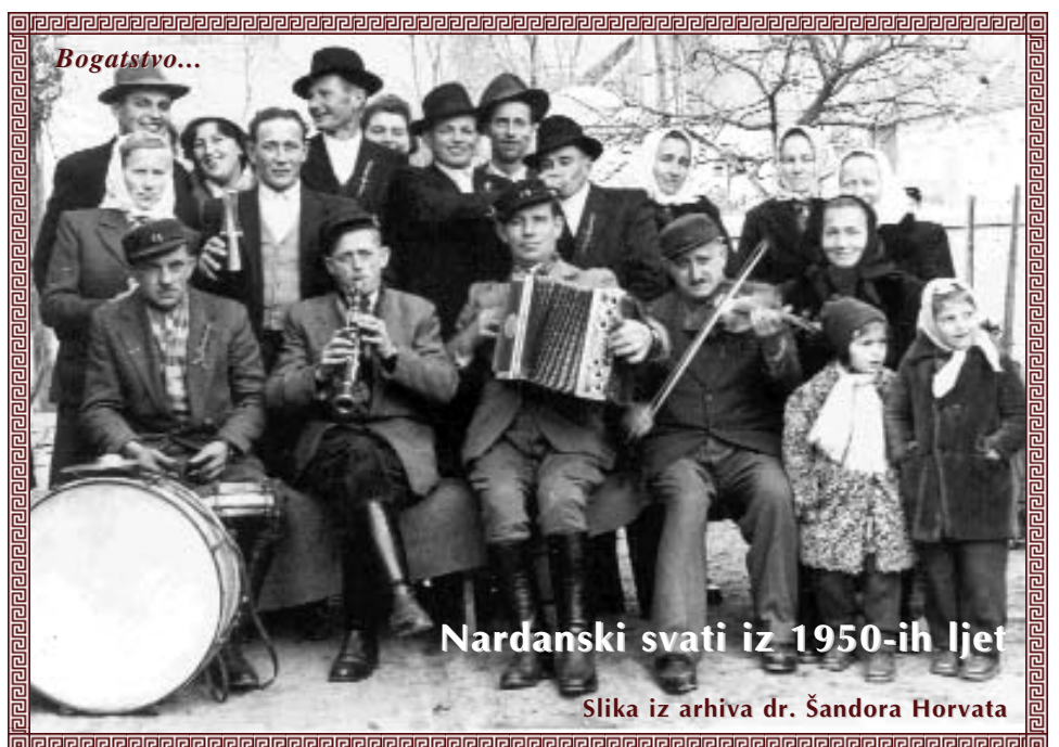
Nardanski svati iz 1950-ih ljet