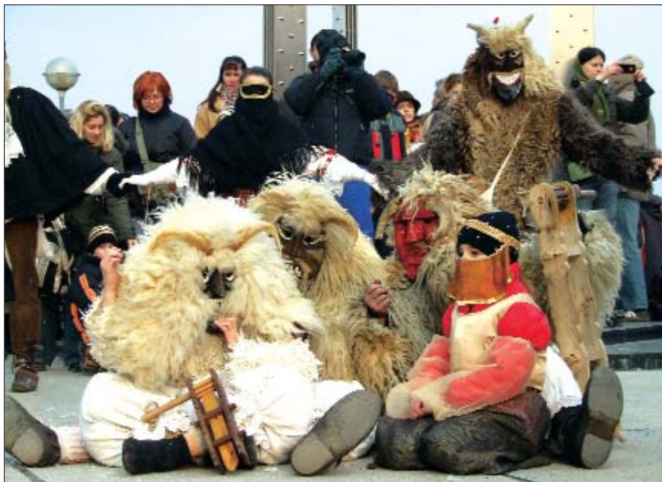
Skupina bušara mohačke Šokačke čitaonice „Poklade” predstavila se na otvorenoj sceni ispred milenijskoga spomenika

U podunavskom gradiću Mohaču, od 19. do 24. veljače priređen je Pohod bušara, tradicionalna pokladna i kulturna manifestacija kojom se obilježava završetak pokladnih događanja, odnosno zime, i najavljuje početak korizmenog razdoblja, dolazak proljeća. Na europski i svjetski poznatom pokladnom festivalu s jedinstvenim i prepoznatljivim bušama, s međunarodnom smotrom folklora s više samostalnih i zajedničkih nastupa domaćih i gostujućih KUD-ova, prije svega iz prijateljskih gradova, među njima i iz Belog Manastira iz Hrvatske, zatim iz Francuske, Njemačke, Poljske i Turske, te uz brojne popratne sadržaje, izložbe, sajmove i drugo, u pohodu bušara i ove je godine sudjelovalo 25 bušarskih skupina i više od 300 bušara. Nekadašnji šokački običaj, već desetljećima priređuje se kao velika gradska manifestacija u organizaciji gradske samouprave, ali je među suorganizatorima vrlo bitna uloga udruga i ustanova šokačkih Hrvata u Mohaču, Hrvatske manjinske samouprave, Šokačke čitaonice i njezine bušarske skupine Poklade, Tamburaškog sastava Šokadija i Dječje plesne skupine, TS Orašje te dvaju mjesnih KUD-ova: «Mohač» i «Zora» s Vade, kako je bilo i ove godine. Kako je uz ostalo naglašeno, ova bi se manifestacija zbog svoje duge tradicije i umjetničke vrijednosti, od sljedeće godine trebala održavati pod pokroviteljstvom UNESCO-a, čiji su promatrači pratili događaje ove godine.