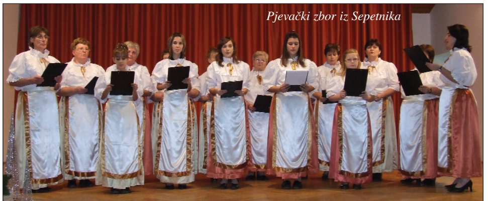
Pjevački zbor iz Sepetnika

Orkestar «Vizin» – Pečuh Orkestar «Čabar» – Baja