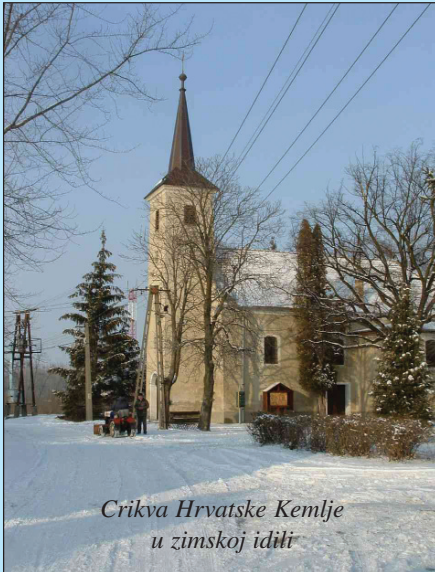
Crikva Hrvatske Kemlje u zimskoj idili