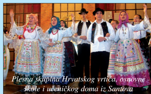
Plesna skupina Hrvatskog vrtića, osnovne škole i učeničkog doma iz Santova