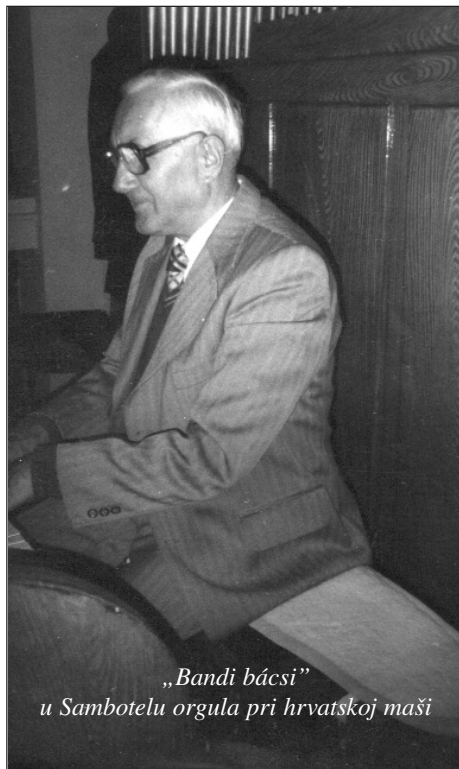
„Bandi bácsi“ u Sambotelu orgula pri hrvatskoj maši

Koliko je zgubilo Petrovo Selo da je „mladi školnik“ na sve vijeke bil otkinut od rodno-ga mista, od mista ditinstva i lipe mladosti. Koliko vridnosti se rasprudilo zbog nepravi-