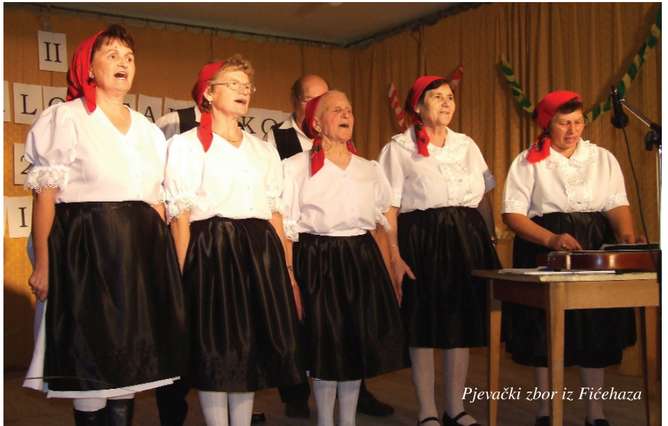
Pjevački zbor iz Fičehazu

Žitelji hrvatskih pomorskih naselja vrlo rado pjevaju i slušaju hrvatske pučke pjesme, a pojavljivanjem tamburice u regiji, pjesme su postale omiljenije i među mladim naraštajima. Nastup zborova na susretima uvijek je dobra prigoda da se nauči pokoja nova pjesma, da se druži korisno u duhu gajenja hrvatske kulture. Pred kraj godine ustrojen je Susret zborova u Fičehazu i u Sepetniku.