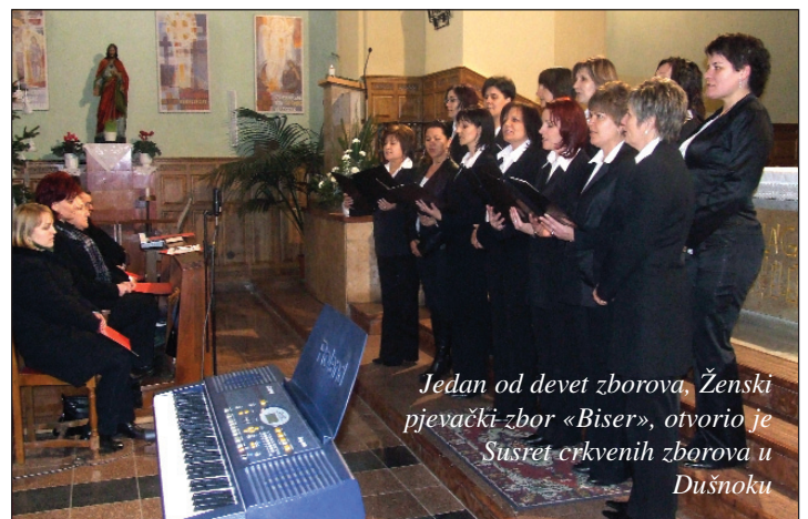
Jedan od devet zborova, Ženski pjevački zbor «Biser», otvorio je Susret crkvenih zborova u Dušnoku