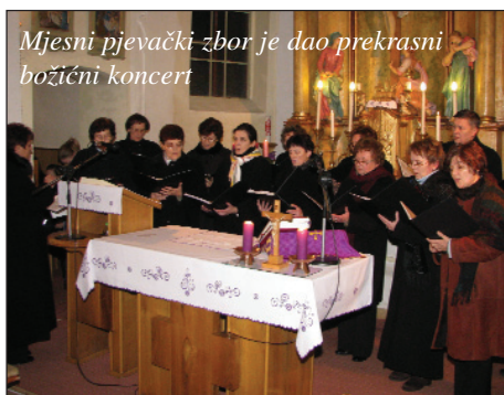
Mjesni pjevački zbor je dao prekrasni božićni koncert