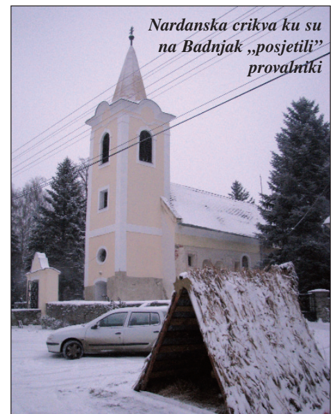
Nardanska crikva ku su na Badnjak „posjetili” provalniki