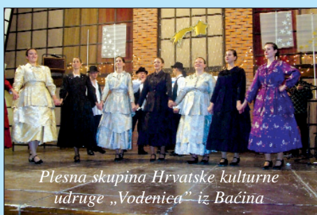
Plesna skupina Hrvatske kulturne udruge „Vodenica” iz Bačina

BAJA – Na svečanoj završnici IX. županijske narodnosne smotre folklor za djecu i mladež, koja je 18. prosinca priređena u povodu tradicionalnog Dana manjina u bajscome Njemačkom prosvjetnom središtu, nastupilo je deset najboljih narodnosnih društava, pjevačkih zborova i orkestara, među njima Plesna skupina Hrvatskog vrtića, osnovne škole i učeničkog doma iz Santova, Ženski trio „Dušenici” iz Dušnoka i plesna skupina Hrvatske kulturne udruge „Vodenica” iz Bačina. Dodajmo da su im nakon nastupa nagrade, koje su osigurali Generalni konzulat Republike Hrvatske u Pečuhu, Hrvatska državna samouprava i Savez Hrvata u Mađarskoj,