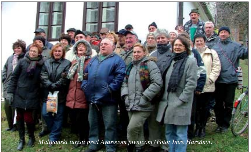
Maliganski turisti pred Avarovom pivnicom

Lani u januaru na Maliganskoj turi sam tek doznala da pravi „maliganski turisti” su oni ki sudjeluju ne samo kod kušanja vina na zimskoj turi nego vridni pomagači su i u branju grojza. Zbog toga sam se i ja priključila onoj tridesetčlanoj četi ka je napala Štefanićev vinograd u kiseškoj gori. S takovim veseljem i brzinom smo brali grozdace prošle jeseni 19. septembra da do otpodneva gospodari već nisu imali mjesta za ubrani plod.