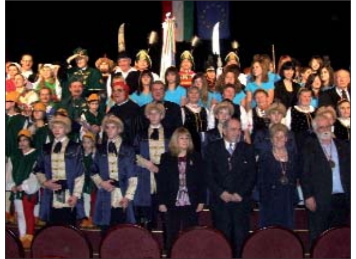
Svi sudionici gala programa