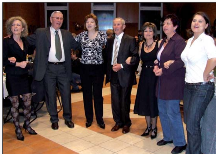
Veselilo se i uz pjesmu

Bez njega ne prođe nijedna bunjevačka priredba, a još manje bunjevačka zabava u Baji. Prvi je kada se treba veseliti. Još i danas je među prvima kada se zaigra kolo, zapjevaju bunjevačke pjesme.