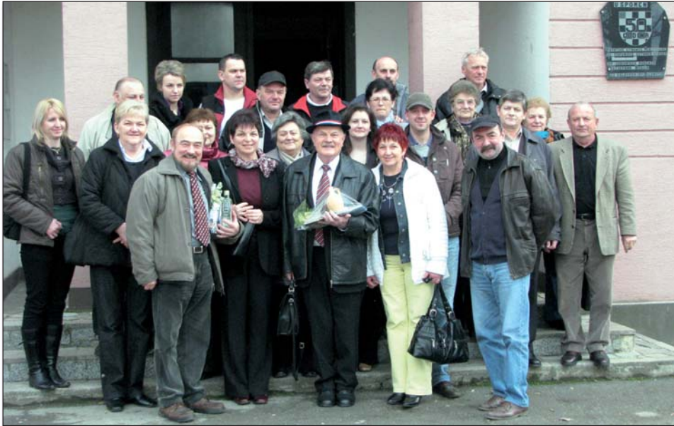
Petrovišćani s domaćini pred Hrvatskim seljačkim domom u Hercegovcu

Igrokazačko društvo iz Petrovoga Sela pred trimi ljeti je zadnji put gostovalo u Hercegovcu, na spravišću hrvatskih pučkih teatrov, ali vik smo se s nekakvom mistikom spominjali turneje u staroj domovini, kade smo prik toliko ljet mogli najti nove prijatelje, kade smo, vjerujem, i što-to naučili, kade smo točno šest put prezentirali da još egzistiramo Gradišćanski Hrvati u pograničnoj zoni Ugarske i Austrije, a tamošnjoj publiku i dokazali da je kod nas želja za očuvanjem jezika ter kazališća od svih preprekova jača.