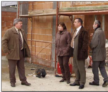
Na gradilištu nove športske dvorane