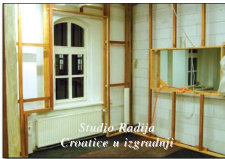
Studio Radija Croatice u izgradnji

Povezivanje medijskoga prostora obuhvaća radijske postaje iz triju susjednih zemalja,