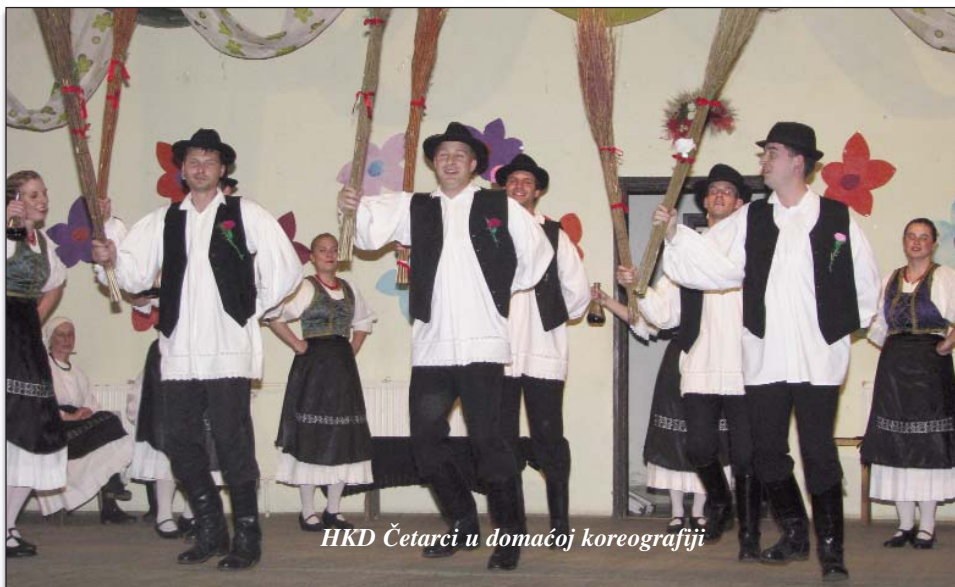
HKD Četarci u domaćoj koreografiji