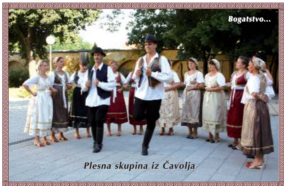
Plesna skupina iz Čavolja