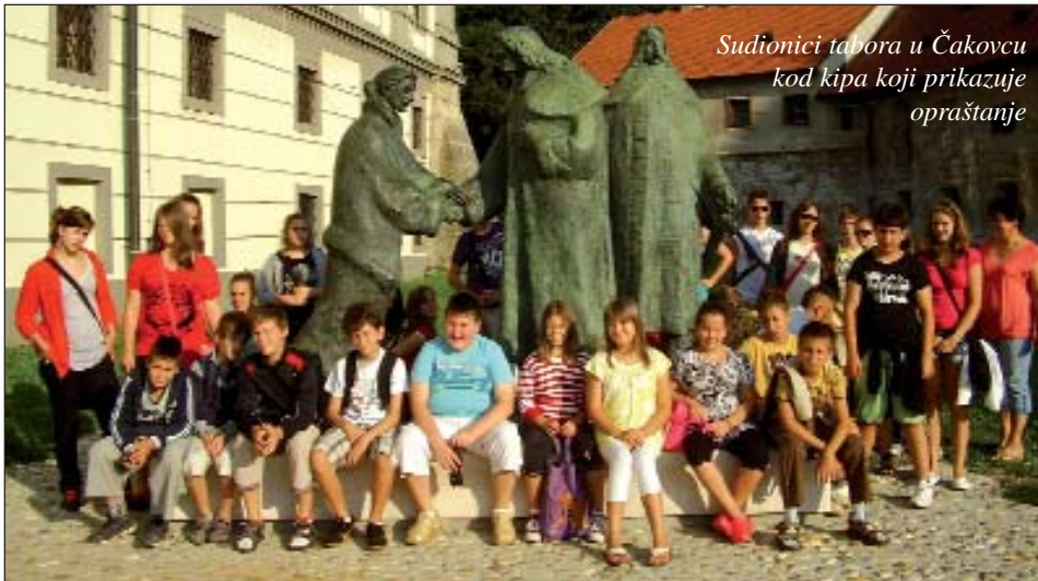
Sudionici tabora u Čakovcu kod kipa koji prikazuje oproštanje

Poslovanje, pronalaženje doma, prehrana, rekreacija, sve su to sastavni dijelovi svakodnevnog života koje su ovaj put vježbali učenici Osnovne škole „Katarina Zrinski“ od 15. do 21. kolovoza u okviru tabora pod naslovom „Kako upravljati svojim životom i tragovima obitelji Zrinskih“. Ovaj put osim tradicionalnih sadržaja sudionici su imali mogućnost saznati vrlo mnogo o hrvatskoj povijesti kroz izlet preko gradova Zrinskih.