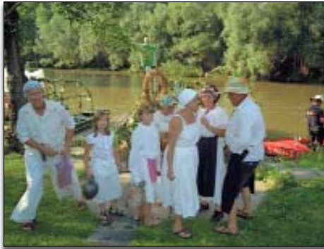
Diskusija na Cviki pred odlaskom

Na otvorenoj velikoj pozornici je bio ispred kulturnog doma za svakoga nešto interesantnoga. U programu su bili popularni pjevači, umjetnici i domaća društva, a oko kulturnoga doma na obali Dunaja su bili programi za dicu (maskiranje lica, rukotvorine, igračke itd.). Do večera se cijela