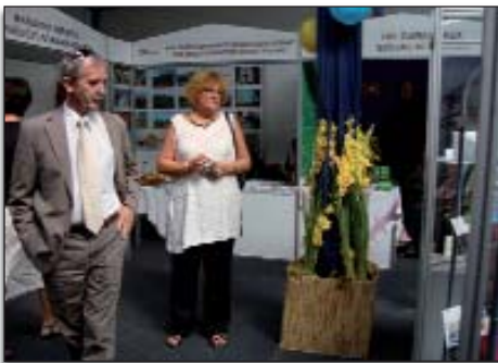
Sajam je posjetila i generalna konzulica Ljiljana Pancirov

Na 17. međunarodnom sajmu poljoprivrede „Gazdanapok” u Selurincu, od 13. do 15. kolovoza, na temelju Sporazuma o suradnji ŽK Virovitica i Baranjskoga županijskog poduzetničkog centra Pečuh, u organizaciji ŽK Virovitica svoje proizvode izlagalo je 11 izlagača iz Virovitičko-podravske županije. Sajam su posjetila i izaslanstva gospodarstvenika iz te županije. Predstavnici sajma „Gazdanapok” i „Viroexpo” 14. su kolovoza razmijenili iskustva o organizaciji sajmova te zaključiti koliko ti sajmovi pridonose razvoju domaćih gospodarstava i povećanju međusobne vanjskotrgovinske razmjene.