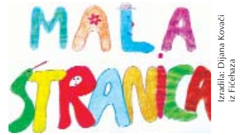
Izradila: Dijana Kovačić iz Fičehaza