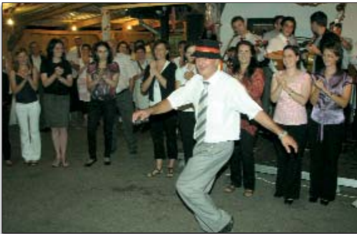
Soloplesaću HKD-a Gradišće nije bilo teško pokazati svoje znanje