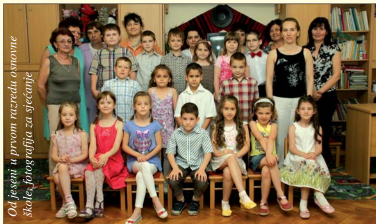
Od jeseni u prvom razredu osnovne škole, fotografija za sjećanje

PEČUH – Kako za Hrvatski glasnik kaže voditeljica pečuskoga Hrvatskog vrtića Anka Polić Bunjevac, vrtić sada pohađa 67 djece s kojima se radi u tri mješovite odgojne skupine. O djeci se brine šest odgajateljica i nekoliko tetica te tete na kuhinji. Opraštanje u tom vrtiću bilo je 9. lipnja, a okupili su se roditelji, djelatnici vrtića i, naravno, mali pitomci, koji su nas obradovali prigodnim programom. Vrtić od nove školske godine napušta 17 djece, od kojih njih 16 svoje školovanje počinje u Hrvatskoj školi Miroslava Krležu u sklopu koje i djeluje spomenuti vrtić. Sva su djeca hrvatskoga podrijetla. Od jeseni u vrtić dolazi 22 nova polaznika; prijavljenih je bilo i više, ali zbog nedostatka mjesta nekoliko njih, nažalost, odbijeno je. U srpnju je u vrtiću odmor.