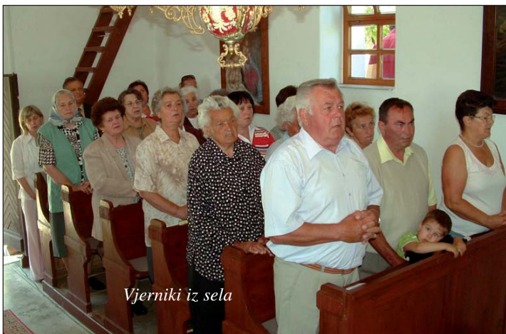
Vjerniki iz sela