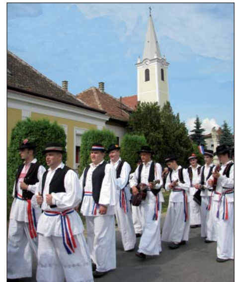
Slavonska glazba i nošnja nije tudja na undanski ulica