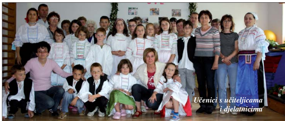
Učenici s učiteljicama i djelatnicima