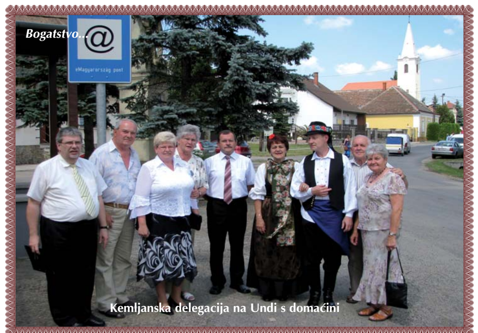
Kemljanska delegacija na Undi s domaćini