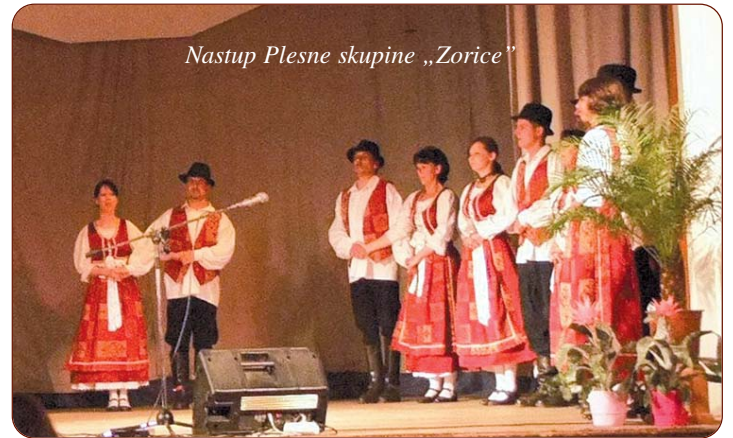
Nastup Plesne skupine „Zorice”

Hrvatska manjinska samouprava grada, Hrvatski turistički ured i Prva hrvatsko-mađarska agencija za razvoj poduzetništva 13. svibnja 2011. g. organizirala je Hrvatski turistički i gastronomski festival pod naslovom Kraljevski stolovi. Glavni pokrovitelji Festivala bili su biskup Antal Spányi, gradonačelnik András Cser-Palkovics.