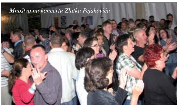
Mnoštvo na koncertu Zlatka Pejakovića