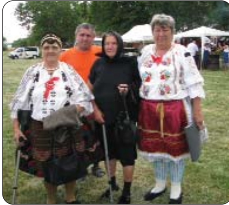
Oni su na svim hrvatskim priredbama

Vršenska Hrvatska samouprava te Vjerska i kulturna udruga šokačkih Hrvata još od početka kalendarske godine promišljaju o spomenutom Festivalu koji je postupno postao zaštitnim znakom sela Vršende. Započeli su ga, naravno, šokački Hrvati, on je „otuden“ od njih tijekom godina i oni ga nisu više smatrali svojim, a ove godine on im se, dakako, kao dobrim organizatorima, nakon neuspjeha nekih drugih, vratio. Naime Festival „Ovca i ovčji rep“ prije šest godina pokrenut je na poticaj Hrvatske samouprave sela Vršende. Ubrzo se u njegovu organizaciju uključila i mjesna samouprava i druge manjinske samouprave tog naselja, Nijemci, Cigani. Nakon nekoliko godina Hrvati su uvidjeli kako su izgubili spomenuti Festival te lani nisu sudjelovali u njegovoj organizaciji, priredili su samostalno okupljanje pod nazivom Šokački piknik. Ove su se godine prihvatili organiziranja Hrvatskoga kulturnog i gastronomskog festivala „Ovca i ovčji rep“, stoga je trebalo dobro organizirati i šokačke Hrvate u