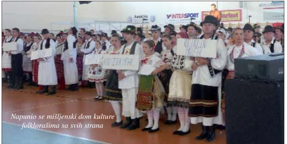
Napunio se mišljenski dom kulture folklorasima sa svih strana

Dobili smo sredstva na natječaju, ali smo sada u teškom stanju, i bez novaca u džepu organiziramo ovu dvodnevnu manifestaciju. Radi se o projektu s naknadnim financiranjem i ni sami nismo znali koliko će nam teško biti ostvariti današnja događanja, kaže za Hrvatski glasnik, predsjednik mišljenske Hrvatske samouprave i udruge Naši ljudi dok trčkara kako bi provjerio je li sve u redu. Naime dio sudionika je na misi, dio tek dolazi, a dio je već obukao svoju narodnu nošnju i proba korake za nastup na velikoj pozornici na otvorenome pokraj tamošnje športske dvorane.