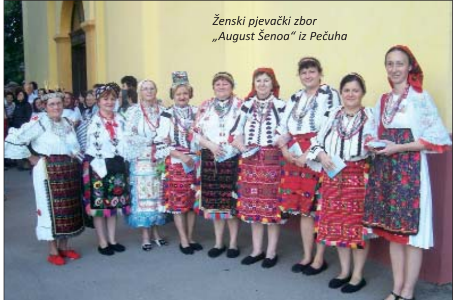
Ženski pjevački zbor „August Šenoa“ iz Pečuha

U organizaciji KUD-a Hrvata „Bodrog“ iz Bačkog Monoštora, 9. srpnja šesti put je održan Međunarodni festival Marijanskoga pučkog pjevanja u crkvi Svetog Petra i Pavla u Bačkome Monošturu (Vojvodini). Festivalu se odazvalo osam pjevačkih skupina, zborova iz Vojvodine, Hrvatske i Mađarske. Hrvate iz Mađarske predstavljao je Ženski pjevački zbor „August Šenoa“ iz Pečuha.