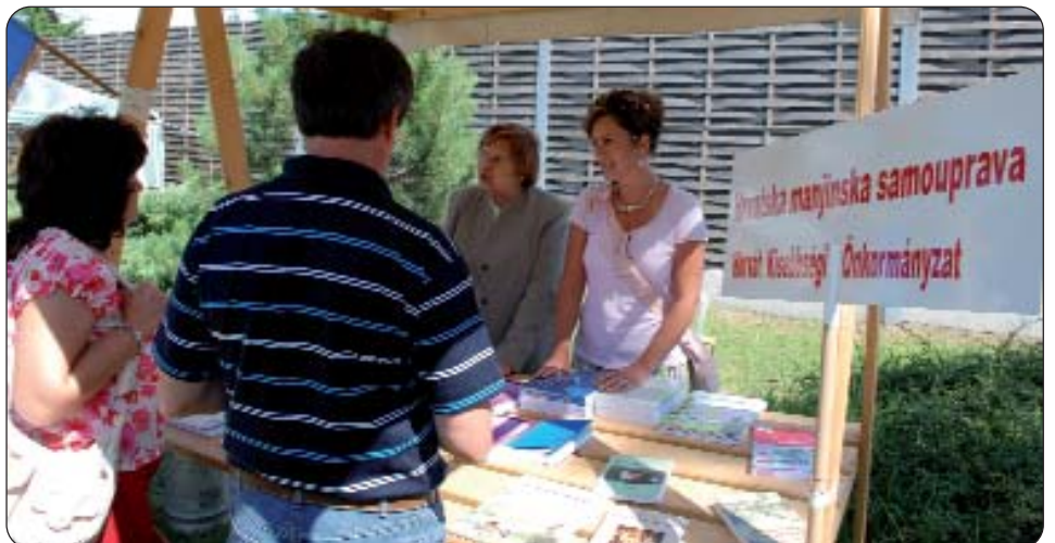
Štand Hrvatske samouprave s hrvatskim izdanjima bio je dobro posjećen