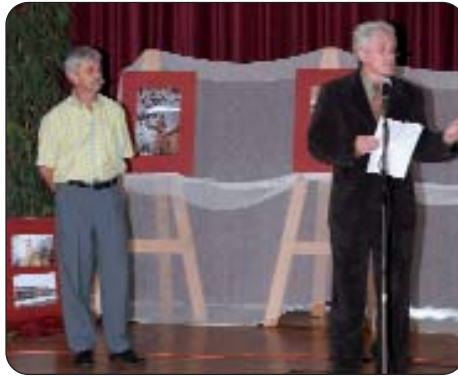
Izložbu fotografija Stipana Malacka otvorio je načelnik grada Tukulje Pál Hoffman

U organizaciji središta za kulturu i knjižnice grada Tukulje, 25. lipnja u dvorištu doma kulture priređen je Dan narodnosti i civilnih udruga. Prijepodne je proteklo u znaku raznovrsnih programa za djecu i pripremanja ukusnih jela, a poslijepodne u nastupu umjetničkih skupina nacionalnih manjina i civilnih udruga te u zajedničkom veselju do kasnih sati.