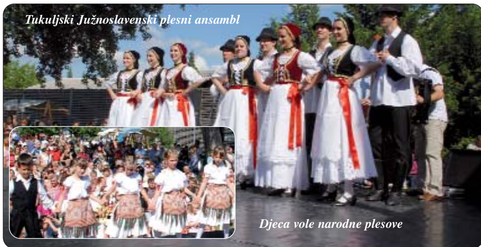
Djeca vole narodne plesove

sam dobio svoj prvi fotoaparat kao šestogodišnji dječak, kaže nam. Zaljubljenik u fotografiju, priča kako je i prije deset godina povodom svečanosti proglašenja Tukulje gradom imao samostalnu izložbu, a uskoro priprema i sljedeću. Bilježi nastupe Crkvenoga zbora, Muškoga zbora rackih Hrvata, Orkestra, Plesne grupe... groblja i nadgrobnih spomenike od kojih neki datiraju s početka 19 stoljeća... Kako kaže „nestajemo, učinili smo puno grešaka, i ja imam tri kćerke s kojima nisam razgovarao na hrvatskom jeziku, nisam ih naučio hrvatski. Osjećaju narodnu umjetnost, vole svoje korijene i ponose se njima, ali jezik ne govore, ili točnije nemaju ga hrabrosti govoriti, kao ni ja“.