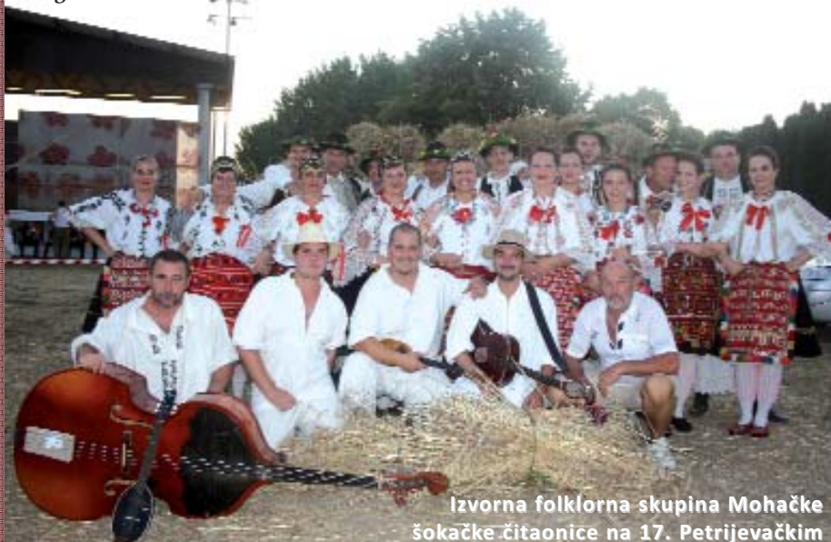
Izvorna folklorna skupina Mohačke šokačke čitaonice na 17. Petrijevačkim žetvenim svečanostima u Hrvatskoj