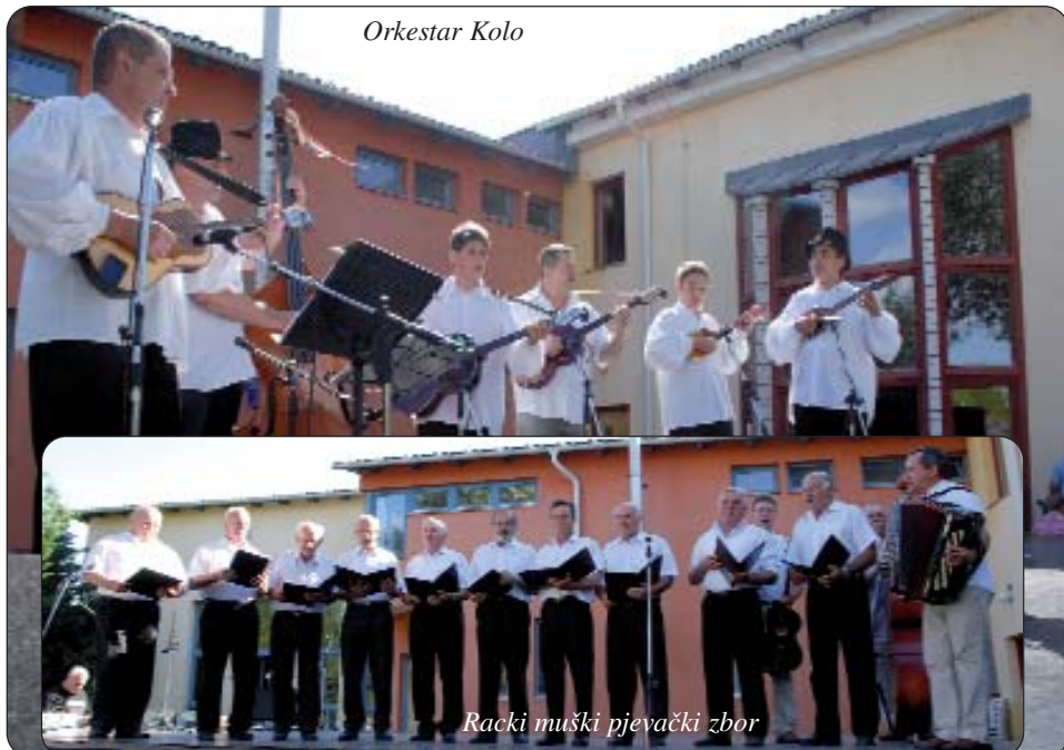
Racki muški pjevački zbor