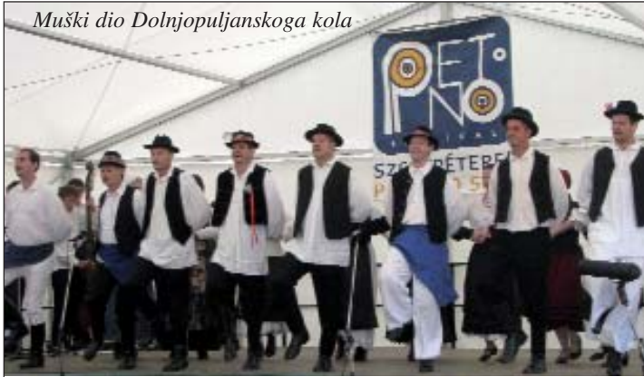
Muški dio Dolnjopuljanskoga kola

Prvi vikend u juliju sad jur duga ljeta je vik zauzet u Petrovom Selu. Osvojio ga je organizacijski štab HKD-a „Gradišće“ u čiju profesionalnost ni sjenke sumnje ne more pasti. Sad jur tradicionalni etno-pop-rock festival, u znaku različitih muzičkih stilova, pod imenom PETNO, lip kup ljudi sabere pri zabavi, druženju i veselju. Kako se je to i najpr znalo, PETNO je još jednoč bio dobro poiskan. Ljetos nismo se morali splašiti, hoće li oprati godina ov skup, kad su se organizatori odlučili, postaviti će široki šator na dvoru Kulturnoga doma za svaki slučaj, a privremeni „krov“ je dobrodošao i suprot godine, a i sunca.