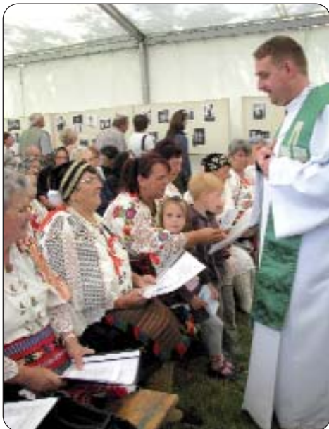
Na misi na otvorenome

selu i njihove mnogobrojne prijatelje kako bi Festival što bolje uspio. Iako je najavljivano ružno vrijeme, organizatorima je ipak nebo bilo naklonjeno, pa se mogla naložiti vatra i kuhati i u kotličima na nogometnom igralištu gdje se i službeno odvijala priredba u velikom šatoru i oko njega. Brojni vlasnici podruma u Orašju toga su dana otvorili svoja vrata i založili vatru u svom dvorištu, bilo za kotlić ili gril, ili nešto ozbiljnije. Najaktivniji su bili