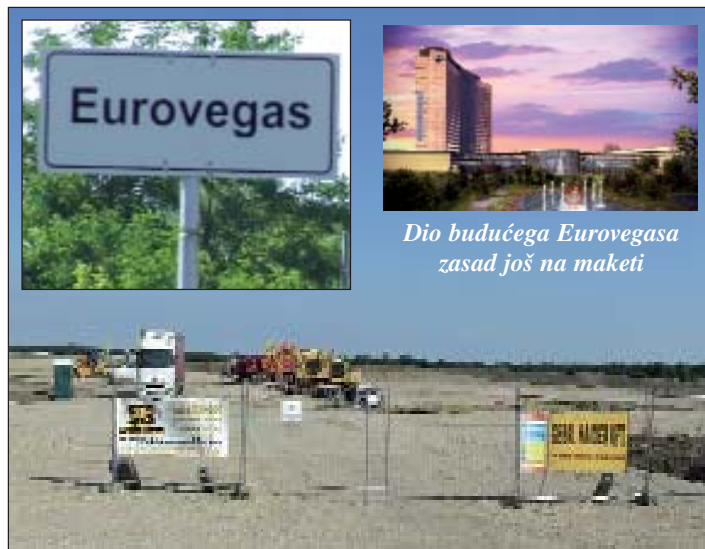
Dio budućega Eurovegasa zasad još na maketi