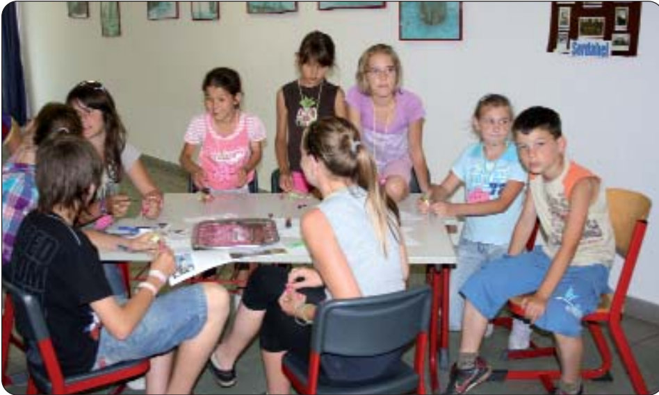
Na hrvatskom kvizu

Tabor življenja i upoznavanja zavičaja, koji već godinama organizira Osnovna škola «Katarina Zrinski» u Serdahelu, održan je od 27. lipnja do 1. srpnja s nizom zanimljivih programa: igrom burze, traženjem blaga, hrvatskim kvizom, biciklističkim rutama, športskim igrama i izletom u Pečuh i Abaliget.