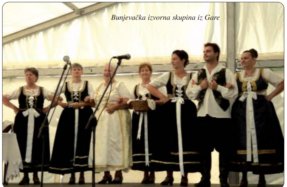
Bunjevačka izvorna skupina iz Gare

selu i njihove mnogobrojne prijatelje kako bi Festival što bolje uspio. Iako je najavljivano ružno vrijeme, organizatorima je ipak nebo bilo naklonjeno, pa se mogla naložiti vatra i kuhati i u kotličima na nogometnom igralištu gdje se i službeno odvijala priredba u velikom šatoru i oko njega. Brojni vlasnici podruma u Orašju toga su dana otvorili svoja vrata i založili vatru u svom dvorištu, bilo za kotlić ili gril, ili nešto ozbiljnije. Najaktivniji su bili