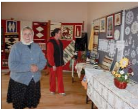
Izložba u domu kulture

Po svemu sudeći, isplatilo se veliko ulaganje, nema vikenda da se ne bi nešto događalo u Keresturu, naravno, i preko tjedna vrlo je živo. Samo od Nove godine održano je gotovo četrdeset priredaba u njihovim prostorijama, i to ne samo mjesnih nego i županijskih, mikroregijskih i regijskih. Mali nogometni turniri redovito se organiziraju u športskoj dvorani, stižu nogometaši i iz Kaniže i okolnih mjesta, bio je već ustrojen kup stolnog tenisa, a pokrenut je i tečaj karatea, zumba-gimnastike, klub fotografa, a tamo vježbaju i plesači osnovne škole, Zrinski kadeti i, daka-ko, održavaju se sati gimnastike, književne večeri, izložbe, natjecanja za djecu počevši od ručnih radova do slikanja i recitiranja. Želi li se tko rekreirati u Keresturu, sigurno će pronaći nešto za sebe.