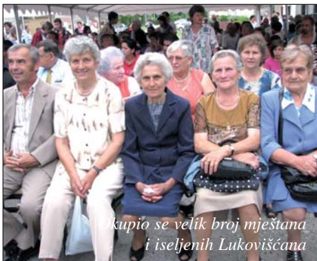
Okupio se velik broj mještana i iseljenih Lukovišćana

kako ova titula obvezuje na daljnji predani istraživački rad i širenje glasa o svome rodnom selu gdje god je to moguće.