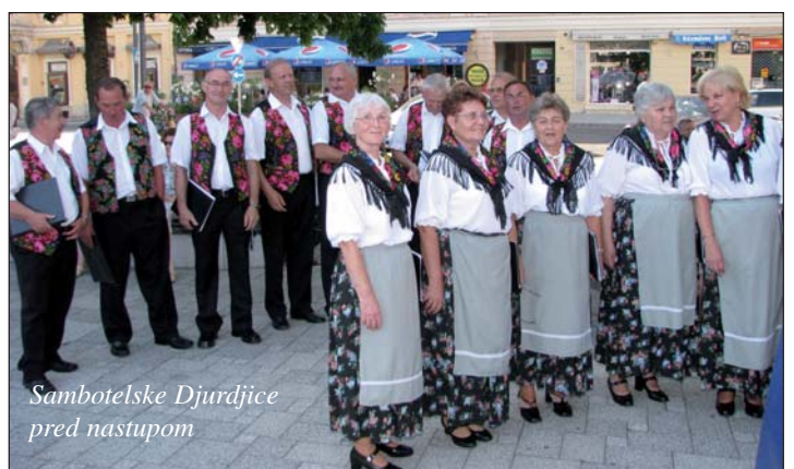
Sambotelske Djurdjice pred nastupom