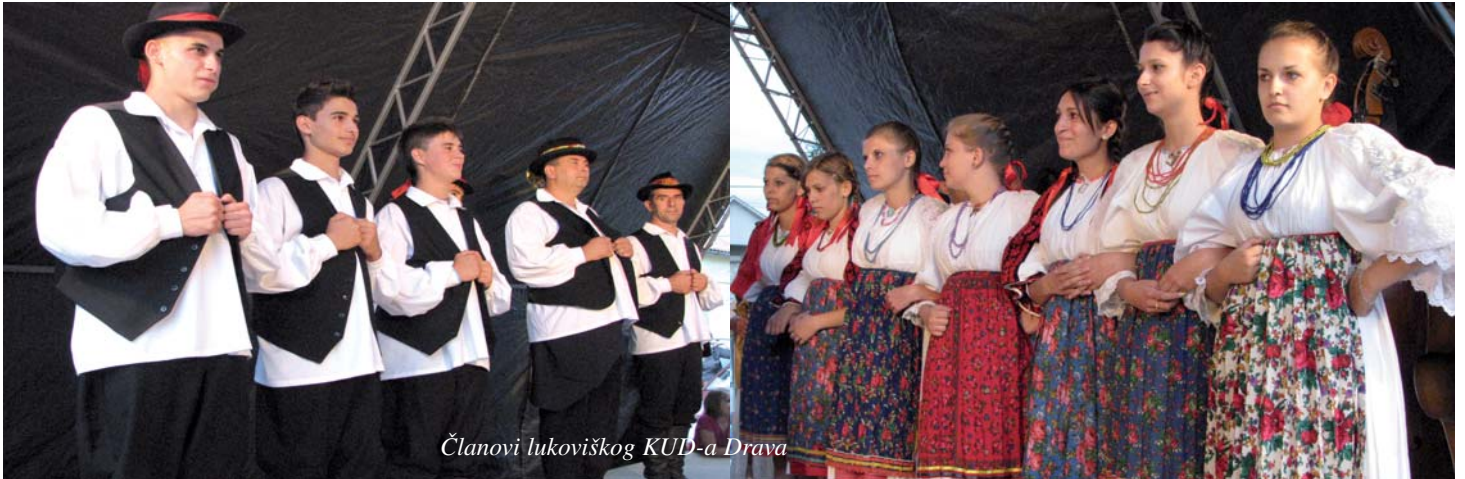
Članovi lukoviškog KUD-a Drava