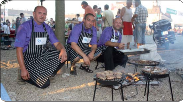
Gosti iz Biograda pripremali su tunjevinu na roštilju

Iako je dojam da je bilo osjetno manje gostiju nego tamo negdje prije deset godina, kada je priredba doživljavala svoj vrhunac, Bajska fišijada opet je okupila na desetke tisuća sudionika i gostiju, među kojima su bili i viđeni ljudi iz javnog života, političari, umjetnici, pjevači, glazbenici i športaši.