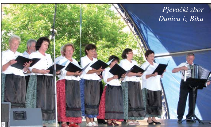
Pjevački zbor Danica iz Bika