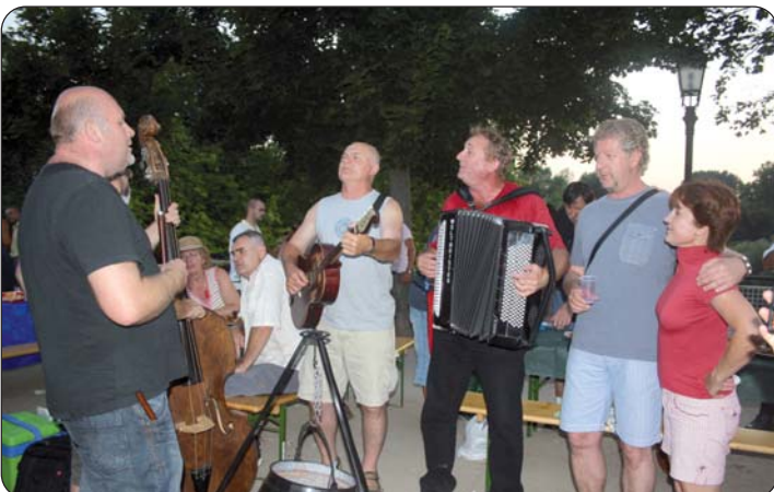
Kad se je kotlić ispraznio, zasvirale su tambure i harmonika, počela je pjesma – društvo iz Kujinja i Pečuha