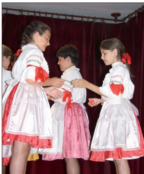
Pomurski običaji «Atko matko»

U organizaciji Kulturnog i športskog društva te Hrvatske manjinske samouprave u Serdahelu, krajem lipnja priređena je Hrvatska kulturna večer čiji je gost bio Kulturno-umjetničko društvo Tanac, a na večeri su nastupile i domaće kulturne skupine i solisti.