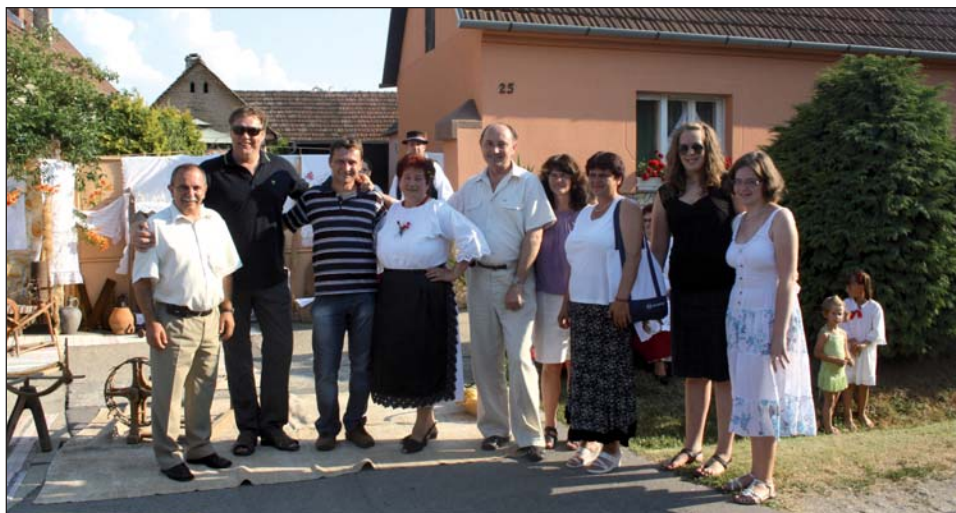
Izaslanstvo iz Santova u društvu domaćina na etnoizložbi ulicama naselja