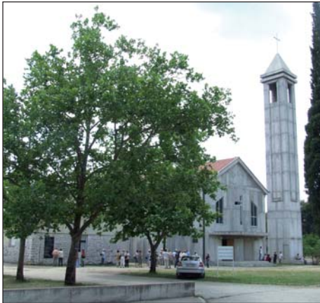
Pokraj glavne ceste prema Međugorju na župnoj crkvi Presvetog Trojstva Blagaj-Buna u mjestu Buna postavljena je spomen-ploča u znak sjećanja