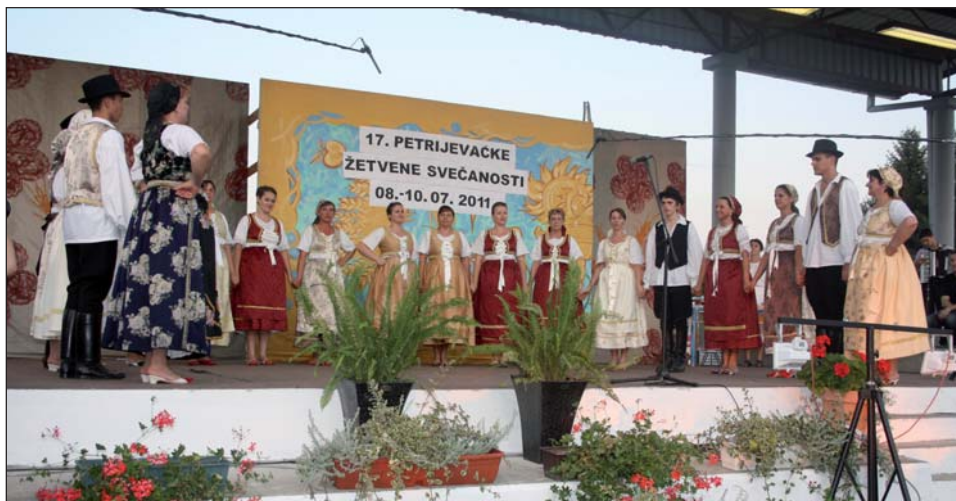
KUD „Bunjevački kulturni krug” iz Čavolja