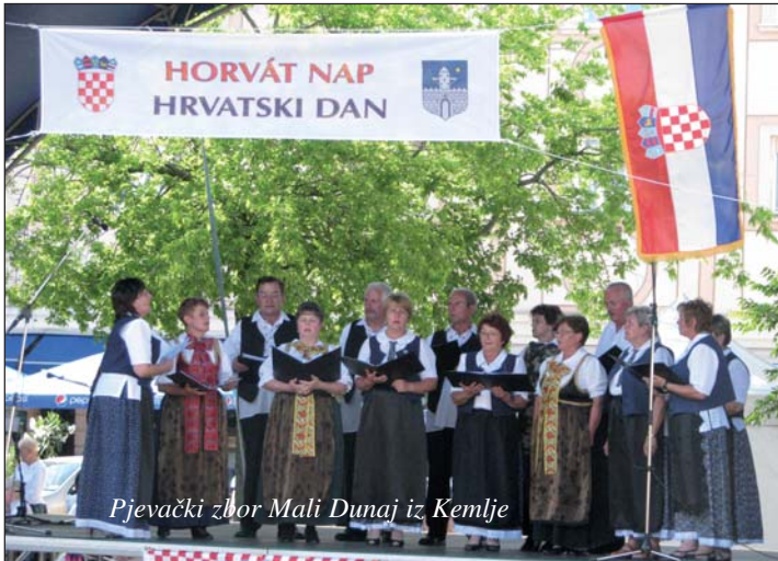
Pjevački zbor Mali Dunaj iz Kemlje