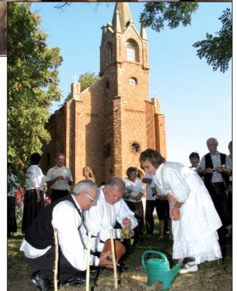
Sadjenje „kinča od kinčev“

Skupna jačka je značila kraj službenoga dijela ovoga programa, ali potom je još dugo do kasnoga večera duralo druženje i večera uz sviče. Bilo je to spravišće Hrvatov iz cijele okolice ki su ovde vjerojatno po Jankovićevim slijedi našli idealno mjesto na daljnje svečevanje, jer to su pri zbogomdavanju mnogi rekli da bi se na ovom svetišću i većkrat rado strefili!