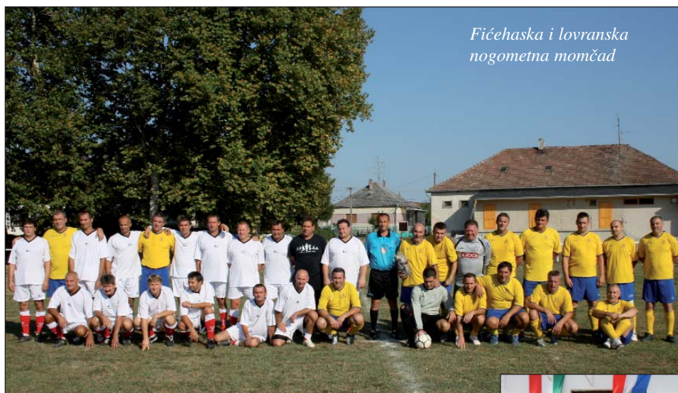
Fičehaska i lovranska nogometna momčad

Hrvatska manjinska samouprava sela Fičehaza 17. rujna 2011. g. priredila je Hrvatski kulturni dan koji se odvijao u duhu međunarodnog druženja s prijateljima iz Donjeg Vidovca i Lovrana. Organizirana je prijateljska nogometna utakmica veterana, kulturni program i zabava.