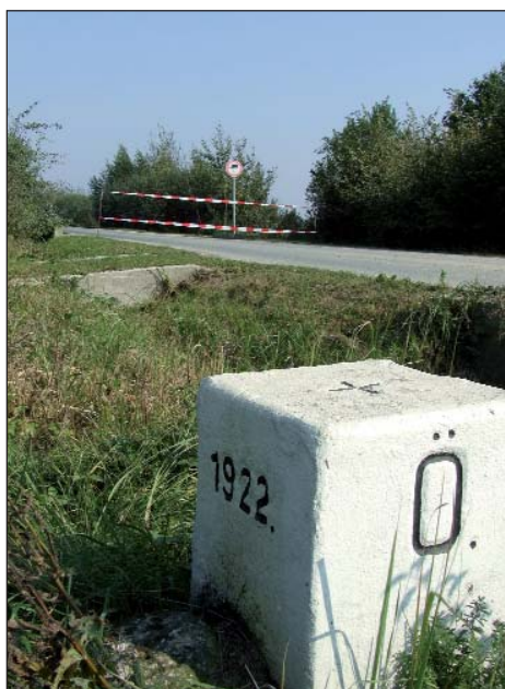
Diboko na ugarskom području nepravilno su postavili susjedi prvi kordon