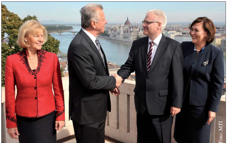
Predsjednici Pál Schmitt i Ivo Josipović sa suprugama