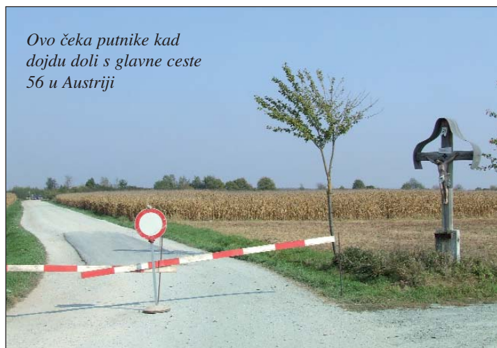
Ovo čeka putnike kad dojdu doli s glavne ceste 56 u Austriji