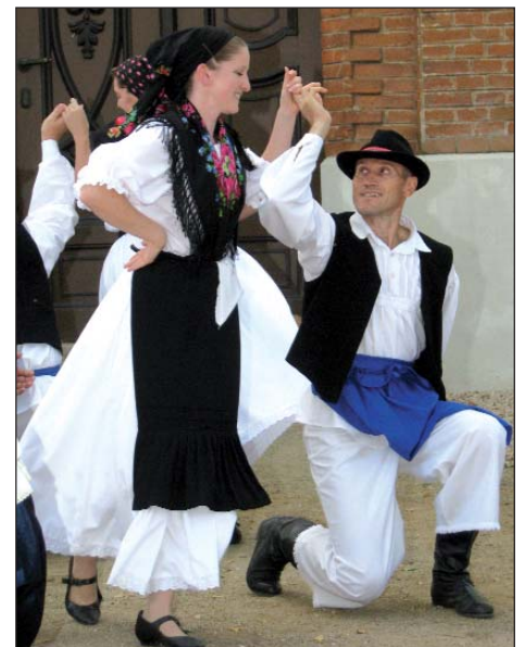
Par iz HKD-a Čakavci iz Hrvatskoga Židana