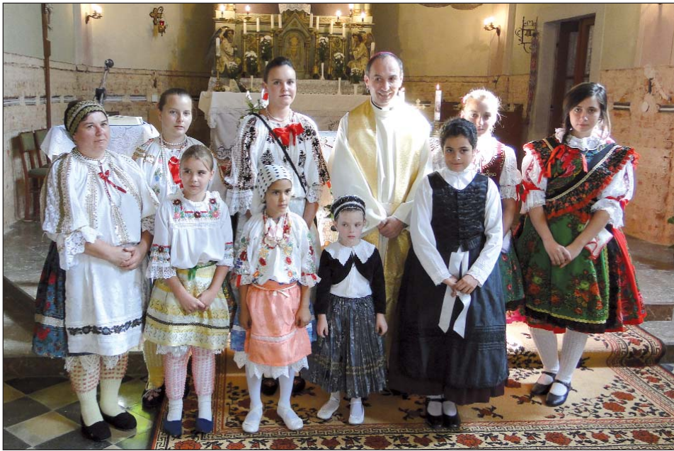
U povodu sto godina postojanja katolijske crkve, 25. rujna misu je služio pečuški biskup György Udvardy

Stara crkva koja je bila izvan sela, 1910. g. je srušena. Temelj nove crkve postavljen je iste godine, ali zbog manjka novčanih sredstava podignuta je tek 1911. g. Posvetio ju je Adalbert Schmidt, hosuhetenjski dekan župnik. Crkva je duga 17,7, široka 9 m. Ima tri ulaza, u tornju ima dva zvana, jedno je lijevano u Grazu. U crkvi na zidu može se vidjeti 14 postaja i dva kipa: Srce Isusovo i Blažena Djevica Marija. Iznad oltara je slika Svete