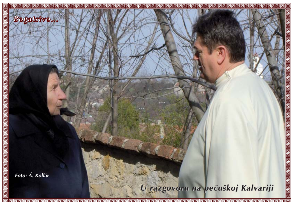
U razgovoru na pečuškoj Kalvariji