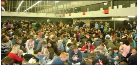
Objed u stadionu

Petrovišćanke na „Hodočašću povjerenja na Zemlji”