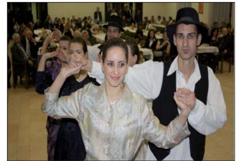
Članovi KUD-a „Vodenica”

Nakon izvođenja prve i do danas najpoznatije preljške pjesme Kolo igra u pratnji TS «Orašje», uslijedio je prigodni program u kojem su članovi KUD-a „Vodenica” iz Bačina u pratnji TS „Zabavna industrija” izveli splet bunjevačkih i slavonskih hrvatskih plesova, a uz plesno umijeće posebno su oduševili istovremenim pjevanjem, što je doista pohvalno. Dodajmo kako je društvo u Bačinu utemeljeno još u listopadu 1999. godine s 24 člana. U proteklom razdoblju bilo je nekih promjena u članstvu, a do danas podmladak im dolazi iz osnovne škole. Na repertoaru