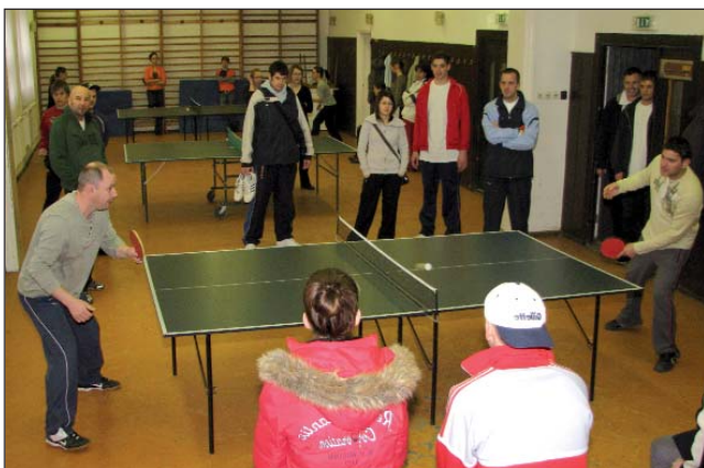
Meči su tekli na pet stoli, u subotu cijelo dopodne

To već od najavljenikov znamo da prethodni tajedan svaki dan su se masovno vježbali prijavljeniki na ovo naticanje. Bilo je mladih ki su se htili malo gibati, potrošiti jedno dopodne u dobrom društvu i atmosferi, bilo je i onakovih ki su jur rutinirani športaši, a bilo je i takovih ki su došli sad isprobati malo zahrđjavu šikanost. – Nije bilo tako teško skupa sabrati ljude. U zimi i onako nije čuda prilikov da se mobiliziramo. U domu i u školi smo imali stole, uvjeti su bili dani. Bilo je i velike volje još i čudio sam se i pravoda sam se veselio da se sve ovako nago-