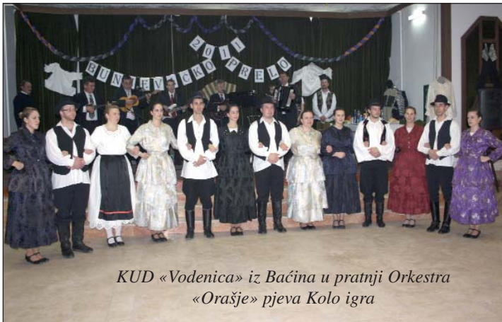
KUD «Vodenica» iz Bačina u pratnji Orkestra «Orašje» pjeva Kolo igra