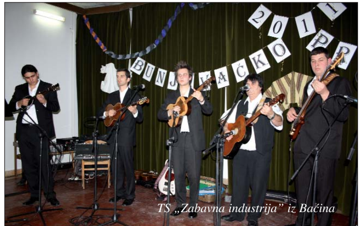
TS „Zabavna industrija” iz Bačina

Bunjevačkim prelom u Baškutu, u subotu, 8. siječnja, otvoren je niz preljških zabava u Bačkoj, koje će iz subote u subotu okupljati bačke Hrvate sve do 12. ožujka kada će se prirediti već tradicionalno Muško prelo u Gari.