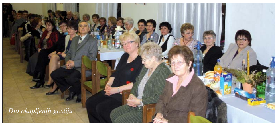
Dio okupljenih gostiju