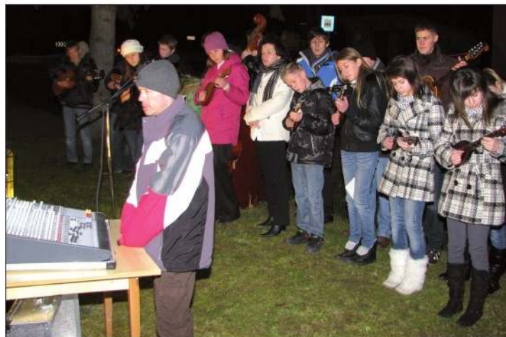
Tamburaši nisu bili u nenavidnoj situaciji jer je bilo jako hladno

Što more biti domaćinom na posebno veselje je to da i dica rado dojdú simo ne samo guslati na tambura i tako polipšati ovo adventsko druženje, nego i moliti i skupa jačiti sa starjimi ljudi. Ovo slavlje krasi ne samo tamburaška mužika, nego i štenje Evandjelja i jačenje mjesnoga pjevačkoga zbora ter i zahvalne riči gospodina. Sve je hladnije, polako začme i snig padati, još svi hrabro stoju na mjestu, dokle dura svetačnost. Nismo jalni ni tamburašem, kim se prsti zaigra-