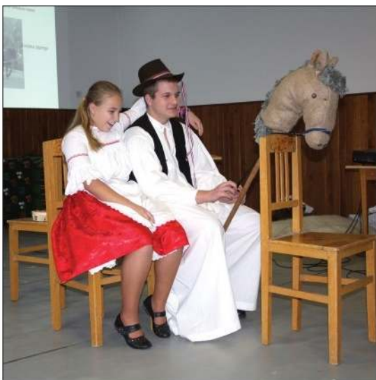
Moj zavičaj (običaji) – Obrazovni centar Nikole Zrinskog u Keresturu

BUDIMPEŠTA – 13. siječnja – Hrvatski bal u restoranu TreffOrt, s početkom u 19.30 sati, sudjeluje: Hrvatska izvorna plesna skupina, svira TS Siget.