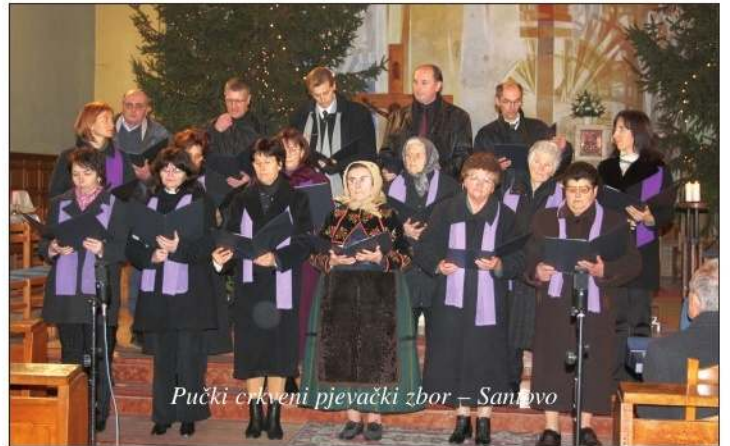
Pučki crkveni pjevački zbor – Santovo