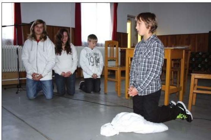
Božićni običaji – draškovečka osnovna škola