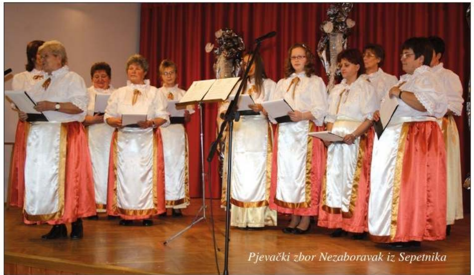
Pjevački zbor Nezaboravak iz Sepetnika

– Nas Hrvata u Sepetniku nije mnogo, no koji jesmo, vrlo se rado sastajemo, bilo kakvu priredbu organiziramo, svatko rado pomaže, a dobijem pomoć i od drugih manjinskih samouprava u regiji. Sretan sam što unatoč