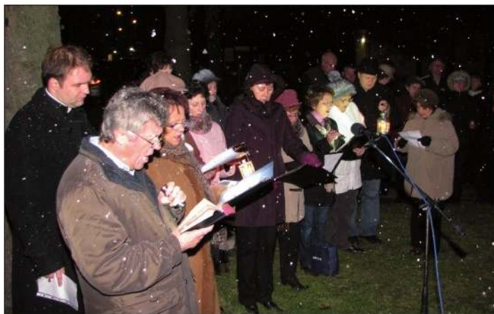
Na jačku je začeo i snig padati

Što more biti domaćinom na posebno veselje je to da i dica rado dojdú simo ne samo guslati na tambura i tako polipšati ovo adventsko druženje, nego i moliti i skupa jačiti sa starjimi ljudi. Ovo slavlje krasi ne samo tamburaška mužika, nego i štenje Evandjelja i jačenje mjesnoga pjevačkoga zbora ter i zahvalne riči gospodina. Sve je hladnije, polako začme i snig padati, još svi hrabro stoju na mjestu, dokle dura svetačnost. Nismo jalni ni tamburašem, kim se prsti zaigra-