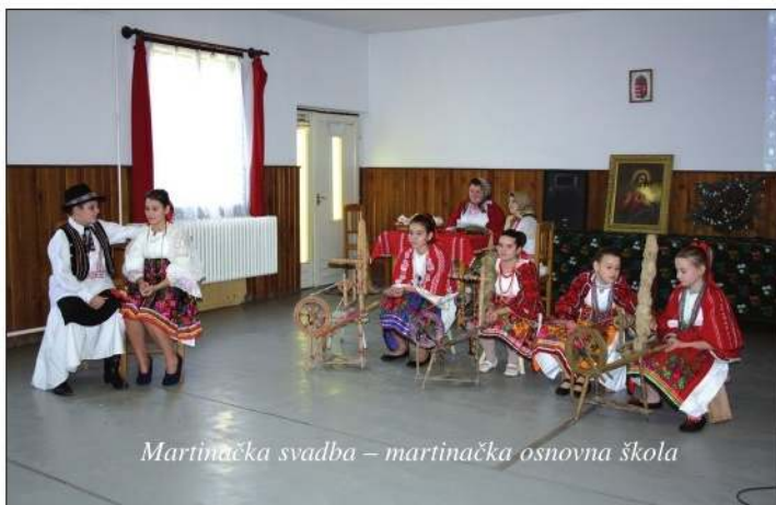
Martinačka svadba – martinačka osnovna škola

Natjecatelji su trebali istražiti i opisati običaje koji su se nje govali u prošlosti, a u nekim mjestima očuvali do danas, uz priložene priloge: fotomaterijale, crteže i drugo. Zadatak je bio da nakon prikupljanja, svrstavanja i obradbe građe oblikuju radne skupine za predstavljanje. Iz svake se škole moglo prijaviti najviše osam učenika uz dva pratitelja. Način izlaganja projektnih tema bio je slobodan, a usmeno izlaganje popraćeno informativnim panoima i računalnim prikazom odabrane teme. Dopušteno je i pripremanje sitnih suvenirâ koje su mogli podijeliti sudionicima. Svečanost je otvorena programom tamburaškog orkestra santovačke Hrvatske škole koji je izveo nekoliko šokačkih i bunjevačkih melodija.