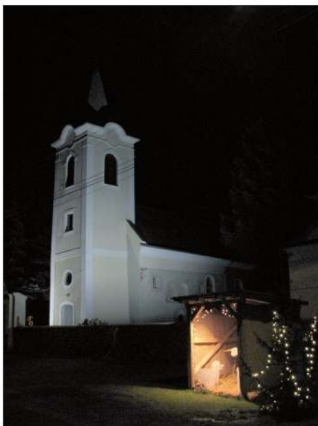
Betlehem u susjedstvu crikve