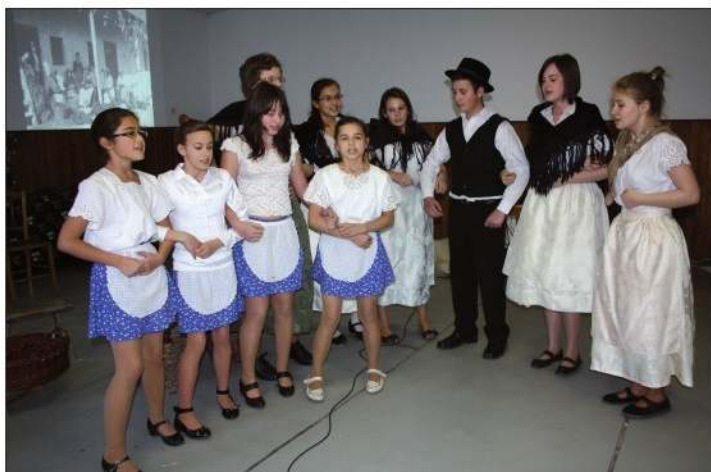
Natikanje paprike – baćinska osnovna škola

svojim radom pridonijeli i dobrom glasu sela. Nažalost, dodao je Hepp, nije takvo stanje u svim drugim sredinama, te istaknuo kako neki još uvijek ne shvaćaju da se samo usredotočenjem hrvatskoga školstva možemo održati, a naša djeca na pristojan način i visokoj razni školovati, što upravo pruža novoizgra-