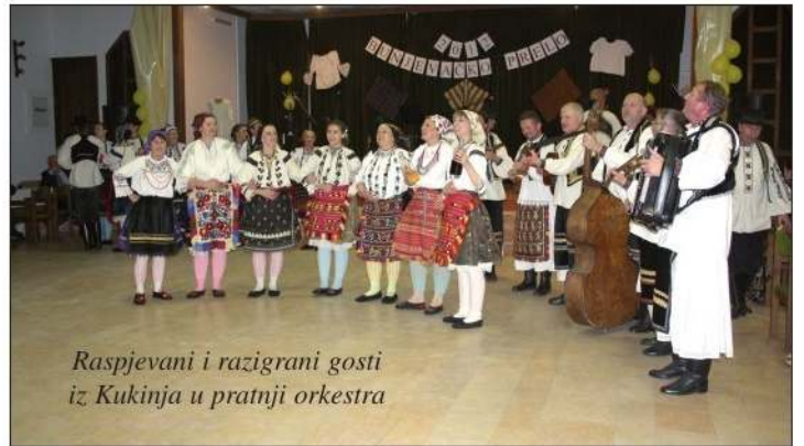
Raspjevani i razigrani gosti iz Kukinja u pratnji orkestra

ma, kao gosti na ovogodišnjem prelu, nastupili su članovi KUD-a Ladislava Matušeka iz Kukinja. Plesna skupina, pjevački zbor i orkestar predstavili su se s plesovima, pjesmama i glazbom bošnjačkih Hrvata iz okolice Pečuha. Vesele, razigrane i raspjevane goste publika je nagradila velikim pljeskom.