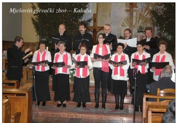
Mješoviti pjevački zbor – Kalača