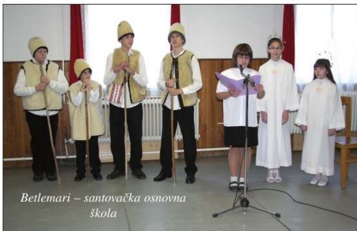
Betlemari – santovačka osnovna škola

U organizaciji Hrvatske državne samouprave, 8. prosinca u Santovu je priređeno već tradicionalno Natjecanje u izlaganju projektnih tema. Na zadanu temu „Moj zavičaj“, u mjesnom domu kulture prijavilo se šest družina iz šest naših škola u Mađarskoj, i jedna gostujuća iz Hrvatske, družina draškovečke osnovne škole, sveukupno šezdesetak sudionika, učenika, njihovih pratitelja i gostiju. Svojom nazočnošću priredbu je uveličala i Ljiljana Pancirov, generalna konzulica Republike Hrvatske u Pečku.