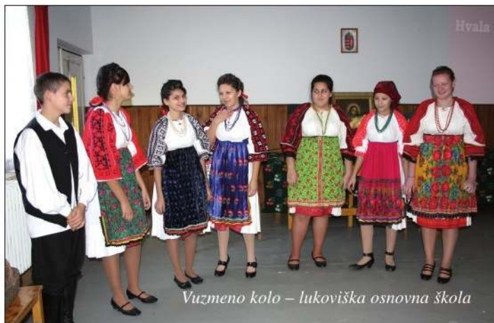
Vuzmeno kolo – lukoviška osnovna škola