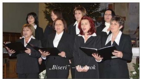
„Biseri” – Dušnok

Druženje je nastavljeno zajedničkom večerom u blagovaonici mjesne osnovne