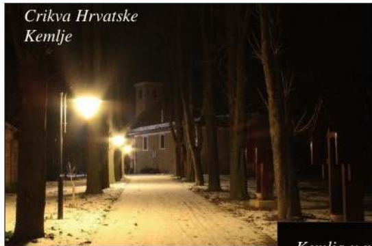
Crikva Hrvatske Kemlje

Jako lipo je bilo, kad su naši harmonikaši zaigrali božićne jačke. Svi ljudi su skupa jačili pod lipom. Člani samouprave su donesli čuda kolačev na sve-tak. Jako hladno je bilo, zato je nam dobro spalo kuhano vino i čaj. Zadnje nedilje adventa je bilo svečevanje sela va kulturnom domu. Onde je naša načelnica dala izveščaj o selu, ča se je stalo u starom ljetu u našoj Kemlji.