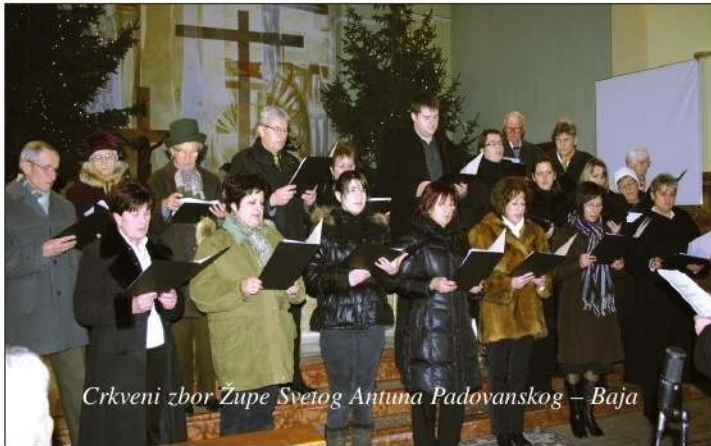
Crkveni zbor Župe Svetog Antuna Padovanskog – Baja