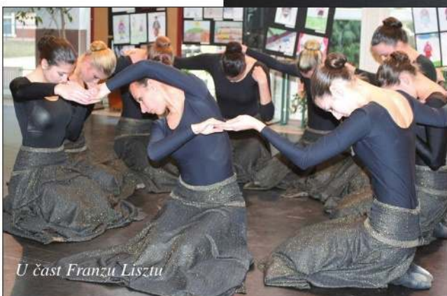
U čast Franzu Lisztu

Kovačević i Inez Kvarda Ljubavna (Parni valjak).