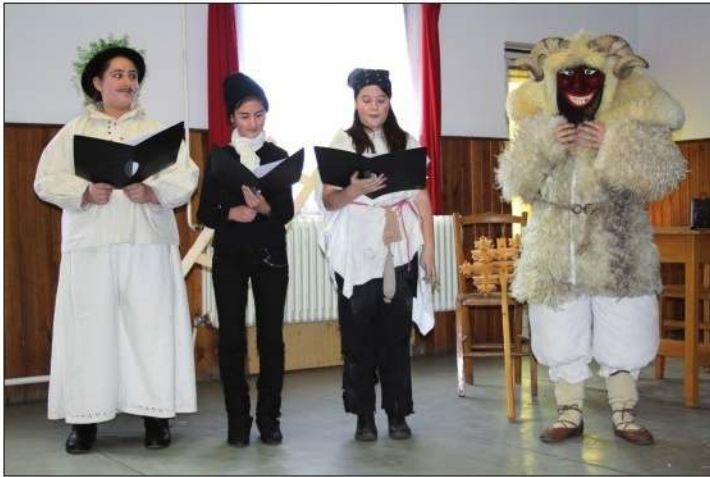
Pokladni običaji Hrvata u južnoj Mađarskoj – pečuška Hrvatska osnovna škola