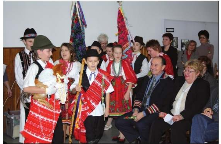
Martinačka svadba – martinačka osnovna škola

deni vrtić i dom u Santovu u održavanju Hrvatske državne samouprave.