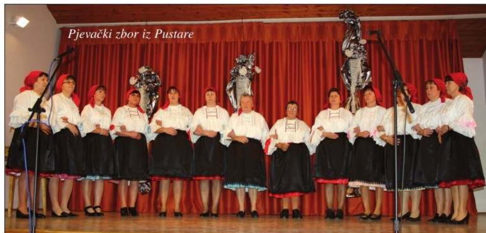
Pjevački zbor iz Pustare

PEČUH – U galeriji Hrvatskoga kluba Augusta Šenoae 18. siječnja, s početkom u 17 sati otvara se izložba radova sudionika Likovne kolonije „Terasa u Srimi” pod naslovom „Južna vrućina”. Izložbu će otvoriti Ljiljana Pancirov, generalna konzulica Republike Hrvatske u Pečuhu, a u programu otvaranja sudjelovat će glumac Slaven Vidaković. Izložba će biti dostupna javnosti do 10. veljače. Dvadeset izlagača lanjske, već tradicionalne Likovne kolonije, čiji je voditelj bio slikar Miklós Sándor, prikazat će svoje radove.