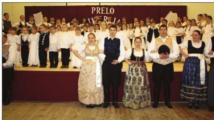
Članovi domaćeg KUD-a „Rokoko” (naprijed zdesna) i drugi sudionici zajedno su otpjevali Kolo igra, tamburica svira