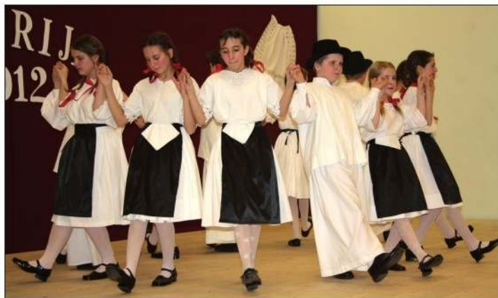
Dječja skupina KUD-a „Rokoko” iz Čikerije