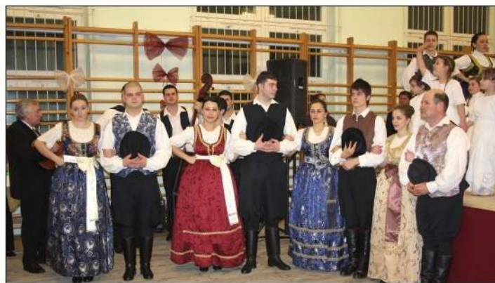
Dio članova domaćeg KUD-a „Rokoko”