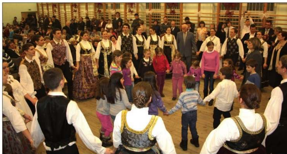
Zajedničko veliko kolo sudionika programa i gostiju Prela