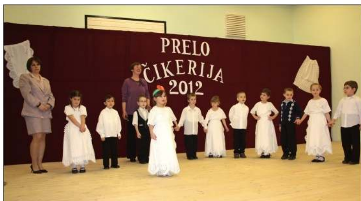
Članovi hrvatske skupine mjesnog vrtića

Dakle počeli smo nešto novo, a sigurno ćemo to proširiti na kulturni program, na binu, jer nismo htjeli odmah naveliko, s vremenom ćemo i to ostvariti. Naravno, i lani smo godinu počeli s Prelom, a bilo je i nekih manjih stvari. Ne možemo se tužiti ni na novčanu potporu (čikerijska Hrvatska samouprava lani je dobila 1 751 000 forinta potpore prema obavljenim javnim zadaćama, op. a.), jer smo lani dobili dosta lijepu svotu novca, što nas je malo i iznenadilo, a odgovornost je kako to korisno raspodijeliti, potrošiti. To ćemo nastaviti i ove godine. Što se tiče očuvanja i njegovanja tradicije, folklor, tu svakako KUD „Rokoko” ima važnu ulogu. Nakon obilježavanja 25. obljetnice, kako-tako, kao i kod svakog amaterskog društva, neki dodu, neki odu, s više naraštaja pokušavamo raditi, posebno s djecom. Zato pripre-