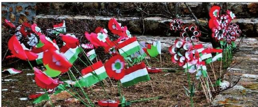
15. ožujka – Mađarski nacionalni praznik, spomen-dan Mađarske revolucije i borbe za nezavisnost od Bečkoga dvora 1848-49.