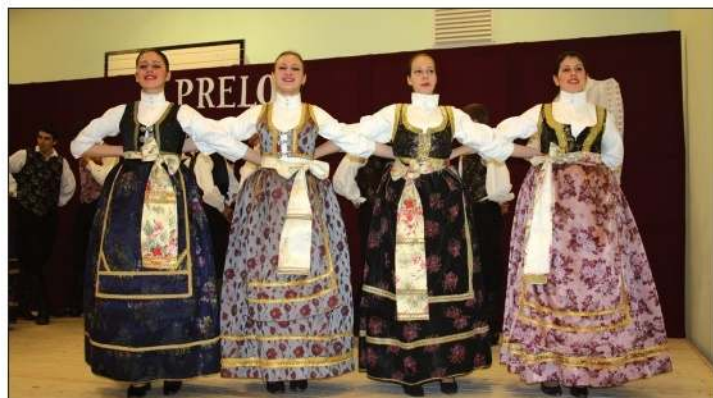
Članovi reprezentativne grupe HKC „Bunjevačko kolo” iz Subotice