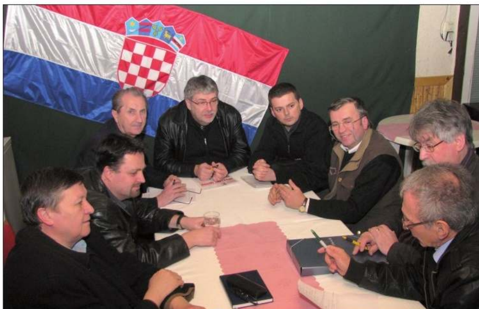
Zasjedalo je ujedno i predsjedništvo DGHU-a