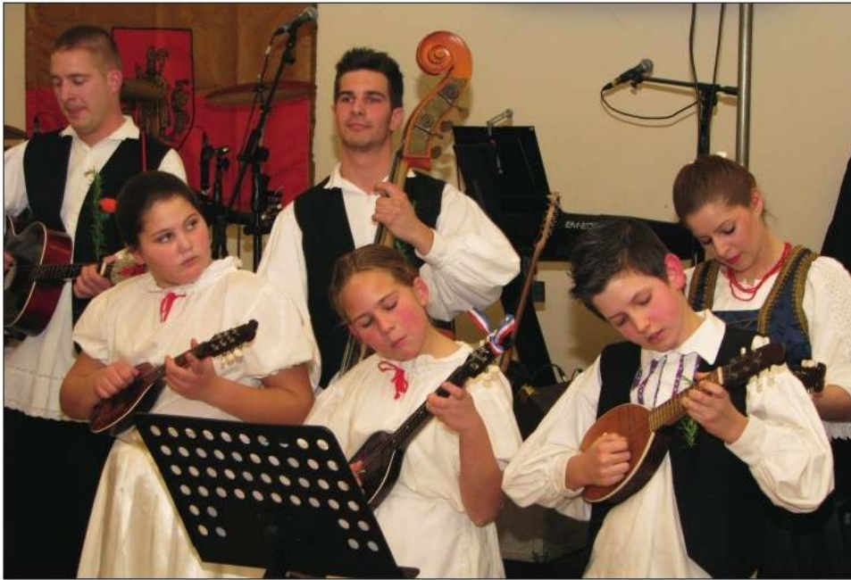
Dio četarskih tamburašev

zadnja točka njevoga kulturnoga programa je završena božanjem, fućkanjem i vikanjem publike. Prvi valcer je onda pak spojio četarske tančoše s dotadašnjimi gledateljima. Petrovski Pinka-band na prvom katu nije mirao nikomur, a noge su automatično sprohadjale ritam i pri stoli. U donjem kraju je petroviska Pinkica zakurila prvenstveno mladjoj generaciji, jer to se mora reći da sve više mladih vabi, hvala Bogu, ponovo ov bal. Prijatelji Četarcev, tamburaši, Sad ili nikad iz Hrvatske, mnogoputi su jur zabavljali naše Gradišćance prilikom posjeta u Sisku, tako je bilo samo od sebe razumljivo da će dostati svoj dio i na samboteljskoj fešti. Nismo se razočarali, dičaki nisu samo sa svojom odličnom svirkom ter pjevanjem, nego i izgledom osvajali simpatiju gostov. U polnoći pri izvličenju tombolov jedni gosti su postali još vese-