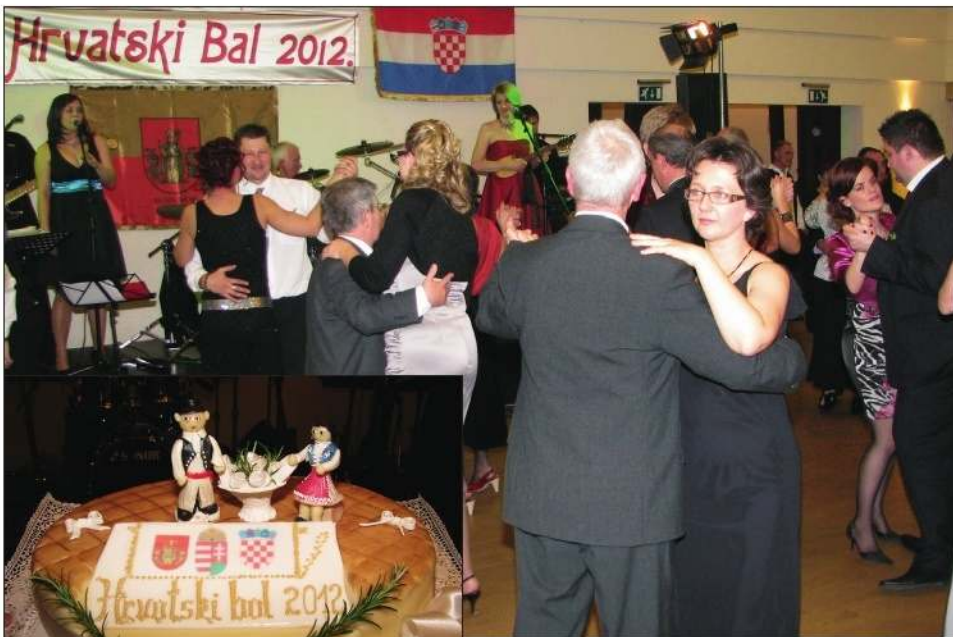
Torta iz četarske slastičarne Pataki je usričila dobitnika na tomboli