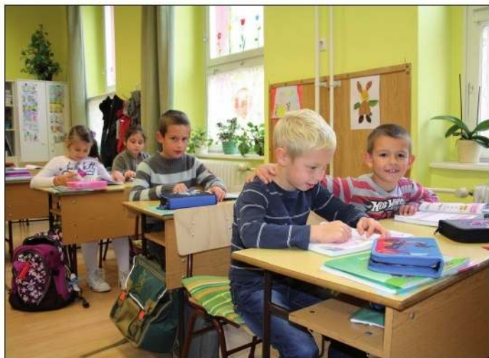
Učenici prvog razreda u svojoj učionici

svoje razrede, mora što više ponuditi svojim roditeljima. Tako su vjerojatno mislili i u katoličkoj školi da će ponuditi hrvatski jezik, jer i tamo ima roditelja koji su podrijetlom Hrvati, a bake i djedovi govore hrvatski, jer inače će upisati djecu u drugu školu.