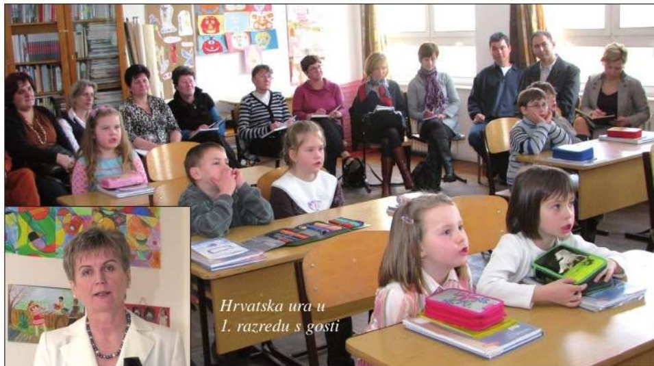
Hrvatska ura u 1. razredu s gosti