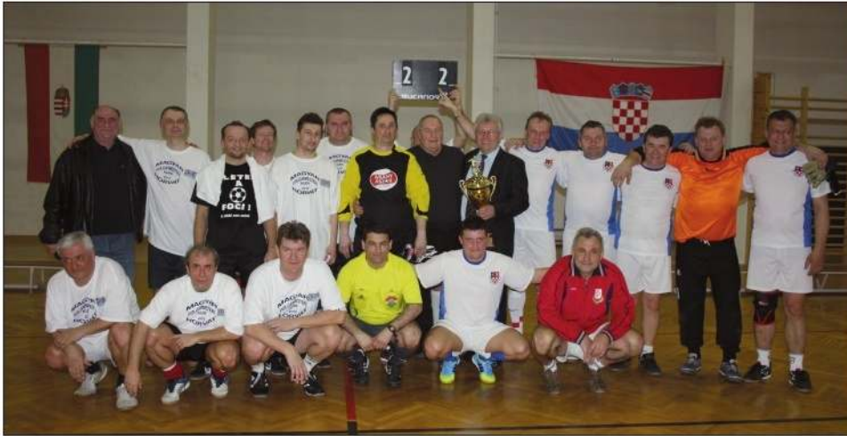
Nogometne momčadi iz Hrvatske i Mađarske

U organizaciji kapošvarske Hrvatske samouprave, 24. veljače u Somogyjadu priređena je međunarodna prijateljska nogometna utakmica između načelnika i čelnika prijateljskih naselja Šomodske županije te Koprivničko-križevačke i Bjelovarsko-bilogorske županije.