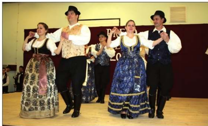
Članovi domaćeg KUD-a „Rokoko”