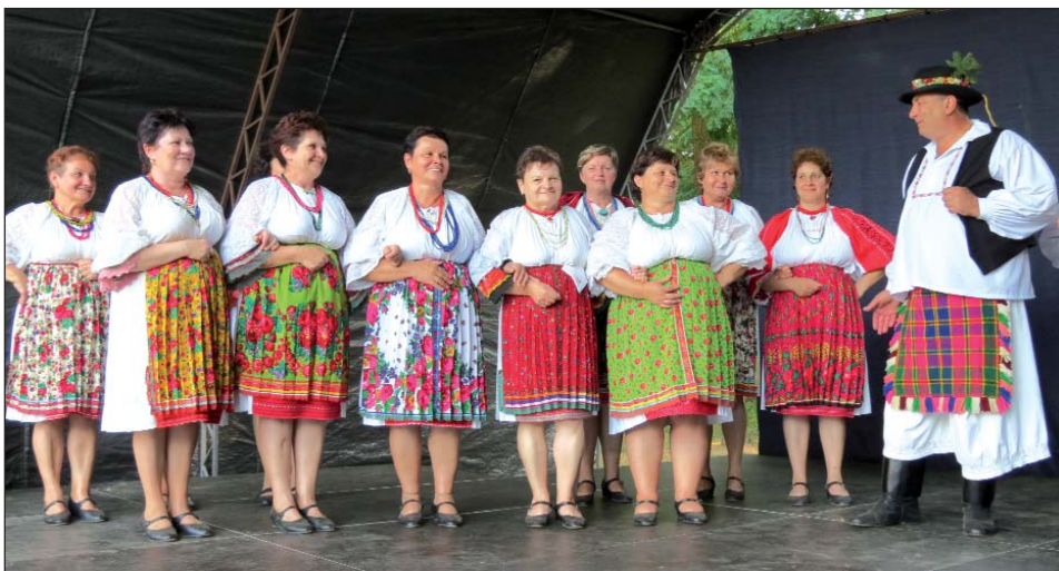
KUD Drava i Podravina s Orkestrom Vizin zajedno na pozornici

IZVAR – U travnju 2013. godine počela je provedba ekoturističkog projekta koji sufinancira Europska Unija u sklopu IPA prekograničnoga programa Mađarska–Hrvatska, a ukupna vrijednost projekta iznosi 1.021.266,70 eura. Područje provedbe projekta jesu četiri zaštićena područja: Park prirode Kopački rit, Park prirode Papuk i Regionalni park Mura–Drava u Hrvatskoj te Nacionalni park Dunav–Drava u Mađarskoj. Cilj je projekta osigurati model održivoga gospodarskog razvoja i upravljanja prirodnim zalihama duž regije Mura–Drava–Dunav uvođenjem novih ekoturističkih proizvoda i prekograničnom suradnjom. Nacionalni park Dunav–Drava iz Mađarske istraživačku postaju u Izvaru pretvoriti će u Ekoturističko središte u kojem će posjetitelje podučavati o zaštićenim prirodnim vrijednostima. Turistička infrastruktura prijamnoga središta u Sentešu će se unaprijediti, pa će se obnoviti podučavateljsko središte u Brlobašu.