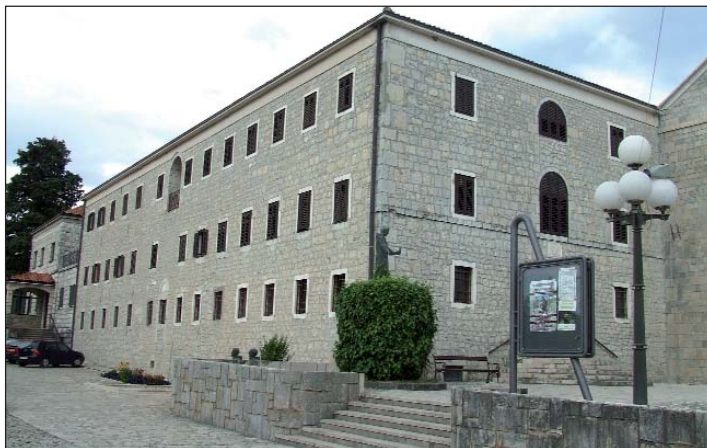
Franjevački samostan Svetog Ante Padovanskog na Humcu u Ljubuškom

U organizaciji Hrvatske samouprave grada Baje dvadeset i pet bajskih Hrvata-Bunjevaca od 10. do 13. kolovoza ove godine hodočastilo je Gospi Mira u Međugorje, gdje su nazočili misnomu slavlju, molili križni put na Križevcu i Brdu ukazanja. Kako nam uz