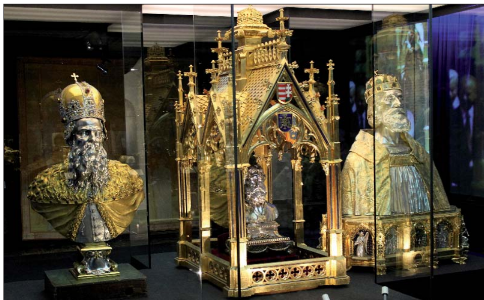
Povijesni trenutak zajednički izložene tri impresivne relikvije poprsja Sv. Stjepana