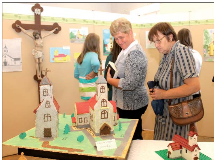
Već od dvadeset djel je izloženo s temom jubilarne kapele