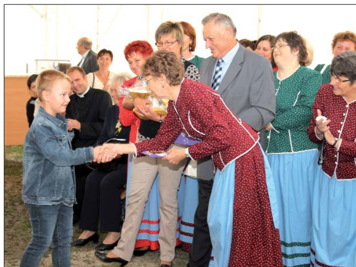
Svi „umjetniki” naticanja farske općine su nagradjeni