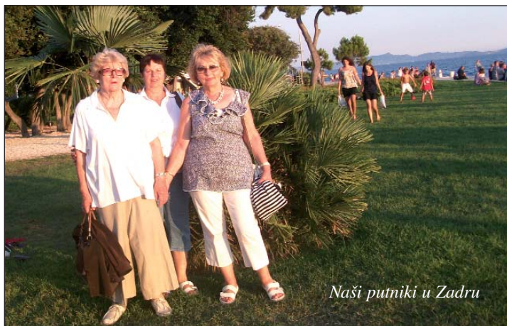
Naši putnici u Zadru