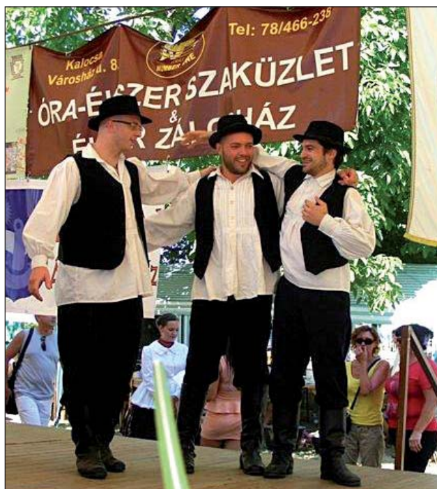
Članovi HKUD-a „Vodenica” redovito nastupaju na seoskim priredbama

no jelo pripalo je gostima iz Vojvodine. Tijekom dana organizirani su brojni kulturno-zabavni sadržaji za djecu, mlade i odrasle. Kao i svake godine, priredba je obogaćena i