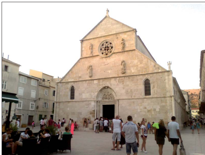
Na Glavnom trgu gradića Paga