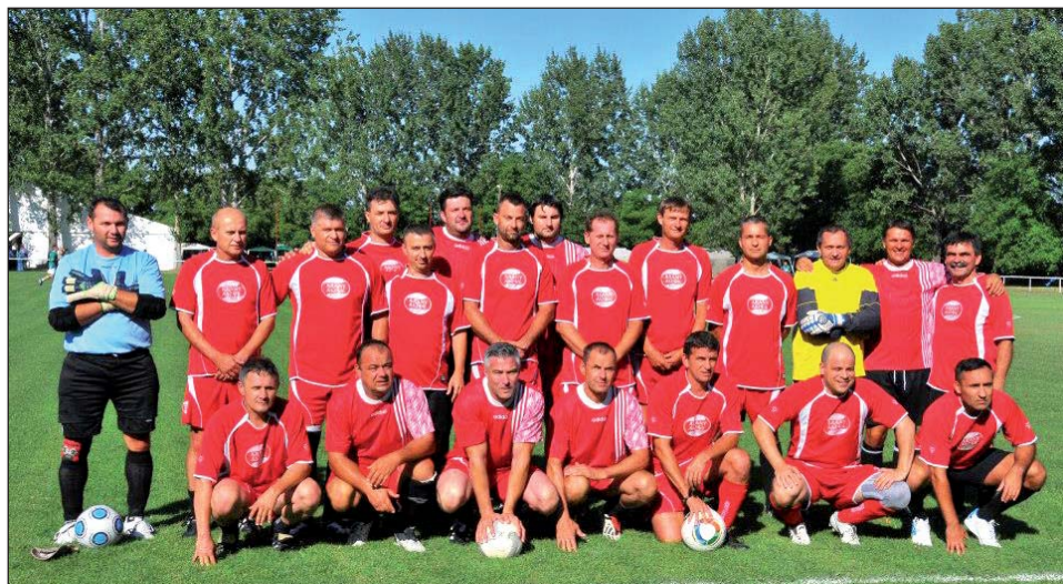
Nogometna reprezentacija Baćina i okolice