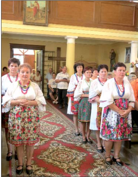
Na misi u izvarskoj crkvi