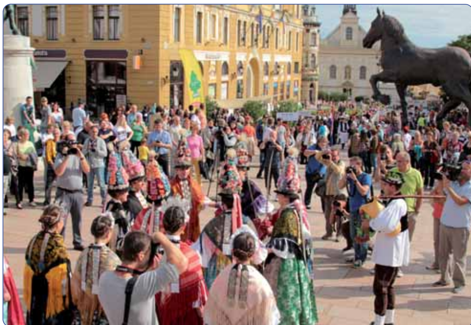
Mnoštvo okupljeno na glavnom pečuškom trgu

Draž, KUD Gorjanac iz Gorjana, HKUD Fra Petar Bakula iz Posušja, domaći KUD Tanac, HKPD Matija Gubec iz Tavankuta, KUD Varteks iz Varaždina i KUD Seljačka sloga iz Zadubravlja.