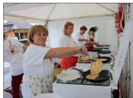
„Zlevanka, vino i tambure“