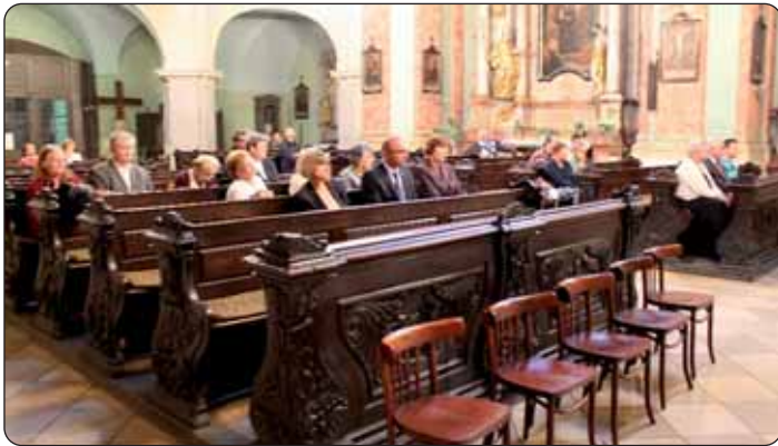
Budimpeštanski hrvatski vjernici na misi za pokoj duše hrvatskoga veleposlanika Aleksandra Šolca

U subotu, 6. rujna, u Zagrebu preminuo je prvi hrvatski veleposlanik u Mađarskoj, prof. dr. Aleksandar Šolc. Posljednji ispraćaj veleposlanika Šolca bio je u utorak, 9. rujna, na zagrebačkome Mirogoju.