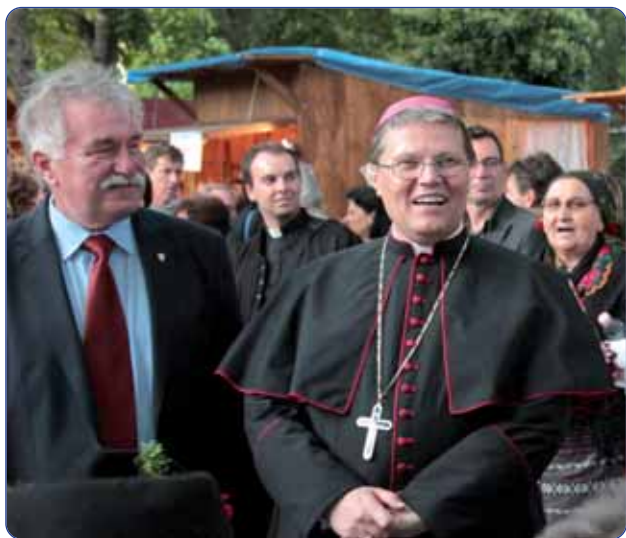
Đakovačko-osječki nadbiskup Đuro Hranić u društvu parlamentarnoga glasnogovornika Miše Heppa

Osamnaesti festival folklornih društava ove godine ujedno i godišnji Hrvatski dan u Pečuhu