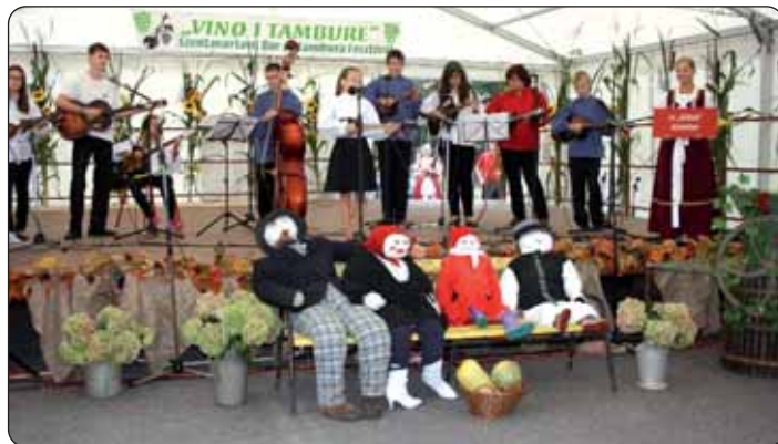
Najmlađi tamburaši bili su iz Kerestura