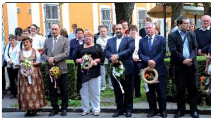
Brojni uglednici položili su vijence sjećanja kod spomen-ploče biskupu Ivanu Antunoviću.

Županijski hrvatski dan i spomendan biskupa Antunovića nastavljen je druženjem sudionika u dvorištu doma kulture, uz razgovor, tamburaše i pučku veselicu. Osim bačkih Hrvata, pri-