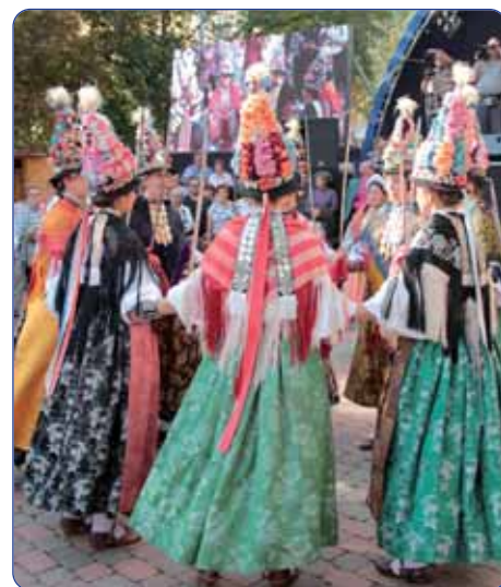
Ljelje (kraljice) iz Gorjana

Joso Ostrogonac, predsjednik Saveza Hrvata u Mađarskoj, a misu je pjevao pečuški Ženski pjevački zbor Augusta Šenoe. Lijepo vrijeme poslužilo je organizatore do večernjih sati kada je polako počela sipiti kišica. Upravo zbog meteorološke prognoze već je bilo predviđeno kako će se gala program održati u zatvorenom prostoru. Tako je i bilo. Napunila se jedna od dvorana Gimnazije Lajosa Nagya. U dvosatnom gala programu nastupili su svi sudionici festivala: KUD Matija Antun Reljković iz Davora, KUD Seljačka sloga iz