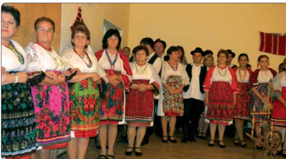
Brojni folkloriši napučili su novoselski dom kulture

FOK – Hrvatska samouprava 20. rujna priređuje tradicionalni Hrvatski dan. Program Dana započinje svetom misom u 16.30 misom na hrvatskom jeziku u fočkoj rimokatoličkoj crkvi, a nastavlja se kulturnim programom u mjesnom domu kulture. Nastupaju: martinački Pjevački zbor «Korjeni, KUD iz Birjana, Biseri Drave iz Starina, a navečer ples i zabava uz Orkestar Podravku. Dan se ostvaruje s potporom Zajednice podravskih Hrvata i državnog tajništva za vjerske, narodnosne i civilne društvene odnose Ministarstva ljudskih resursa.