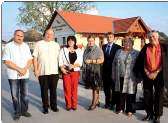
Među uzvanicima bila je i generalna konzulica Vesna Haluga