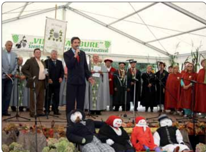
Svečano otvaranje Festivala