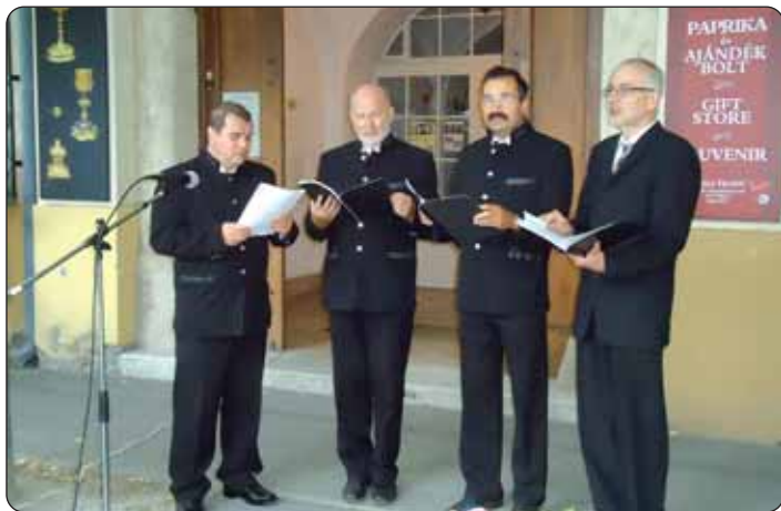
Muški pjevački zbor „Dobri prijatelji“

U organizaciji Hrvatske samouprave, 24. kolovoza u Kalači je priređen već tradicionalni Županijski hrvatski dan i Spomendan biskupa Ivana Antunovića. Preporoditelj bačkih Hrvata Ivan Antunović rođen je u Kunbaji 1815. godine, a umro u Kalači 1888. godine, gdje je i pokopan. Od 1842. bio je aljmaški župnik, a 1859. postaje kanonik, zatim i veliki prepošt, konačno 1876. i naslovni biskup bosonski. Svojim životom i djelom, napose svojim nabožnim, povijesno-etnografskim djelima, osobito pokretanjem Bunjevačkih i šokačkih novina , te svojom Razpravom o podunavskih i potisanskih Bunjevcih i Šokcih u pogledu narodnom, vjerskom, umnom, građanskom i gospodarskom , ali i školovanjem svojih sunarodnjaka i sljedbenika, ustrajno je radio na buđenju