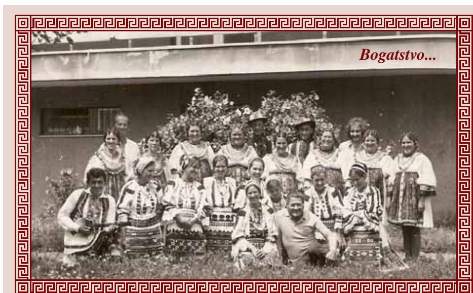
Folkloriši iz Ate i Starina 1972. godine na Smotri folkloru u Zagrebu