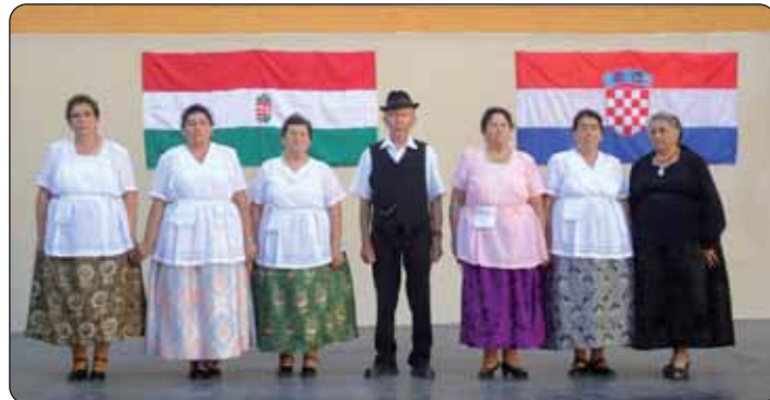
Dušnočki Ženski pjevački zbor „Pravi biser“