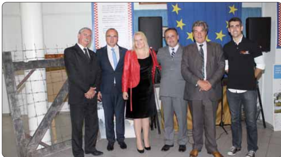
Časni gosti iz Hrvatske s domaćini

Hrvatska samouprava i Mladik (Mladi Koljnofci) skupa su pozvali na svečanu sjednicu 5. septembra, u petak, na uvodu otvaranja Dana mladine, u mjesni Kulturni dom, povodom 25. obljetnice pada Željeznoga zastora, 10. obljetnice priključenja Ugarske, a i zavolj prvoga ljeta nutrastupljenja naše pradomovine, Republike Hrvatske u Europsku uniju. Nadalje je zaslužila posebno svečevanje i ta činjenica da jedina mjesna Hrvatska samouprava u cijeloj državi je uprav koljnofska, ka s nevjerovatnom dvoljetnom borbom i složnošću je uspila pred kratkim hrvatsku školu u hrvatske ruke zeti.