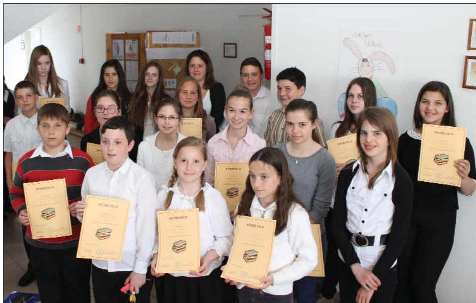
Najbolji školari Gradišća iz hrvatskoga jezika 2014. ljeta