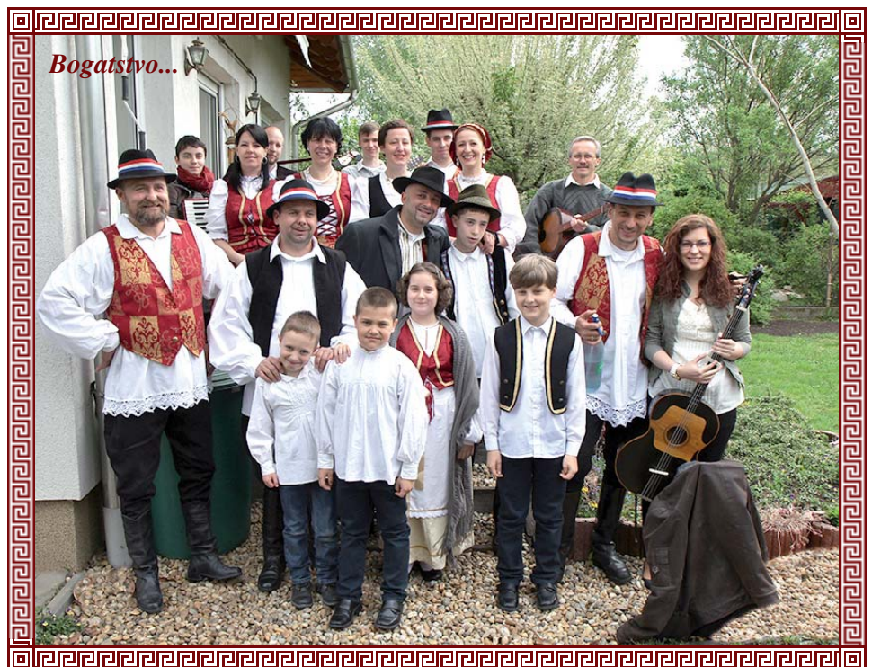
Uskrs i uskrsne običaje ljubomorno čuvaju erčinski Hrvati, posebice članovi KUD-a Zorica te Tamburaški sastav Márványos i Zbor Jorgovan