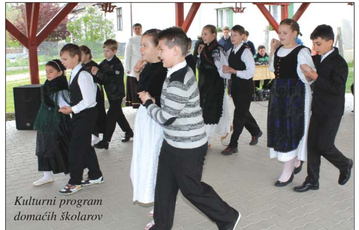
Kulturni program domaćih školarov

Horvat-Pauković je predstavila člane žirija, potom je najavila da prvi put u povijesti jezičnoga naticanja, odvojeno će se naticati školar i Dvojezičnih škol i škol s predmetnom nastavom hrvatskoga jezika. To je zlamenovalo da u jednu kategoriju su pripadala dica iz bizonjske, koljnofske i petroviske Dvojezične škole, a u drugu kemljanska i četarska škola. Sve skupa je 39 najavljenikov položilo «obračun» o svojem znanju po izvličenju temi (na što se je mogao svaki i pismeno pripremiti), dokle pri drugoj zadaći sami od sebe su mora-