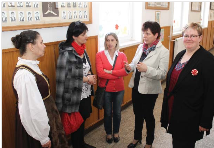
Gradišćanske pedagoginje u razgovoru

savjetnica za jezik, a ujedno i ravnateljica petroviske Dvojezične škole. Po nje riči popularnost ovoga jezičnoga naticanja nije pala, skoro sve škole su ishasnovale priliku da u svakoj kategoriji pokrenu tri najbolje učenike iz jezika, jedino iz petroviske