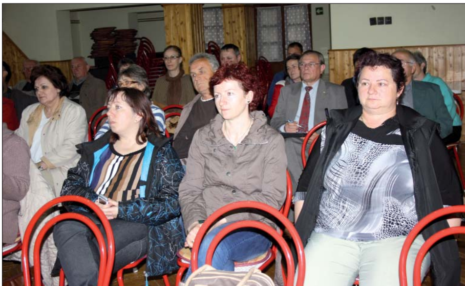
Dio članova Društva Horvata kre Mure

Godišnja skupština Društva Horvata kre Mure održana je 25. travnja 2014. u sumartonskom domu kulture. Iako je u pozivnici pokraj uobičajenih dnevnih točaka (izvješća) bio naznačen i izbor novog predsjednika i predsjedništva, te izmjena statuta, do toga nije došlo, naime članstvo je to odgodilo iza mjesnih izbora. Na skupštini je usvojeno izvješće o radu, financijsko izvješće za 2013., proračun i prijedlog programa za 2014. te je donesena odluka o načinu sudjelovanja na predstojećim mjesnim narodnosnim izborima.