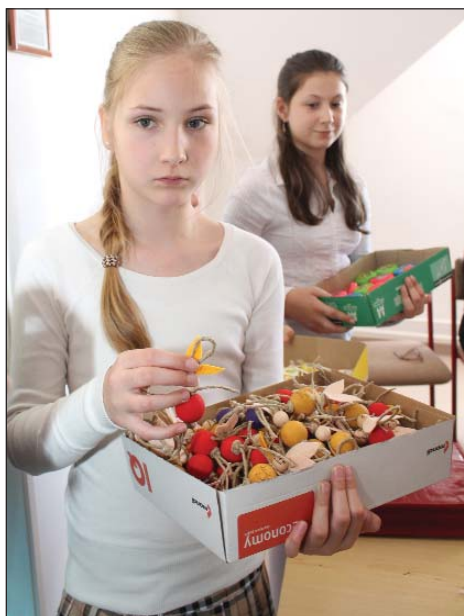
Kemljanska dica su napravila vazmene dare za goste

samouprava Kemlje, kot i Savez Hrvata u Mađarskoj – dodala je još Edita Horvat-Pauković. Oni naticatelji ki su svoju zadaću završili pred žirijem, mogli su projt i djelaonice ručne šikanosti, ali uprav tancati pod peljanjem mjesnih pedagogov. Iza objeda s pravim nestrpljenjem se je čekao vrhunac dana. Pri oglašavanju rezultata bila je nazoč-