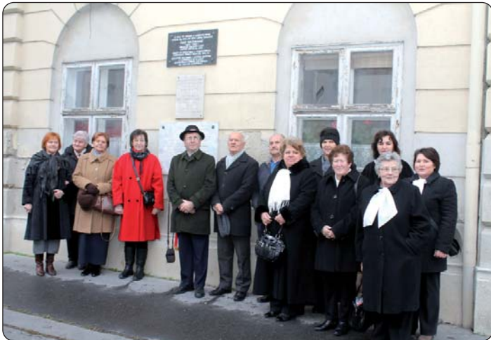
Pred Mažuranićevom spomen-pločom

U organizaciji Hrvatskoga kulturnoga i vjerskoga društva u Sambotelu, druge adventske nedilje šaka Hrvatov se je spomenula na hrvatskoga velikana Ivana Mažuranića, ki se je jedno ljeto školovao u našem varošu. Iako nikakovi dokumenti ne svidoču da bi tadašnji hrvatski školar bio uspostavio kontakte u Sambotelu i okolici s Hrvatima, nam Gradišćanskim Hrvatima sad je jur tradicija da svako ljeto jednoč hodočastimo do toga spomen-mjesta, do zgrade negdašnjega liceja.