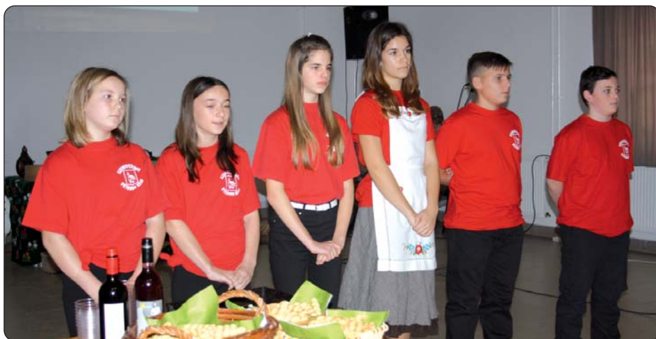
Učenici petrovošelske osnovne škole

Na kraju je HDS-ova dopredsjednica Angela Šokac Marković izrazila zadovoljstvo izloženim projektnim temama. Čestitala je sudionicima učenicima i njihovim nastavnicama na zalaganju. Jer, kako pri tome reče, svaka je škola na svoj poseban način prišla obradbi zadane teme, te priremila zanimljiva i zabavna izlaganja i tako pridonijela očuvanju bogate tradicijske i kulturne baštine hrvatskih krajeva u Mađarskoj. Uz usmene stručne pohvale, svim učeničkim drušinama, odnosno školama uručene su Spomenice za uspješno sudjelovanje, a zahvaljujući Generalnom konzulatu odnosno hrvatskoj tvrtki Podravka, i prigodni darovi.