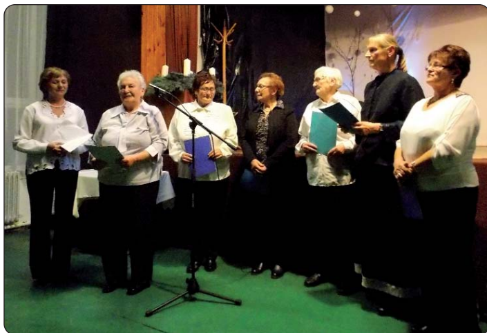
Najnoviji jačkarni zbor pri prvom nastupu