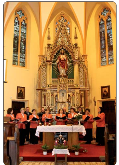
Zbor Slavuj iz Hrvatskih Šić

kotrigom različitih jačkarnih grup, ki se čuda zalažu za to da svojim jačenjem razveselu druge ljude. Mašno slavlje je polipšao domaći zbor „Sv. Cecilija“, a za koncertom su svi bili pozvani u Kisfaludy-