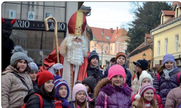
Djeca s Djedicom na glavnome trgu

Zahvaljujući suradnji pomurskih Hrvata s Varaždinskom biskupijom i s rektorom varaždinske katedrale mons. Blažem Horvatom, pomurski su Hrvati u organizaciji Hrvatskoga kulturno-prosvjetnog zavoda „Stipan Blažetin“ druge nedjelje došašća otputovali u Zagreb i sudjelovali na hrvatskomu misnom slavlju u zagrebačkoj katedrali.