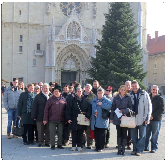
Šeljinačani pred zagrebačkom katedralom

U organizaciji Hrvatske samouprave grada Šeljina, u nedjelju, 13. prosinca, u jutarnjim satima krenulo je društvo na posjet Zagrebu. Izlet nije bio samo za Hrvate, organizatori su svakoga čekali tko je bio znatiželjan za upoznavanje glavnoga grada Hrvatske. Taj je program ove godine bio prvi put priređen, ali možemo reći da je bio vrlo uspješan.