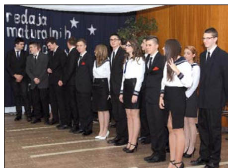
„Krlleža“, predaja vrpci