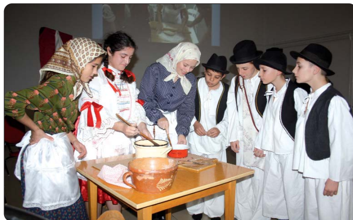
Učenici serdahelske osnovne škole