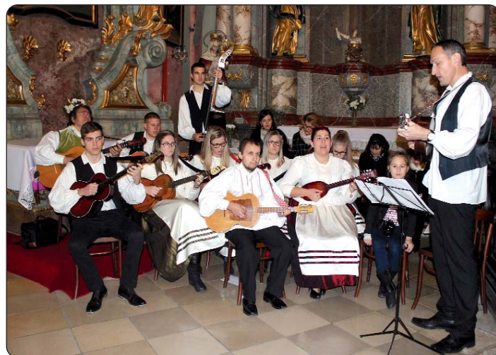
Koljnofski tamburaši i Pjevački zbor Golubice

netko vodi u životu.“ Misu na hrvatskome jeziku glazbom i hrvatskim božićnim napjevima uveličali su koljnofski tamburaši i Ženski pjevački zbor Golubice. Koljnofski su gosti u mađarskoj prijestolnici boravili na poziv Hrvatske samouprave grada Budimpešte.