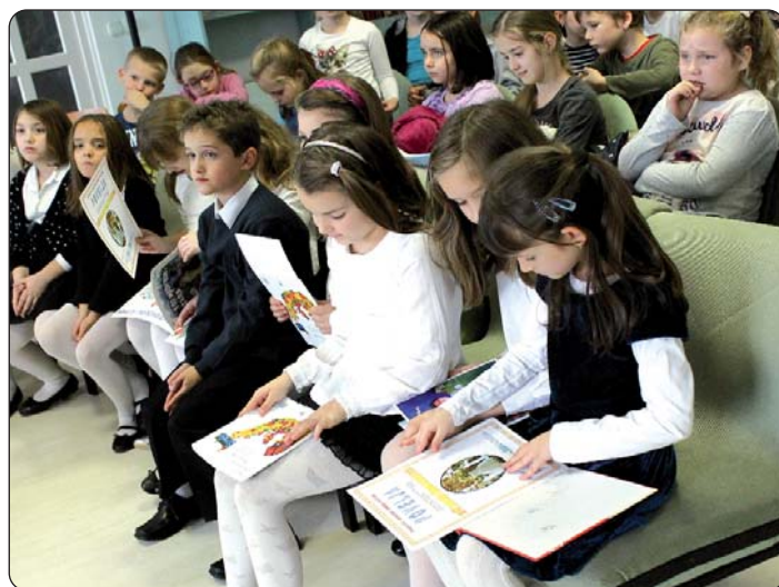
Knjiga je najljepši dar.