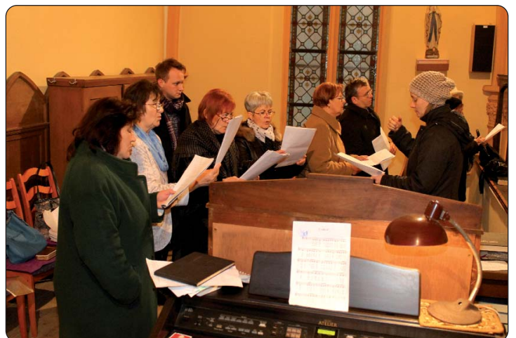
Domaći zbor Sv. Cecilija