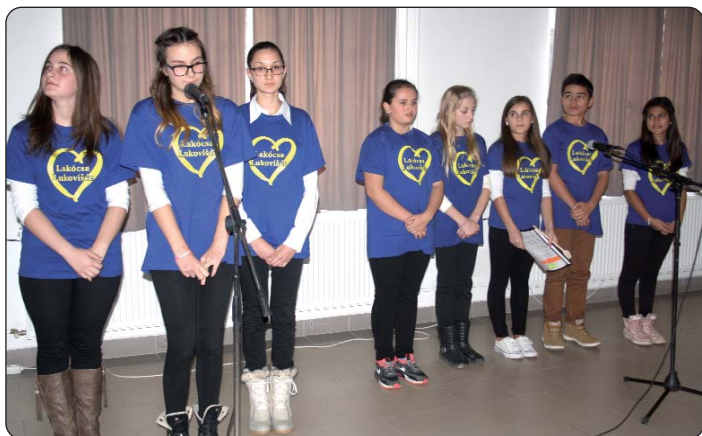
Učenici lukoviške osnovne škole

U organizaciji Hrvatske državne samouprave odnosno njezina Odbora za odgoj i obrazovanje, a u okviru niza programa Croatiade 2015, 25. studenog u Santovu je sedmu godinu zaredom priređeno „Predstavljanje u izlaganju projektnih tema“, koje je ostvareno s potporom Fonda za razvoj ljudskih potencijala Ministarstva ljudskih resursa.