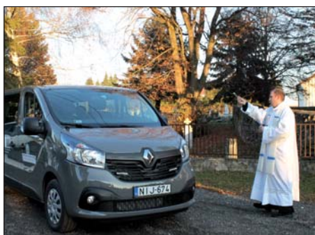
Blagoslavljanje seoskoga busa