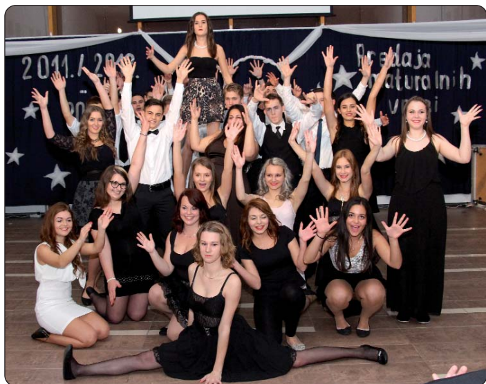
Učenici 11. razreda Hrvatske gimnazije Miroslava Krleže