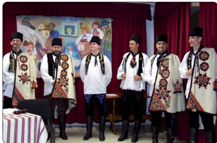
Pjevački zbor «Ižipci»