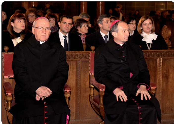
Biskupi Antun Škvorčević i György Udvardy

U organizaciji Hrvatskoga kluba Augusta Šenoe i Hrvatske kulturne udruge Augusta Šenoe, u pečuškoj bazilici u sklopu programa Pečuškog adventa, koji već godinama organizira Pečuška biskupija, priređen je već uobičajeni Hrvatski adventski koncert. Ali ne samo koncert nego i sveta misa na hrvatskom jeziku koja je slijedila koncertu, kao i svake godine već više od jednog i pol desetljeća.