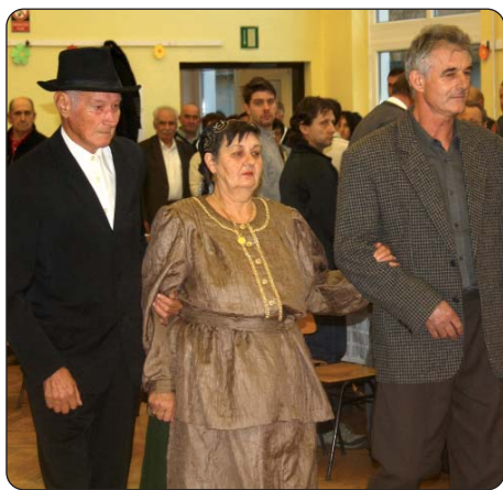
Domaćini proslave: Priredba je počela zajedničkim

Nakon mise, već po običaju, domaćini i organizatori goste su na ulazu mjesnog doma kulture dočekali zameđenom rakijom, medom, orasima, bijelim lukom i jabukama. Na poziv organizatora da zajedno proslave prastari običaj bunjevačkih Hrvata, blagdan bunjevačkih majka i očeva, u mjesnom domu kulture poput jedne velike obitelji okupilo se stotinjak bunjevačkih Hrvata, gostiju i uzvanika. Došli su i oni koji danas ne žive u Gari, ali se redovito vraćaju u svoje rodno selo.