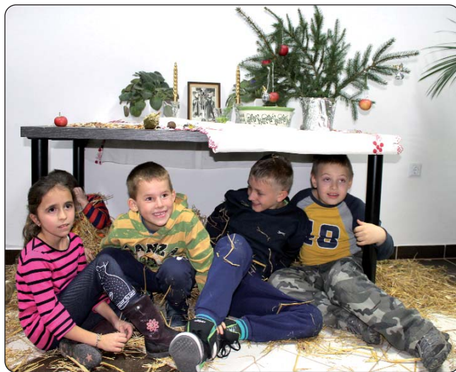
Djeca su se rado koturala po slami.