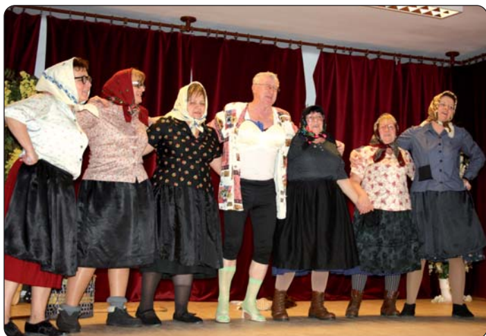
Igrokaz Kulturnog društva „Mura“

Serdahelska mjesna samouprava već godinama prisjeti se svojih umirovljenika i posveti im posebnu pozornost organiziranjem Dana umirovljenika. Tako je bilo i 24. siječnja kada su se bake i djedovi okupili u domu kulture na druženje, na kulturni program, izvrsnu večeru i zabavu. Načelnik Stjepan Tišler pozdravio je okupljene mještane treće dobi i zahvalio im na radu koji su učinili tijekom svoga života za uzdizanje sela Serdahela.