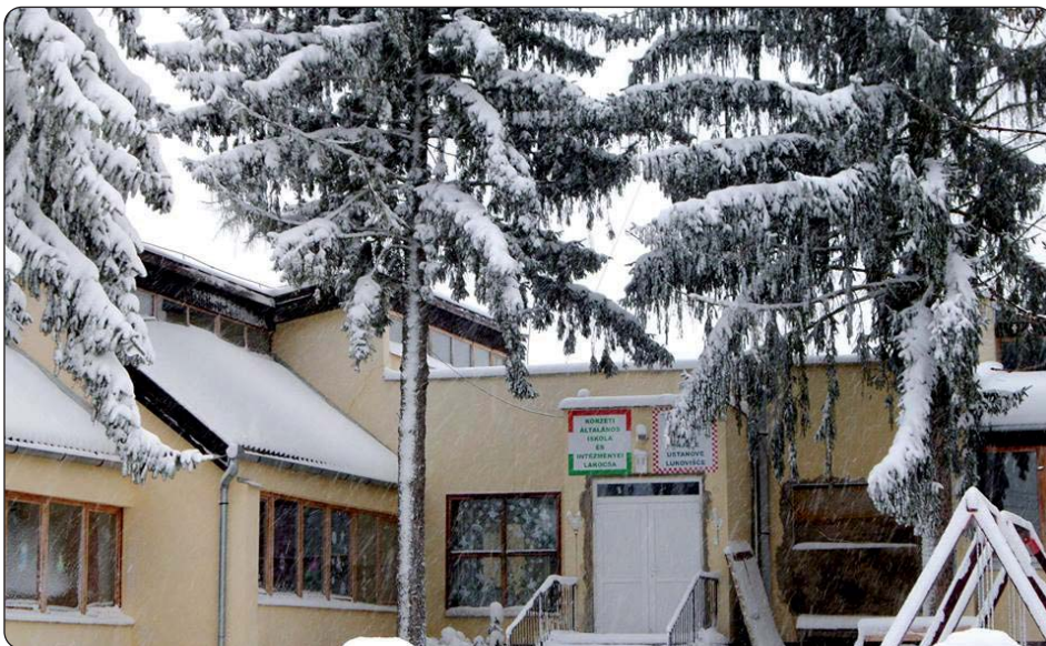
Ulaz u mjesnu školu