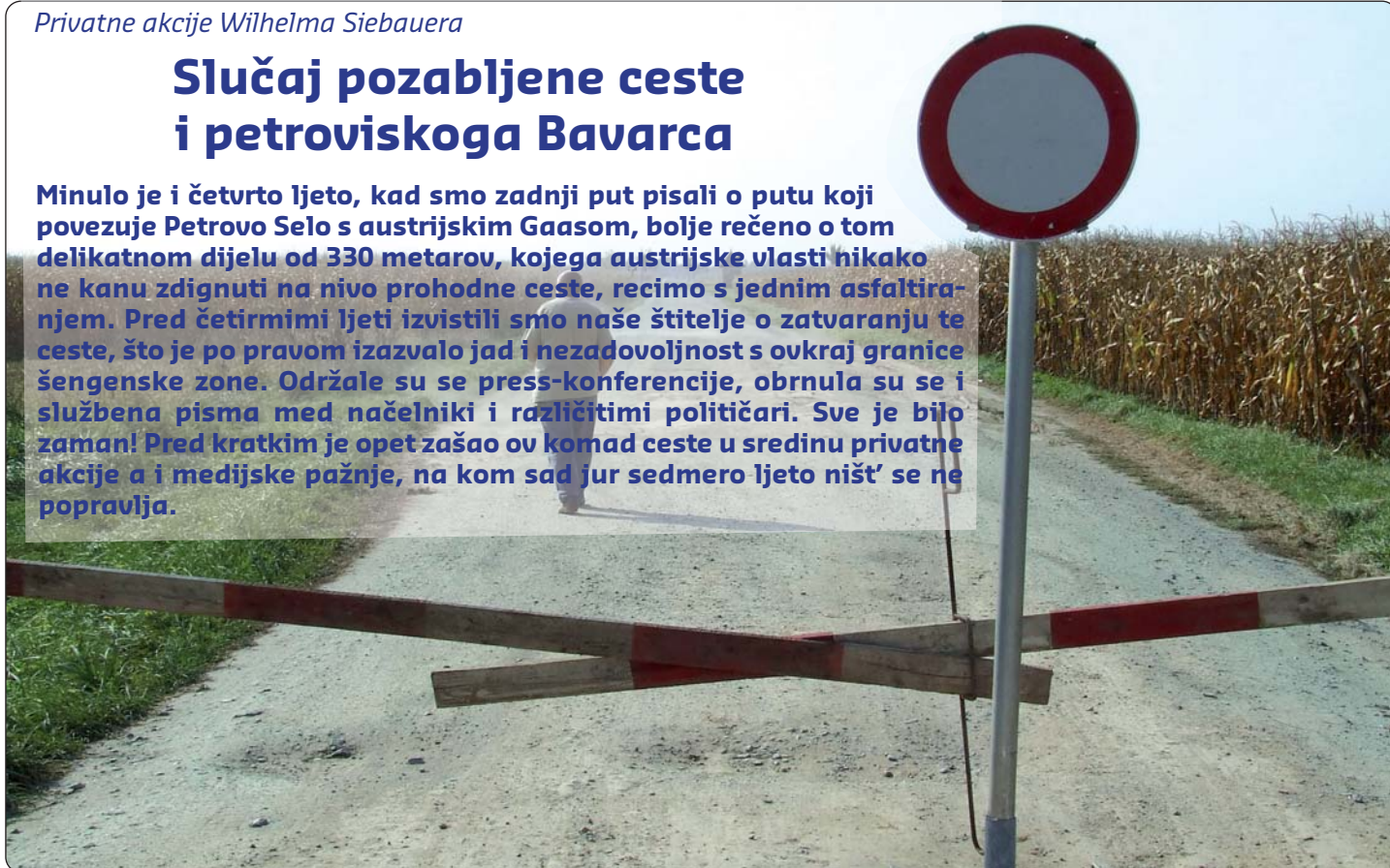
Slika iz 2011. ljeta: Kordoni su nestali, ali cesta je i dalje neprohodna

Minulo je i četvrto ljeto, kad smo zadnji put pisali o putu koji povezuje Petrovo Selo s austrijskim Gaasom, bolje rečeno o tom delikatnom dijelu od 330 metarova, kojega austrijske vlasti nikako ne kanu zdignuti na nivo prohodne ceste, recimo s jednim asfaltiranjem. Pred četirmimi ljeti izvistili smo naše štitelje o zatvaranju te ceste, što je po pravom izazvalo jad i nezadovoljnost s okraj granice šengenske zone. Održale su se press-konferencije, obrnula su se i službena pisma med načelniki i različitim političari. Sve je bilo zamaš! Pred kratkim je opet zašao ov komad ceste u sredinu privatne akcije a i medijske pažnje, na kom sad jur sedmero ljeto ništ' se ne popravlja.