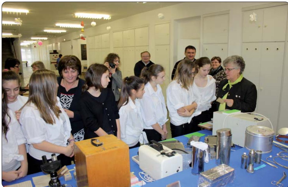
Učenici promatraju izložbu medicinskih pribora.