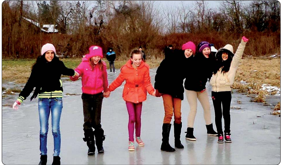
Djeca se vole klizati.