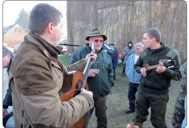
Tamburaši su goste zabavljali cijeloga dana.

Udruga „Za Daranj“, udruga za javno obrazovanje i uljepšavanje sela, te Hrvatska samouprava sela Daranja i ove je godine organizirala, sada već petu „Podravsku svinjokolju“, 14. veljače 2015. u Daranju. Mjesto priredbe i ove je godine bio otvoreni prostor dvorišta tamošnje osnovne škole, mlinsko dvorište. Priredba se ostvarila s potporom Ureda za poljoprivredu i regionalni razvoj, Udruge Rinja – Drava, Programa Leader, programa Szingergia, a podupiratelji su programa bili tamošnja Seoska i Hrvatska samouprava, Drava Coop i brojne mjesne civilne udruge. Iza organizacije stoji Neprofitna udruga za uljepšavanje i javnu prosvjetu naselja Daranja.