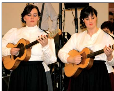
38. Županijski bal