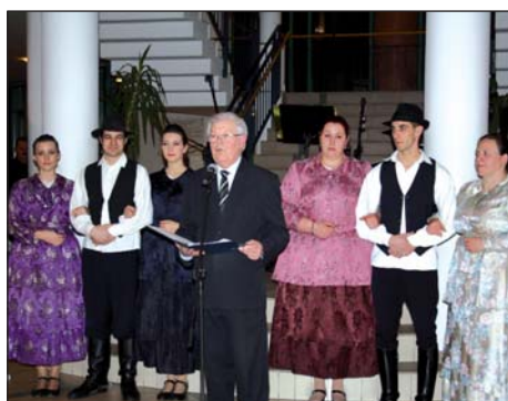
Lakomac u Kalači