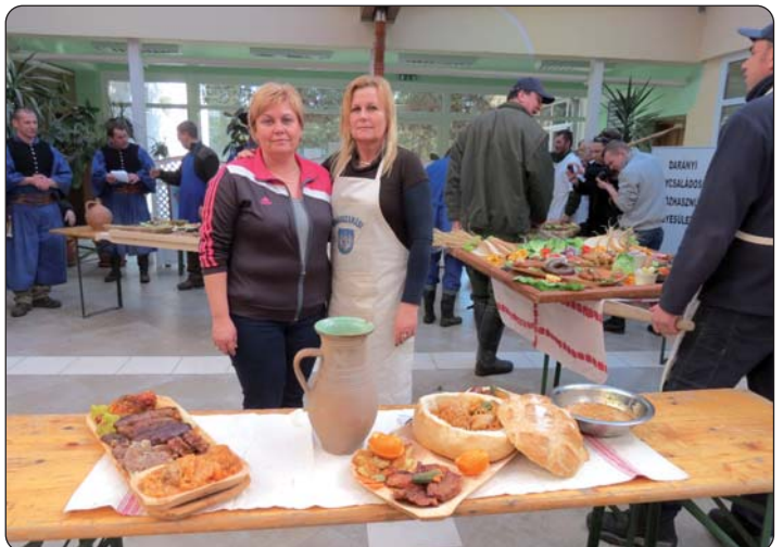
Tradicionalna „kolinjska“ jela podravskih Hrvata