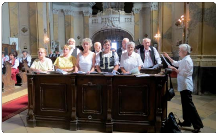
Crkveni pjevački zbor tukuljskih Hrvata u erćinskoj crkvi na Veliku Gospu 2014. godine

Organizatori – uzimajući u obzir i želje te zahtjeve mladih naraštaja za novijim valovima tzv. narodnjaka – pobrinuli su se kako bi priredba zadržala svoju vjerodostojnost, jer i nadalje smatraju izričito važnim učenje i njegovanje narodnosnoga jezika te očuvanje ono višedesetljetno bogatstvo koje su naraštaji neprekidno nasljeđivali, a također i očuvanje izvornosti narodnoga plesa i pjesama. Za tu zahvalnu zadaću pruža pomoć Gradska samouprava, mjesna Hrvatska samouprava, Tukuljski narodni plesni ansambl i čuveni Muški zbor, koji djeluju već četrdeset i osam