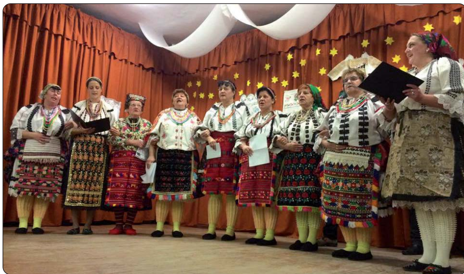
U Kozaru je nastupio Ženski pjevački zbor Augusta Šenoae.