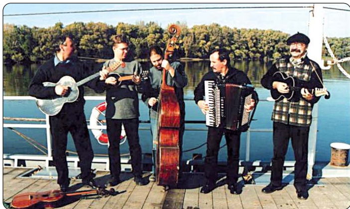
Tukuljski sastav „Kolo“

U prostorijama tukuljske knjižnice i doma kulture 31. siječnja priređen je 37. tradicionalni Racki bal, najposjećenija priredba pokladnoga razdoblja.