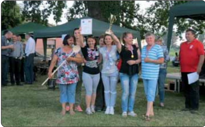
Kod natjecanja u kuhanju graha najuspješnija je bila družina lukoviškoga dječjeg vrtića.

Podravsko naselje Potonja u petak, 10. lipnja, s velikim je srcem očekivalo goste na svoju redovitu priredbu pod nazivom Hrvatski ljetni festival – noćni nogomet. Za dobru glazbu i odlično raspoloženje pobrinuli su se zastupnici tamošnje Hrvatske samouprave, na čelu s Jozom Dudašem, a budući da je odnos između Seoske i Hrvatske samouprave jako dobar i Seoska je samouprava pomagala u organiziranju. Za izvrsni gulaš i uzbudljive utakmice, kao obično, pobrinuli su se gosti iz Gornjeg Bazja (prijateljsko naselje sela Potonje), Rušana, Barče, Bojeva, Daranja, Dombola, Izvara, Lukovišća, Martinaca, Novoga Sela, Tomašina, Starina i drugih.