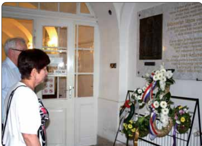
Spomen-vijenci kod spomen-ploče