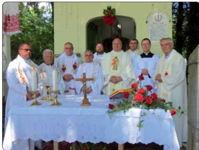
Brojni svećenici u Drvljancima

Misa je bila prikazana uz koncelebraciju brojnih svećenika, koji su čitali Sveto pismo na mađarskom i na hrvatskom jeziku. Ovom se prigodom uvijek okupljaju i oni koji su davno otišli iz ovoga kraja zbog raznih razloga, ali svatko se rado vraća u svoj rodni kraj. Vjernici su ispričavali kako je bilo nekada kada su bili djeca i mladi, ne samo na taj dan nego i više puta godišnje dolazili su u Drvljance. U ono vrijeme mnogi su dolazili iz okolnih naselja na blagdan Presvetoga Srca Isusova, tko pješice tko biciklom ili motorom, naravno, tko ga je imao. To je bilo prvo pravo podravsko proštenje. I tako se iz godine u godinu počelo hodočastiti u Drvljance, ove godine 3. lipnja na X. hrvatsko državno hodočašće, opet u Podravini, opet u Drvljancima. Nakon misnoga slavlja svakoga je čekalo druženje, hrvatska glazba i objed.