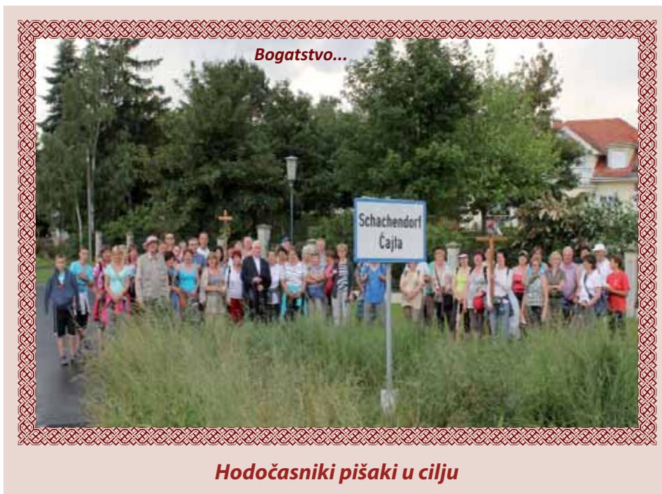
Hodočasnici pišaki u cilju