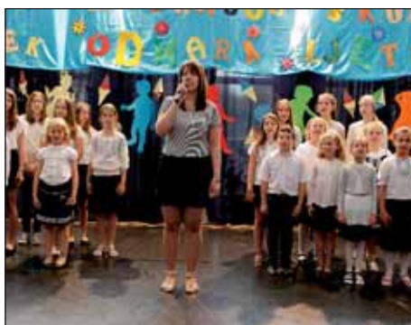
Kraj školske godine