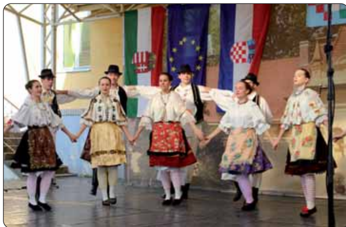
Pečuški KUD Baranja

KUD Baranja utemeljen je davne 1967. godine i od tada do