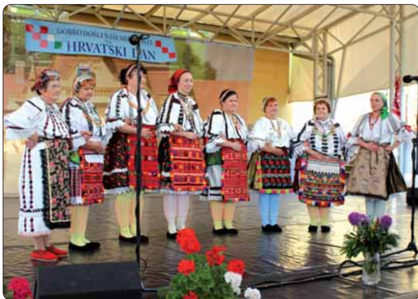
Ženski pjevački zbor Augusta Šenoe

U organizaciji tamošnje Hrvatske samouprave, u tom je gradu 28. svibnja priređen Hrvatski dan. Program Dana odvijao se na otvorenoj pozornici Središta za kulturu, čemu je prethodila sveta misa na hrvatskom jeziku u rimokatoličkoj crkvi, koju je predvodio martinački župnik Ilija Čuzdi uz orguljašku pratnju martinačke orguljašice i kantorice Anice Gujaš. U folklornome programu nastupio je pečuški KUD Baranja, Ženski pjevački zbor Augusta Šenoe i našički HKD „Lisinski“. Nakon programa slijedilo je druženje i zabava.