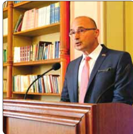
Hrvatski veleposlanik u Budimpešti Gordan Grlić Radman pozdravlja nazočne.

dijele jednaku vanjsku politiku. Složio se kako povijesne veze sežu daleko u prošlost, o čemu najbolje svjedoči i ovogodišnje zajedničko obilježavanje memorijalne godine Nikole Zrinskog, ili Miklósa Zrínyija, kako se isti junak naziva kod Mađara, koji ga također prihvaćaju kao dijela zajedničke prošlosti. Ministar je istaknuo da su i u današnjem vremenu obje države suočene sa sličnim izazovima i vanjskim prijetnjama, ponajprije migrantskom krizom. Premda su jezici različiti, oba naroda dijele iste kršćanske vrijednosti na kojima je utemeljena i sama Europa, kazao je Simicskó ističući važnost širenja suradnje u budućnosti pri ostvarenju zajedničkih ciljeva.