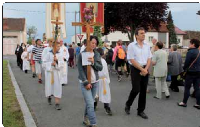
U prošeciji je bilo kih 250 ljudi

medjusobnom spravišću i lipom sastanku u miru i razumivanju s Blaženom Divicom Marijom. Ujedno je prosio blagoslov na naše djelo, na naše svakidanje posle, na dicu i crikvu, na siromahe i bolesnike ter se je obrnuo svim vjernikom da jedan drugomu budemo na pomoć i da ne budemo križ jedan drugomu, nego da