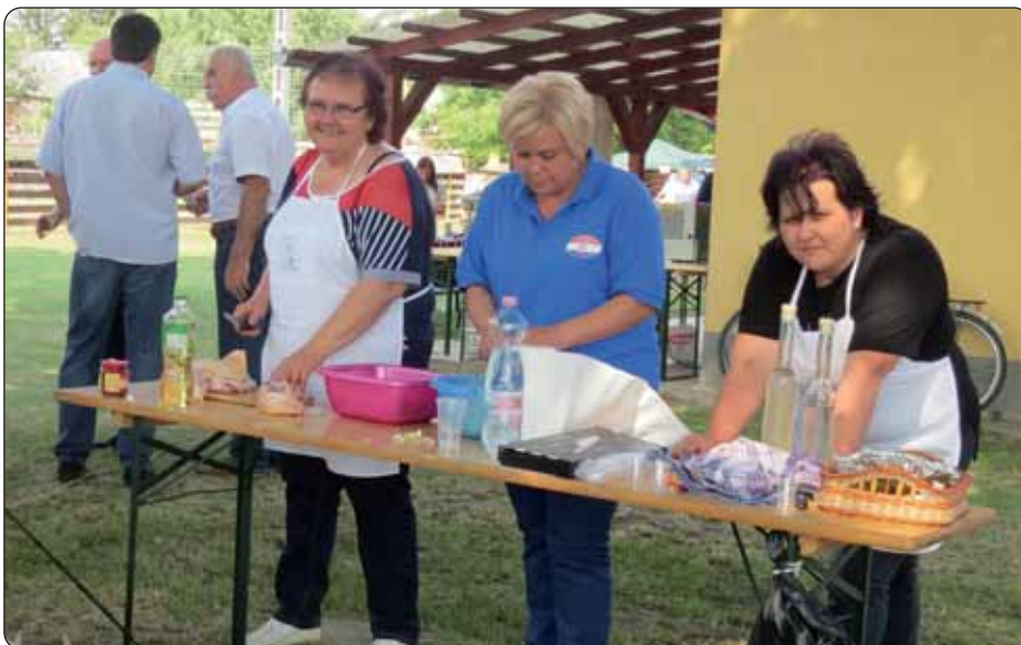
U kuhanju graha drugo je mjesto osvojila martinačka ženska skupina.

gometnog turnira i dodijeljeni pehari najboljima. Pobjednik nogometnog turnira bila je lukoviška momčad, drugo mjesto pripalo je hrvatskim nogometašima iz Gornjeg Bazja, a na trećem je mjestu završila bojevska momčad. Najbolji-ma su uručeni pehari, a ostalim sudionicima natjecanja spomenice. Ovogodišnje je druženje, kao obično, bilo vrlo uspješno, posjetitelji priredba su mogli uživati u dobroj hrani, odličnom društvu uza športska događanja i hrvatsku glazbu. Goste je zabavljao Tamburaški zbor i orkestar Biseri Drave iz Starina.