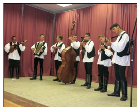
Dan sela Starina