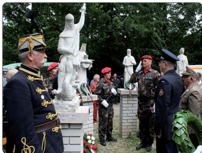
Za polaganjem vijenca