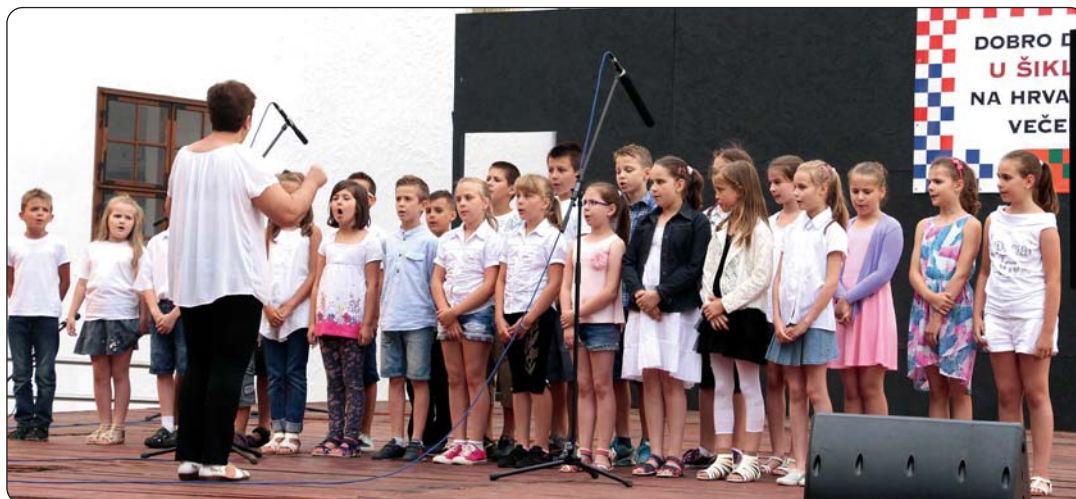
Zbor nižih razreda Osnovne škole „Dorottya Kanizsai“

su napučili i članovi zbora nižih razreda šikloške Osnovne škole „Dorottya Kanizsai“ koji su otpjevali niz hrvatskih pjesama. Oni su pokazali i dio uspjeha koje zadobiva odnedavno uvođenje učenja hrvatskoga jezika u spomenutoj školi u satnici stranoga jezika uz potporu tamošnje Hrvatske samouprave, koja je krajem lipnja za tu djecu organizirala i Kamp razvoja sposobnosti.