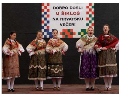
Hrvatski dan u Šiklošu