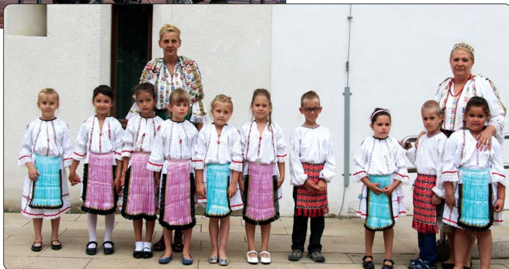
Djeca iz šikloškog vrtića

I ovogodišnja Hrvatska večer okupila je mnoštvo znatizeljnika u predvorju šikloške tvrđave. U programu koji je s prigodnim riječima otvorila Timea Bockovac, predsjednica tamošnje Hrvatske samouprave, nastupila su djeca s hrvatskim pjesmama i igrama iz šikloškog Vrtića Hétszinvirág gdje se s potporom mjesne Hrvatske samouprave u hrvatskoj „grupici“ one uče. Uz njih pozornicu