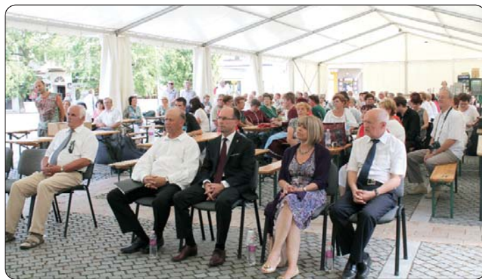
Časni gosti na programu

sve do skupne jačke na kraju, jer nijedan sambotelski Hrvatski dan ne more minuti prez poznate melodije s tekstem „Gizdav sam da sam Hrvat... Gdo je i nadalje ostao, i ovput se nije razočarao jer petroviska Pinkica sve je učinila da do polnoći na tancoškoj placi zadrži razdragane Hrvate i njeve prijatelje.