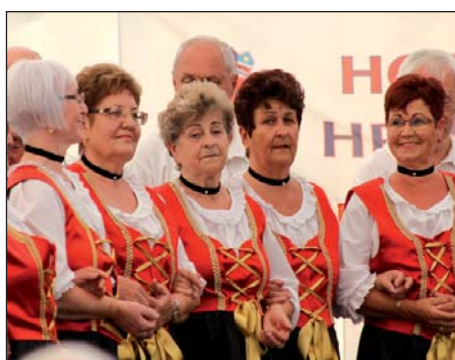
VIII. Hrvatski dan u Sambotelu