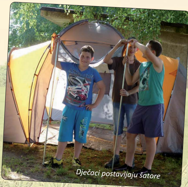
Dječaci postavljaju šatore