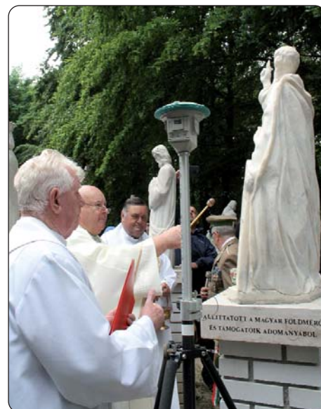
Blagoslavljanje nove statue

će postaviti pilj i Sv. Martinu u parku meštrijov. Trojezično shodišće je završeno zlatomašnim blagoslovom i preskrajnim druženjem te malo hladnije nedilje u prirodi, kade će se najti vjerniki i ove nedilje pri maši Snizne Marije, na kraju taborovanja katoličanske mladine.