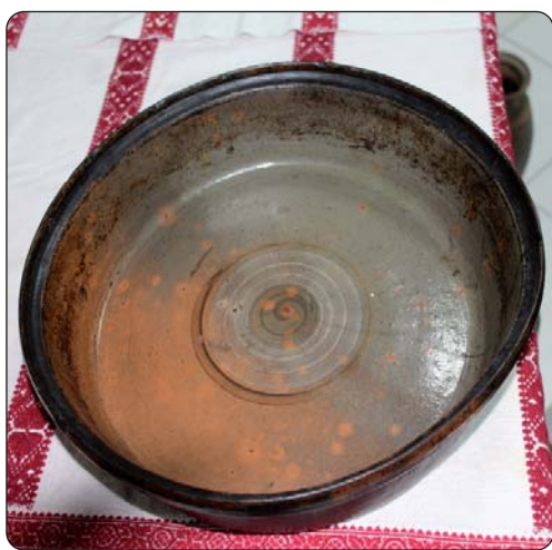
Najbolja zdjela za gibanicu i pizzu

druge predmete. U zadnje se vrijeme latio i restauriranja, pronašao je negdje stara dječja kolica koja su bila u vrlo lošem stanju pa ih je sa svojim prijateljem počeo obnoviti. Na internetu je pro-