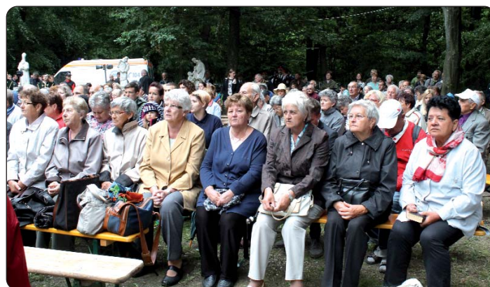
Ovput su i Kemljanci došli k Peruškoj Mariji