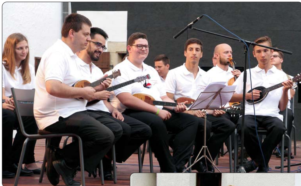
Orkestar sudionika ovogodišnje V. Ljetne škole tambure

Lani u ljetnim mjesecima šikloška Hrvatska samouprava organizirala je okupljanje oko programa Hrvatskoga dana u prekrasnome gradskom prostoru šikloške tvrđave. Ovogodišnji, 3. srpnja održani Hrvatski dan nastavak je lanjskog događaja poradi stvaranja običaja okupljanja šikloških Hrvata te njihovih simpatizera i prijatelja. U prekrasnome zdanju šikloške tvrđave od prošle godine do danas Hrvatska samouprava ostvarila je i stalni postav spomen-sobe s izloženom materijalnom kulturom semartinskih Hrvata, onoga sela u neposrednoj blizini Šikloša koje su 70-ih godina 20. stoljeća napustili i posljednji šokački Hrvati, čiji potomci danas žive većinom u Šiklošu.