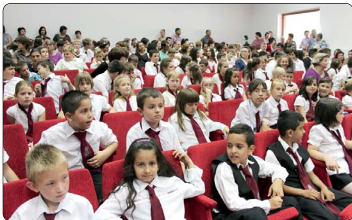
Keresturska djeca na svečanosti zatvaranja školske godine