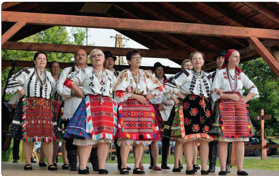
Salantski KUD Marica prvi put u Novom Selu

U organizaciji Hrvatske samouprave Novoga Sela i Hrvatske samouprave Šomođske županije, 24. srpnja u tom naselju prikazana je priredba pod naslovom Hrvatski narodnosni dan 2016.