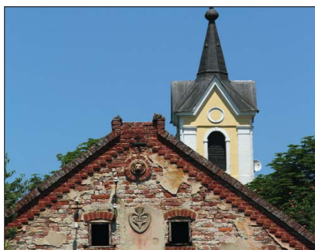
Bučura sv. Jane