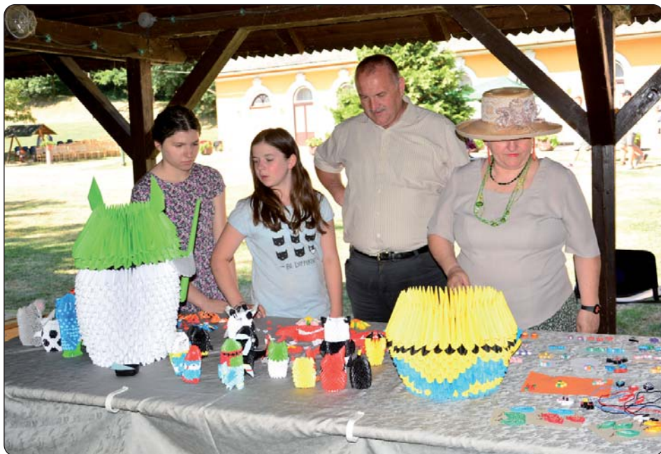
Razgledaju se učenički radovi.

Samouprava XV. okruga i ove je godine priredila Međunarodni kamp primijenjenih umjetnosti u Bernecebarátiju, prvoga lipanjskog tjedna. Posredstvom Hrvatske samouprave tog okruga sudjelovala su i djeca iz Donjega Kraljevca.