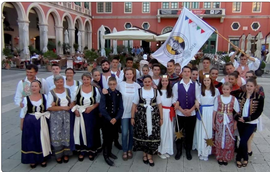
HOŠIG-ova Literarna i plesna scena u Splitu, na jednom od tamošnjih najljepših trgova

Nakon dugačkog, ali ugodnog putovanja, 28. lipnja stigli smo na prvu postaju naše turneje, u Dubrovnik. Osjećali smo se kao doma, naime naš je domaćin bio Ženski đlački dom, gdje svake godine tjedan dana borave naši maturanti.