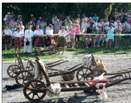
Pranje na Dunavu