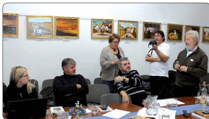
Izuzetno je bila plodna prevoditeljska djelaonica

izgledati, a sad ta radionica iz godine u godinu raste. Ovaj put smo naizgled s puno truda najviše pjesama preveli do sada. Imali smo jako zanimljivu raspravu o književnoj suradnji između Gradišća i stare domovine, i zapravo smo došli do nekih konkret-