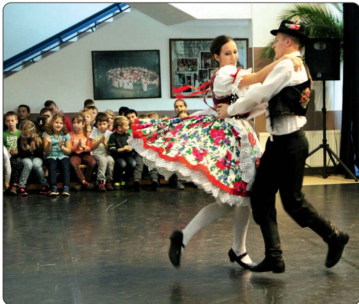
Osječki učenici izvode mađarski ples.

U budimpeštanskome HOŠIG-u između 21. i 25. studenoga 2016. bio je redoviti „Tjedan hrvatske kulture“ u sklopu kojeg su već ustaljeni sadržaji poput: „košare darova“, povijesnoga kviza, kazališne predstave ili školskoga natjecanja u pjevanju. I ovoga su puta gostovali i profesori i učenici pojedinih škola, a školu su posjetili i ugledni gosti.