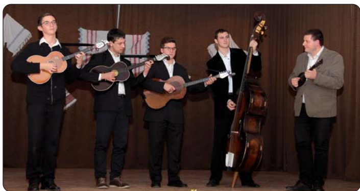
Orkestar salantskog KUD-a Marica

Iako snijega i nije bilo, ali je vrijeme bilo pro hladno kada se u Katolju, 26. studenog, u organizaciji Hrvatske narodnosne samouprave