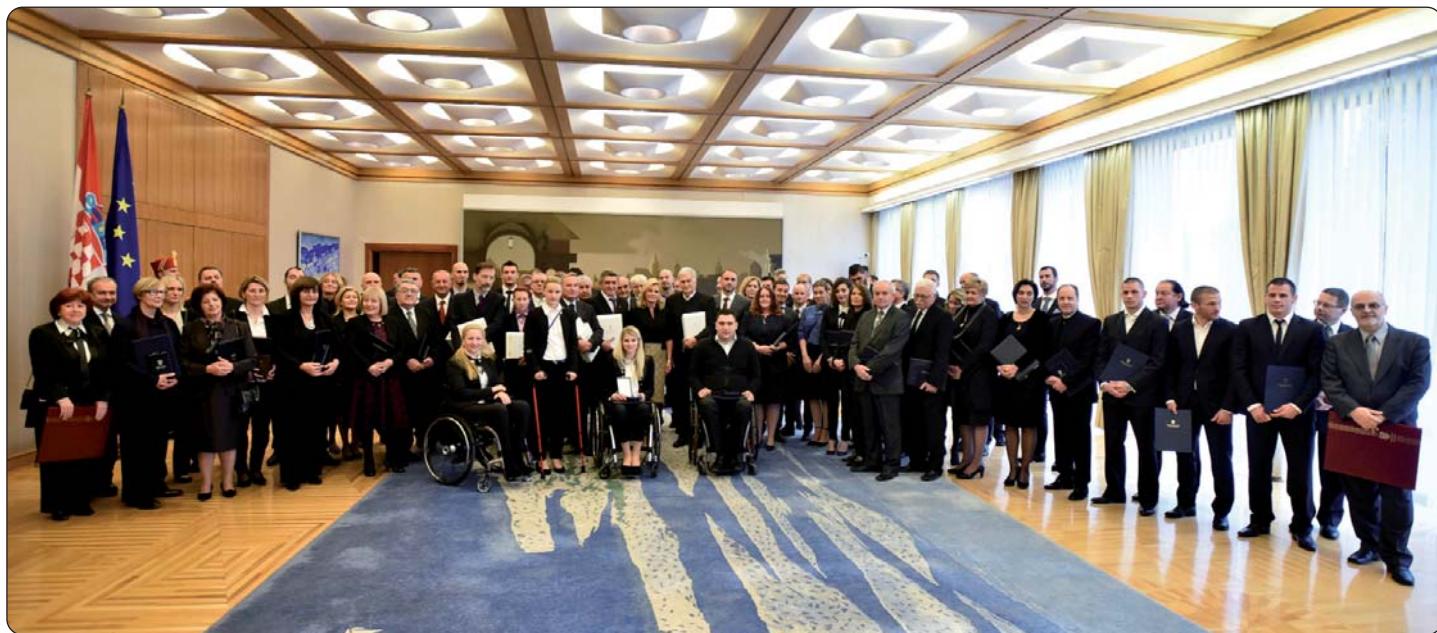
Predsjednica Republike Hrvatske Kolinda Grabar Kitarović svečano je uručila odlikovanja i pohvale za 2016. godinu

Predsjednica Republike i vrhovna zapovjednica Oružanih snaga Republike Hrvatske Kolinda Grabar Kitarović 5. prosinca u Uredu predsjednice na Pantovčaku održala je svečano primanje u prigodi uručenja odlikovanja i pohvala za 2016. godinu. Među odlikovanimima je i Savez Hrvata u Mađarskoj, hrvatska udruga koja djeluje najprije kao narodnosna organizacija od studenoga 1990. godine, a od sredine devedesetih godina kao udruga. Kako saznaje Medijski centar Croatica (Hrvatski glasnik Radio – Croatica) odličje je u ime Saveza Hrvata u Mađarskoj preuzeo njegov predsjednik Joso Ostrogonac. Savez Hrvata u Mađarskoj odlikovan je Poveljom Republike Hrvatske, za osobite zasluge u djelovanju na kulturnom i prosvjetnom području te promicanju i očuvanju samobitnosti hrvatskoga jezika i običaja u Mađarskoj, a u prigodi 25. obljetnice rada i djelovanja.