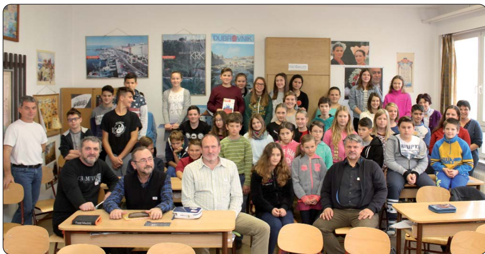
Književnici u petroviskoj Dvojezičnoj školi