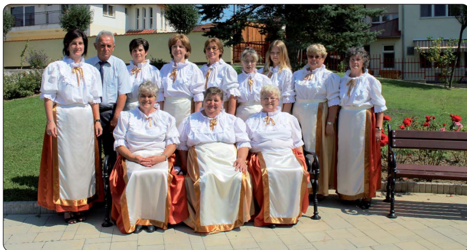
Sepetnički „Veseli zbor“

i zahvalila na priredbi. Susret hrvatskih pomurskih zborova jedna je od najvećih priredaba sepetničke Hrvatske samouprave na kojoj se okupe gotovo svi hrvatski zborovi, tamburaški sastavi iz cijele pomurske regije. Velik je to događaj za sepetničku hrvatsku zajednicu, prigodom takvih susreta dobivaju podršku od ostalih hrvatskih zajednica, one ih potvrđuju i jačaju u očuvanju nacionalne samobitnosti te važnosti njegovanja hrvatske riječi i kulture. Tako je bilo i ove godine, na Susretu su