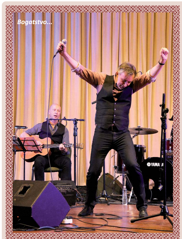
Miroslav Škoro u Budimpešti