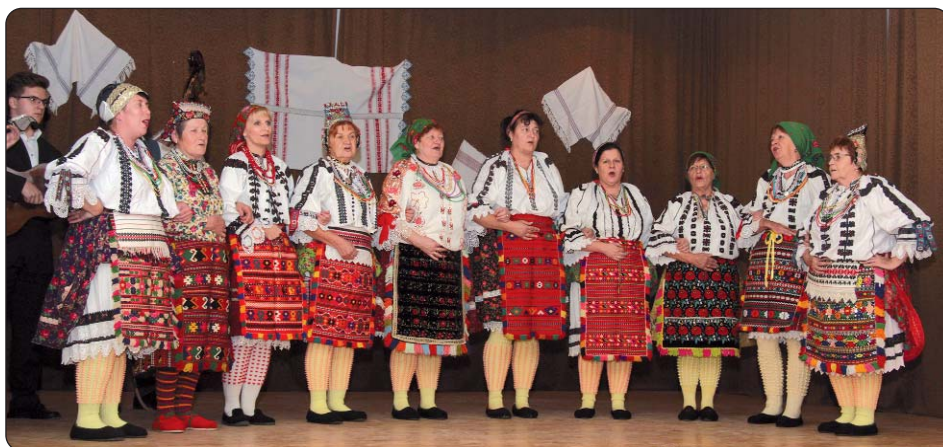
Pečuški Ženski pjevački zbor „A. Šenoa“