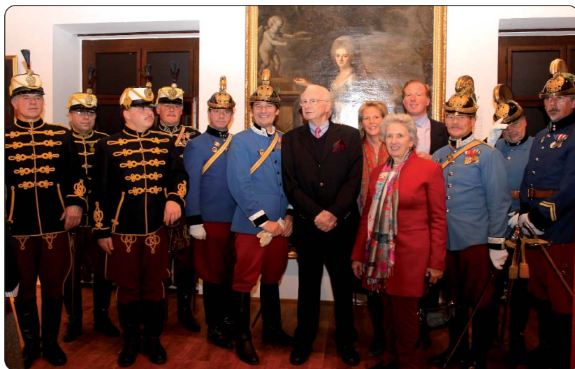
Člani grofovske obitelji s Pejačevićevim regimentom i husari