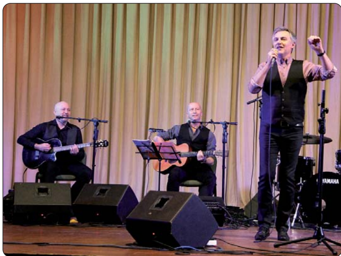
Miroslav Škoro i orkestar

U organizaciji Neprofitnog poduzeća Croatica, njenog odjela za kulturnu djelatnost, 5. prosinca 2016. u kazališnoj dvorani Instituta „Balassi“ priređen je gotovo dvosatni koncert hrvatskoga pjevača Miroslava Škore. Osim organizatora, taj su koncert sufinancirali: Agroproteinka Zagreb, budimpeštansko predstavništvo Hrvatske turističke zajednice, Hrvatska državna samouprava, Hrvatska samouprava grada Budimpešte, Hrvatska samouprava V. i XII. okruga. Na početku koncerta svim predstavnicima podupiratelja Croaticin ravnatelj Čaba Horvath uručio je dar tvrtke kojoj je na čelu.