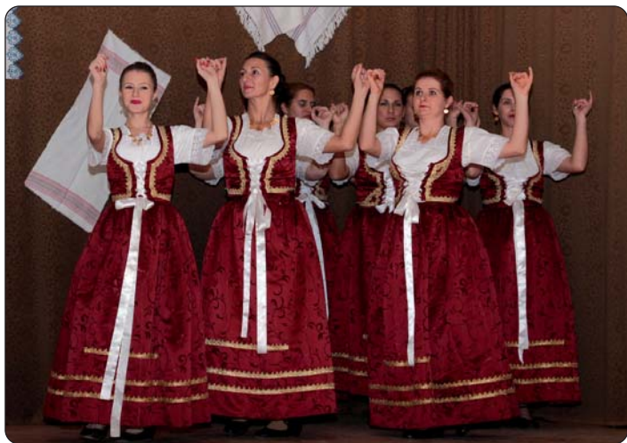
Birjanska Hrvatska plesna skupina

Iako snijega i nije bilo, ali je vrijeme bilo pro hladno kada se u Katolju, 26. studenog, u organizaciji Hrvatske narodnosne samouprave