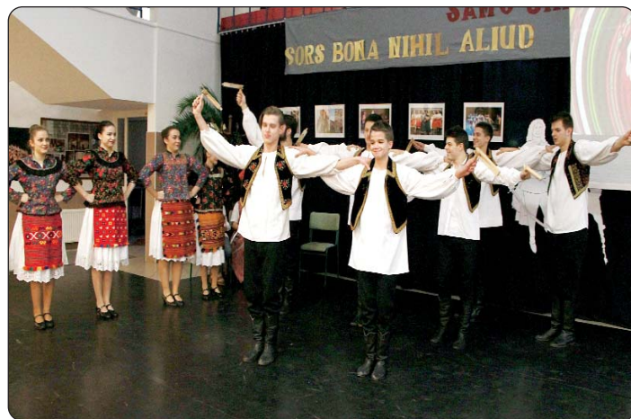
Scena iz školskog igrokaza

Čestitamo svim sudionicima Tjedna hrvatske kulture, te svim pojedincima koji su svojim radom i zalaganjem pridonijeli da nas i ove godine hošigovci obdare ljepotom hrvatskoga jezika, kulture i običaja naših predaka i naše budućnosti.