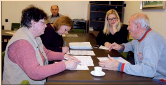
Djelatnice narodnosnog ureda i članovi Odbora za financije

Bez veće rasprave, jednoglasno je prihvaćen Proračun za 2017. godinu s prihodima i rashodima u iznosu od 1,063 milijuna forinta. Prema pismenome prijedlogu, prihodi i ove godine čine godišnja opća potpora za djelovanje u iznosu od 782 tisuće i ostatak iz 2016. od 281 tisuće forinta. Među rashodima 563 tisuće forinta osigurano je za materijalne izdatke djelovanja, putne troškove, stručne i ine usluge te druge troškove održavanja, a 500 tisuća za podupiranje mjesnih samouprava i udruga, odnosno programa i priredaba od širega regionalnog značaja. Na teret potonje stavke bačinskoj Hrvatskoj samoupravi dodijeljeno je 100 tisuća forinta za priređivanje Županijskoga hrvatskog malonogometnog turnira. Međutim, zbog nedostatka sredstava ili, bolje rečeno, nepoznavanja iznosa dodatne potpore za obavljanje javnih zadaća za ovu godinu, druge su tri zaprimljene molbe odbijene.