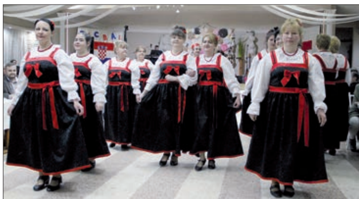
Splitski plesovi u izvedbi skupine „Igraj kolo“