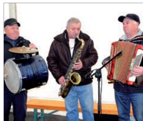
II. Kolinje u Letinji