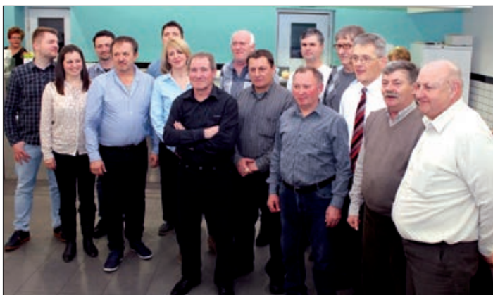
Bivši i sadašnji slavni muzičari Pinka-banda na kupu

Ov zgoditak bio je važan i zato što na Prisičana pred par ljet je naletila teška bolest iz ke se je iskobacao mukom, molitvom i podupiranjem mnogih. „Nisam bio svenek gvišan da ću doživiti 60. rodjendan, ali je mužika bila s manom i u špitalju i za transplantacijom u šterilnoj sobi. Stalno sam mužiku slušao, kad sam nek mogao, snagu i strpljenje mi je dala. Bilo je pogibelno, ali je sad to sve mimo“, rekao je slavljjenik, čije privatno spravišće preaslo je u pravi društveno-muzički događaj Gradišća jer svirači iz spomenutih sel većinom su se odazvali pozivu i donesli su i svoje instrumente, na zadovoljstvo i veselje jubilara, a i svih pozvanih ljudi. „Mnoga ljeta sričan bio, mnoga ljeta živio, u ljubavi i veselju, to bi mi zaželjili“, ova jačka je napunila nakinčenu prostoriju katoličke škole u Kisegu pred čestitkom predsjednika Hrvatske samouprave, Šandora Petkovića. „Danas smo na tvoj poziv iz svih krajev Gradišća došli, a ja mislim da to čuda ča znači. Teško vrime je za nami, ali ti si nam takovu peldu pokazao, kako si svoju bolest nosio da si svakoga počvrstio u tom da se svenek moramo boriti. Bog te neka blagoslovi i čuva“, rekao je peljač