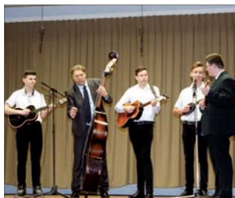
Santovačko marindansko društvo