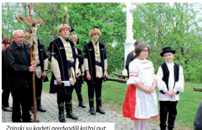
Zrinski su kadeti predvodili križni put.