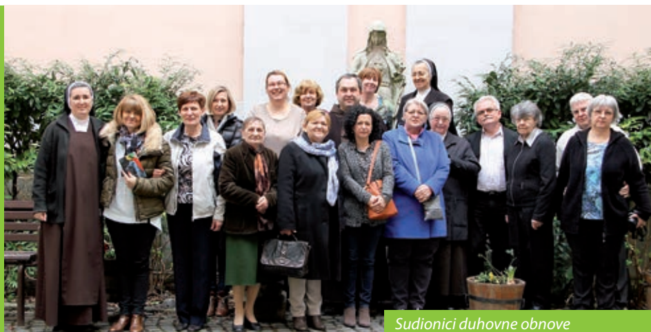
Sudionici duhovne obnove

Hrvatska katolička zajednica Matije Petra Katančića i sestre karmelićanke Božanskoga Srca Isusova 19. ožujka 2017. organizirale su duhovnu obnovu za hrvatske vjernike mađarskoga glavnoga grada i njegove okolice. Na pripravi je bilo dvadesetak vjernika, a druženje su financijski poduprli Hrvatska samouprava V., VII. i XV. okruga.