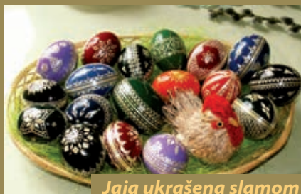
Jaja ukrašena slamom

dodatno naglašavanje njihove simbolike s bojom, te ispisivanjem magijskih riječi ili motiva u prošlosti. Pisanice se ukrašavaju na različit način na pojedinim područjima, njihovi se pradávnici uzorci mogu prepoznati.