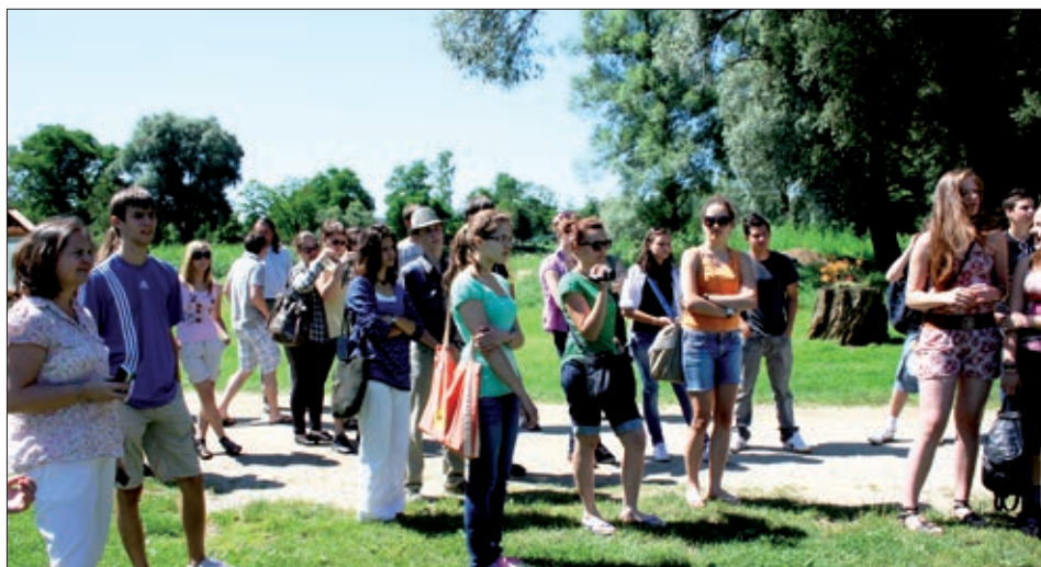
Studenti i srednjoškolci u Kampu javnog života SETA