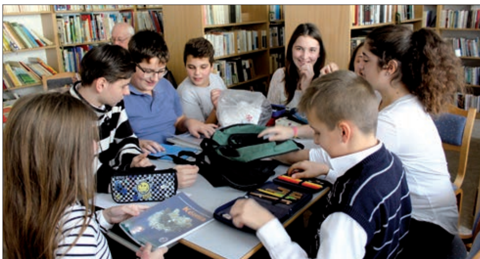
Na hrvatskom kvizu u Tjednu hrvatskoga jezika

– Tijekom deset godina zastupnici Samouprave većinom su bili pedagogi kojima, kao i meni, u prvom redu bilo je važno očuvanje hrvatskog jezika, bilo u obliku narječja, bilo književnoga jezika, i to je i danas tako. Trudimo se da naši programi budu isključivo na hrvatskom jeziku, jer se jezik sve