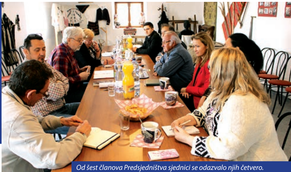
Od šest članova Predsjedništva sjednici se odazvalo njih četvero.

U zgradi vršenske Šokačke čitaonice 30. ožujka održana je sjednica Predsjedništva Saveza Hrvata u Mađarskoj, koju je sazvao predsjednik Saveza Joso Ostrogonac. On je na sjednicu pozvao sve članove Predsjedništva i predsjednika Nadzornog odbora Miju Štandovara te nekoliko uzvanika.