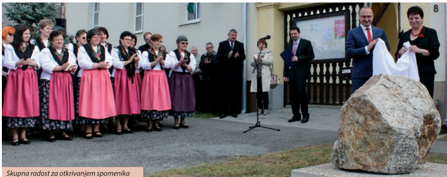
Skupna radost za otkrivanjem spomenika