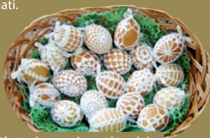
Pleteni uzorci na pisanici