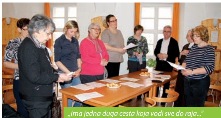
„Ima jedna duga cesta koja vodi sve do raja...“