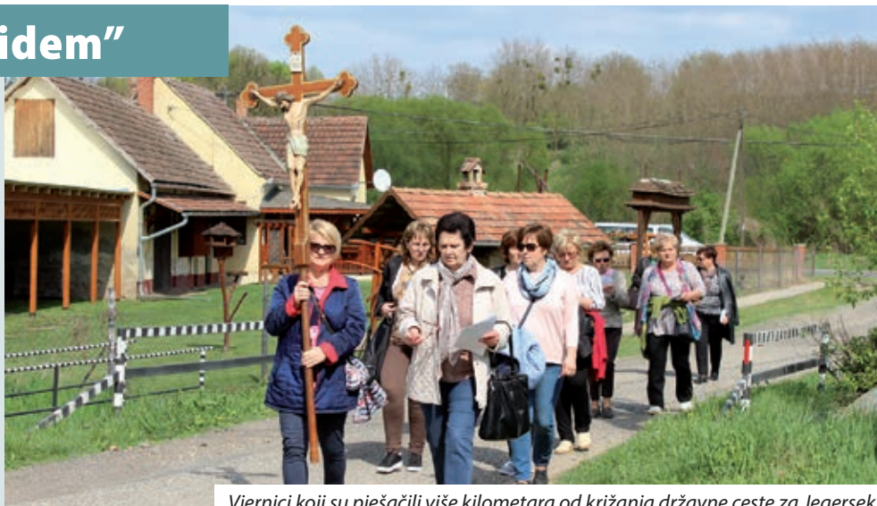
Vjernici koji su pješačili više kilometara od križanja državne ceste za Jegersek

„Križnom drevi ja idem, kaj ti samo tam najdem duši svojoj pokoja“ – pjevali su pomurski vjernici na hrvatskome križnom putu u Komaru 9. travnja na Cvjetnu nedjelju. Na križni put okupilo se sedamdesetak vjernika iz pomurskih hrvatskih naselja, za čiju organizaciju pobrinula se Hrvatska samouprava Zalske županije.