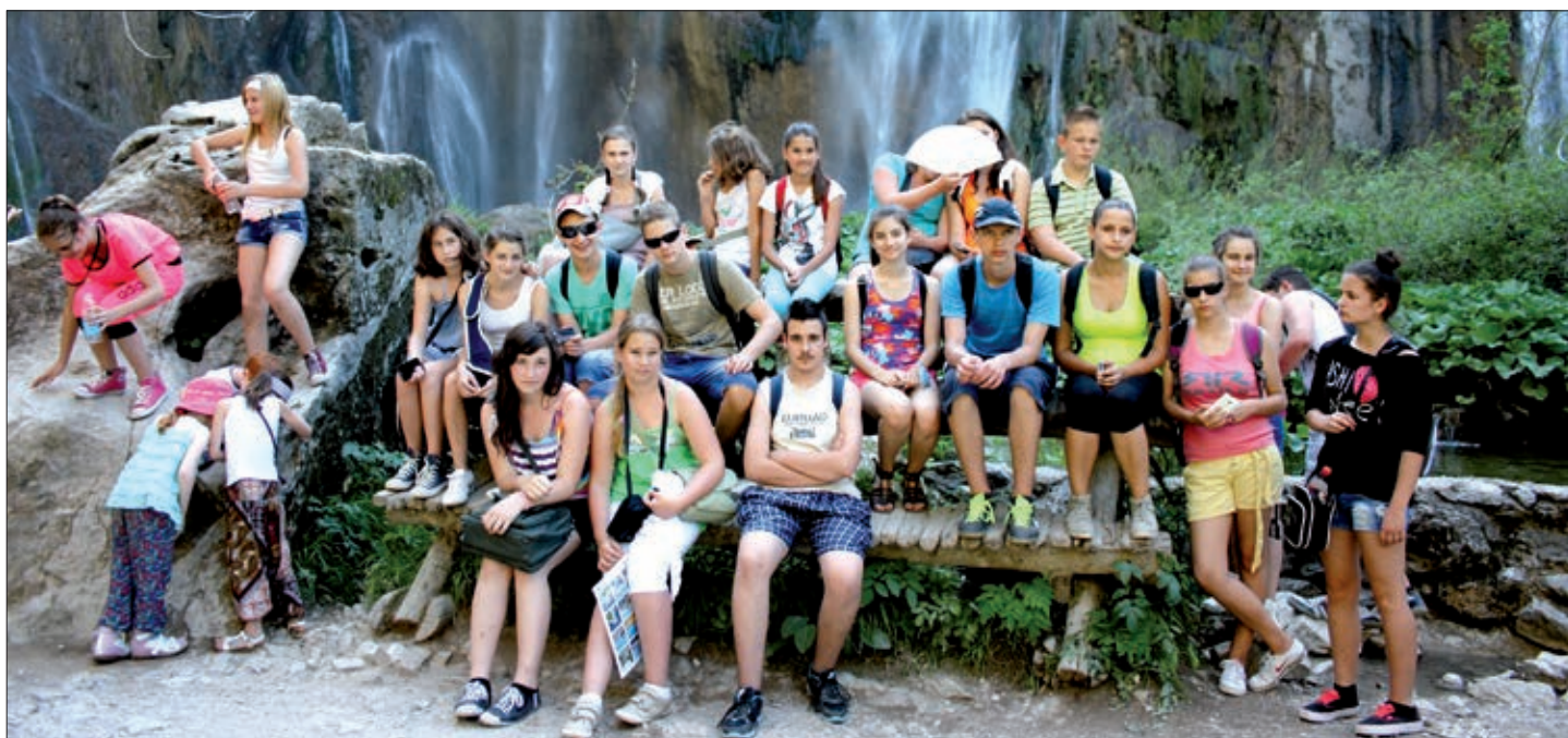
Djeca na Plitvičkim jezerima, u organizaciji serdahelske Hrvatske samouprave

dobiva maksimalnu potporu, naime prema zadnjem popisu pučanstva 70 % mještana izjasnilo se pripadnikom hrvatske narodnosti. Narodnosna je samouprava i