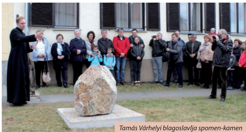
Tamás Várhelyi blagosavlja spomen-kamen

Grlić Radman, hrvatski veleposlanik. Mjesni duhovnik, Tamás Várhelyi je potom po hrvatski blagoslovio kamen „koji nas spominja na staru domovinu i na Hrvate koji su si našli novi dom u Petro-