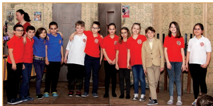
Kategorija 3. razred: natjecalo se 12 kazivača

Kategorija 4. razreda: natjecalo se šest kazivača koje je ocjenjivao ocjenjivački sud u sastavu Alisa Iljazović, Gabi Kohut i Zlata Štric.