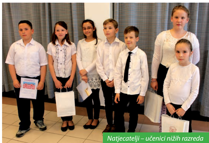
Natjecatelji – učenici nižih razreda