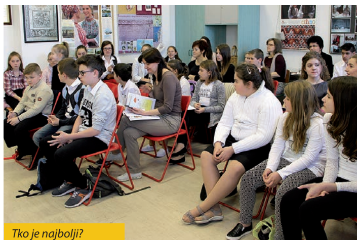
Tko je najbolji?