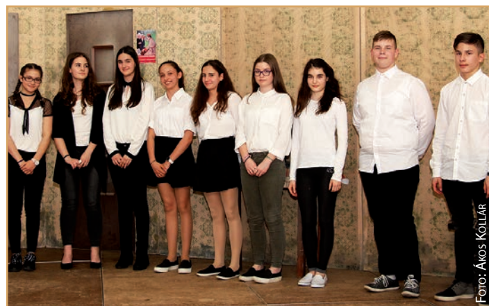
Kategorija 7. – 8. razreda: natjecalo se devet kazivača