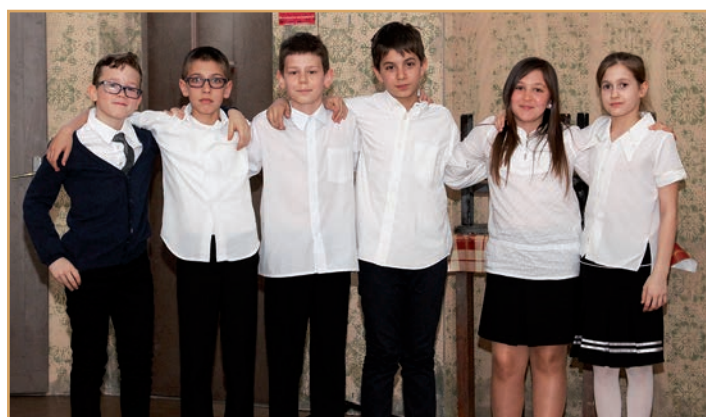
Kategorija 4. razreda: natjecalo se šest kazivača

Kategorija 5. – 6. razred: natjecalo se 12 kazivača koje je ocjenjivao ocjenjivački sud u sastavu Janja Šikloši, Alisa Iljazović i Mišo Balaž.