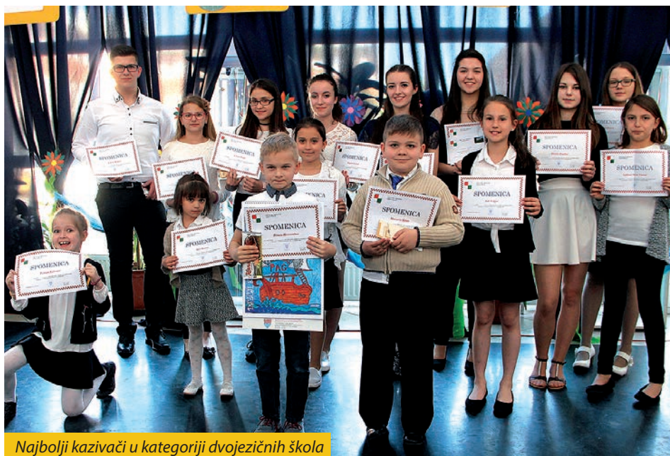
Najbolji kazivači u kategoriji dvojezičnih škola

kao članice. U ovoj su se skupini natjecali učenici škola iz: Bajе iz fancaške škole (3), i iz Osnovne škole „Šugavica“ (2), Bačina (3), Dušnoka (3), Starina (4), Mohača (4), Salante (3), Harkanja (3), Šeljina (3), Lukovišća (4), Boršfe (4), Tukulje (4), Kerestura (4), Serdahela (4), Hrvatskoga Židana (4) i Kisega (3). Kazivali su se stihovi također iz sveopće hrvatske književne baštine, a od autora Hrvata u Mađarskoj stihovi: Anke Matović Gatai, Stipana Blažetina, Stipana Filakovića, Miše Jelića, Josipa Gujaša Džurčina, Đuse Šimare Pužarova te narodne pripovijetke.