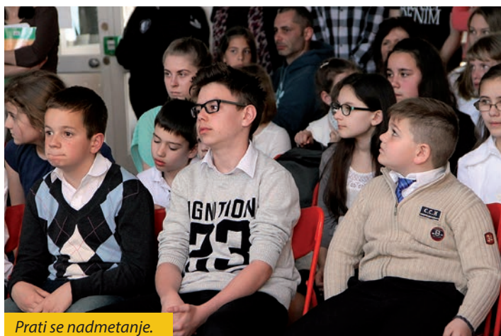
Prati se nadmetanje.