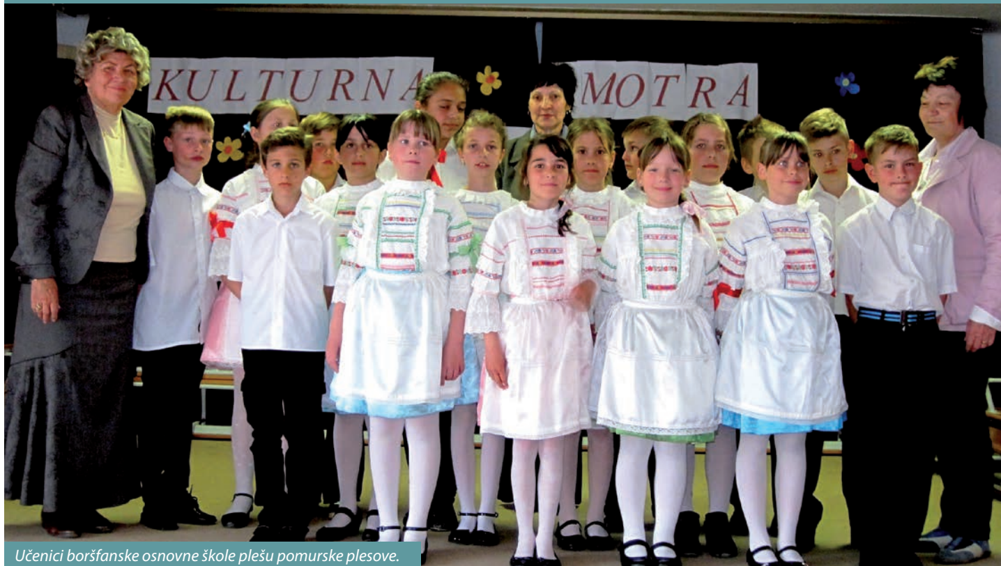
Učenici boršfanske osnovne škole plešu pomurske plesove.

U organizaciji Osnovne škole „István Fekete“, u Boršfi 5. travnja priređen je Dan hrvatske kulture na kojem su sudjelovali učenici iz pomurskih hrvatskih škola, i to iz Kereka i Kerestura te partnerskih ustanova iz Draškovca i Domašince. Priredba je bila posvećena hrvatskoj pjesmi, folkloru i druženju djece s obje strane granice.