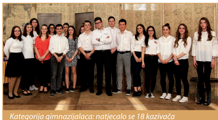
Kategorija gimnazijalaca: natjecalo se 18 kazivača

Kategorija gimnazijalaca: natjecalo se 18 kazivača, koje je ocjenjivao ocjenjivački sud u sastavu Jadranka Gergić, Dubravko Vrbešić i Mladen Filaković.