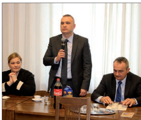
Suradnja gradova Baje i Požege