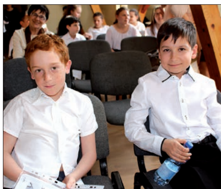
Natjecanje u lijepom čitanju