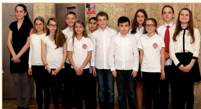
Kategorija 5. – 6. razred: natjecalo se 12 kazivača

Kategorija 7. – 8. razreda: natjecalo se devet kazivača koje je ocjenjivao ocjenjivački sud u sastavu Janja Šikloši, Alisa Iljazović i Mišo Balaž.