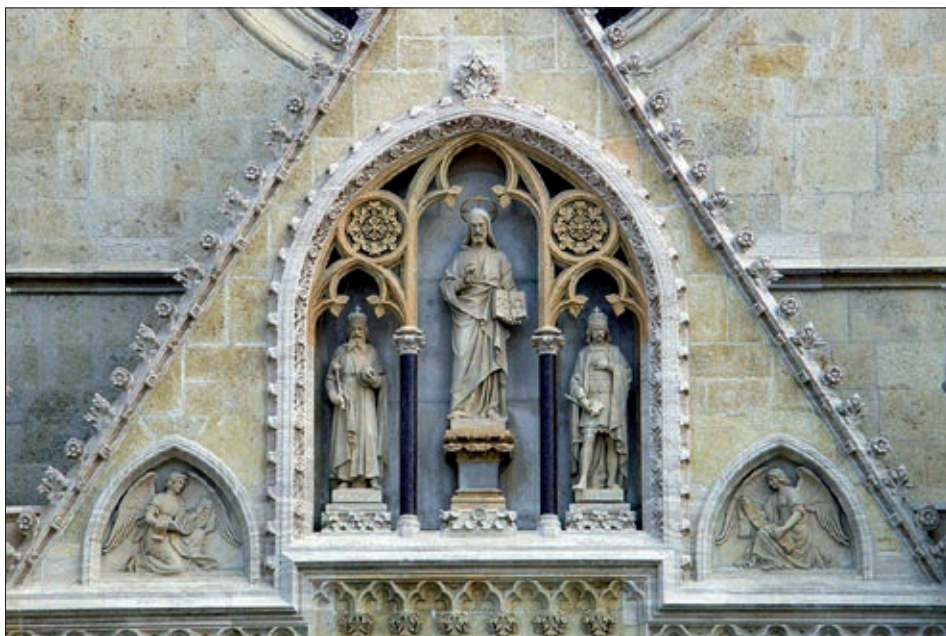
Sveti Stjepan, Krist Učitelj i sveti Ladislav u zabatu iznad portala zagrebačke katedrale.

Državno tajništvo za nacionalnu politiku Mađarske povodom 940. obljetnice stupanja na prijestolje i 825. obljetnice kanonizacije, 2017. proglasilo je godinom svetog Ladislava. Taj ugarski svetac osnivanjem Zagrebačke biskupije neprolazno je zadužio hrvatsko kršćanstvo, izjednačio se s najvažnijim zaštitnicima naših biskupija i gradova, poput sv. Vlahe, sv. Dujma, sv. Tripuna ili sv. Kvirina.