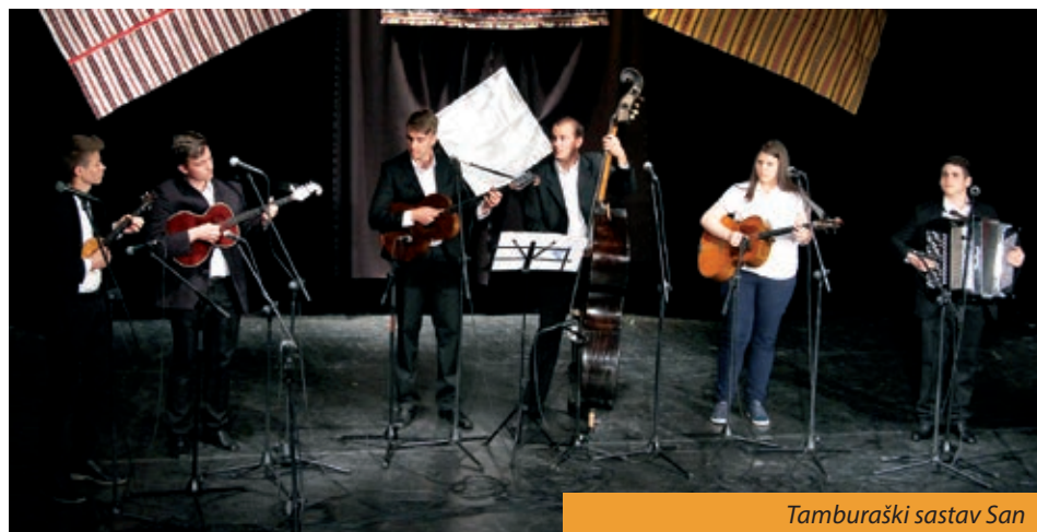
Tamburaški sastav San

Organizatori su s pomoću „mentora“, u svakoj regiji jedan mentor, izabrali sastave koji su se predstavili na Festivalu, njih pet uz goste iz Subotice: Tamburaški sastav Šetnja iz Hrvatskoga Židana, (Gradišće), Tamburaški sastav Stoboš iz Kaniže (Pomurje), KUD Biseri Drave iz Starina (Podravina), Tamburaški sastav San iz Subotice, Orkestar Vizin iz Pečuha (Baranja) i Orke-