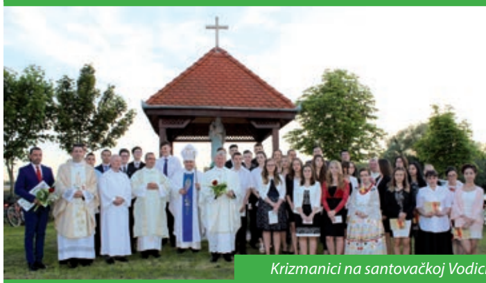
Krizmanici na santovačkoj Vodici