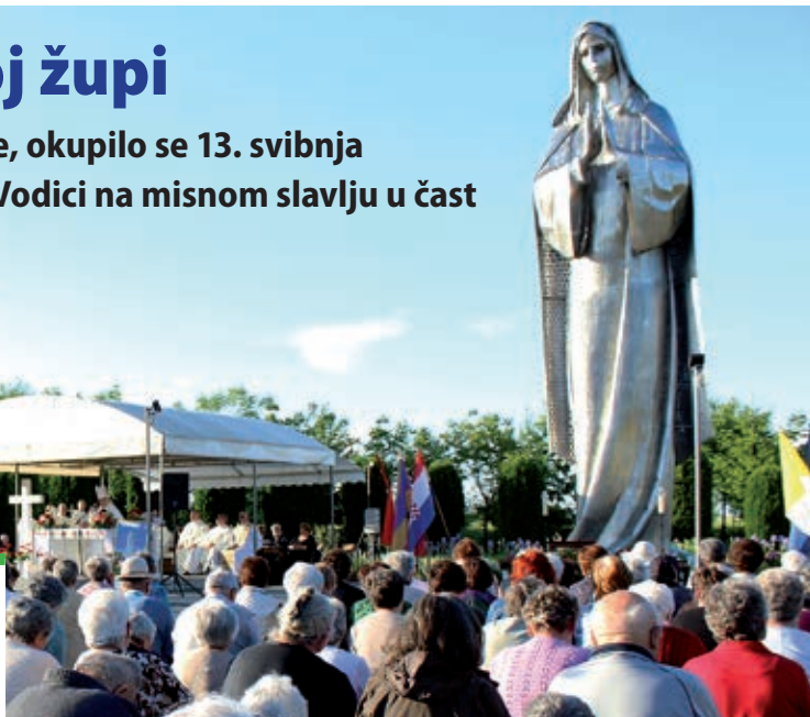
Podno Gospina kipa okupilo se tisuću vjernika.