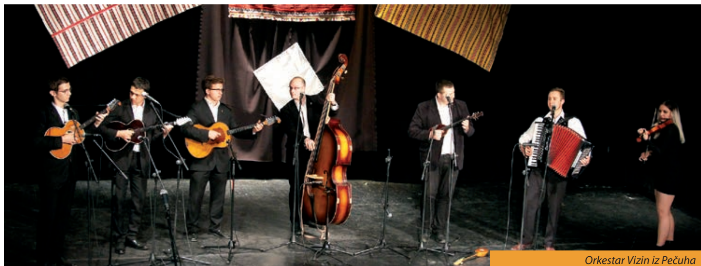
Orkestar Vizin iz Pečuha