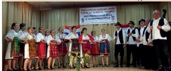
Barčanski KUD „Podravina“