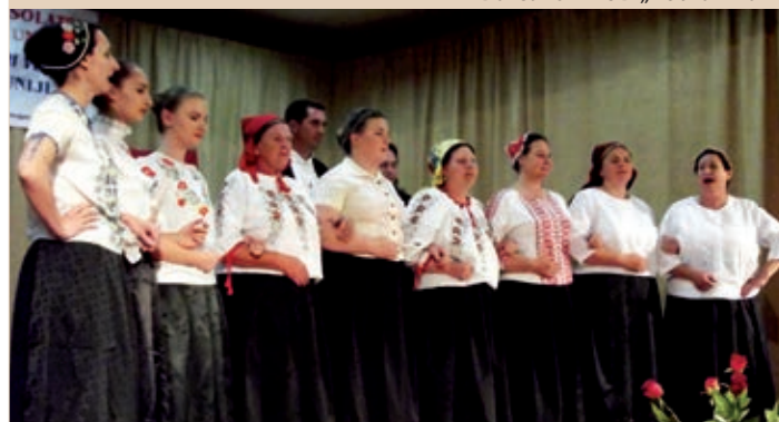
KUD „Novo Virje“