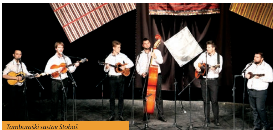
Tamburaški sastav Stoboš