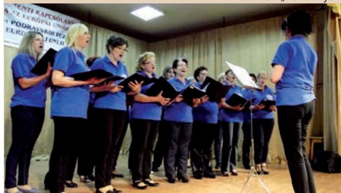
Molvarski pjevački zbor