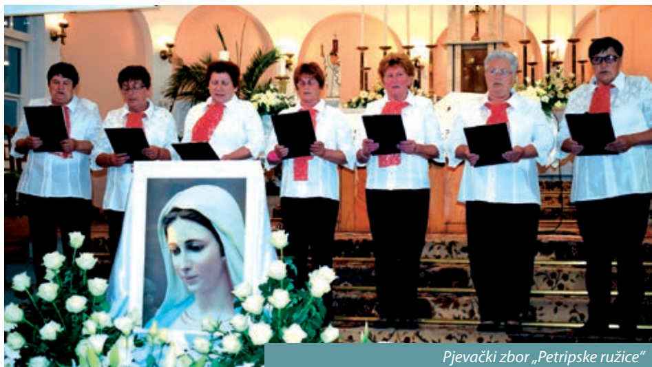
Pjevački zbor „Petripske ružice“

Susret crkvenih zborova „Pozdravljamo Mariju“ već godinama organizira kaniška Hrvatska samouprava po radi njegovanja hrvatskih crkvenih pjesama. Na ovogodišnjem susretu nastupilo je jedanaest zborova i dvije solistice. U kaniškoj crkvi Srca Isusova 21. svibnja više od 120 pjevača i svirača pjevalo je u čast Blažene Djevice Marije. Koncert zborova prethodila je sveta misa na hrvatskom jeziku, koju su predvodili Antun Hobljaj, dekan iz Preloga, i mons. Antun Perčić, generalni vikar Varaždinske biskupije.