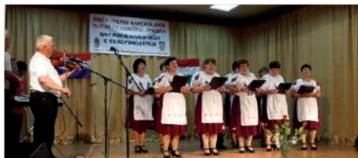
Izvarski pjevački zbor