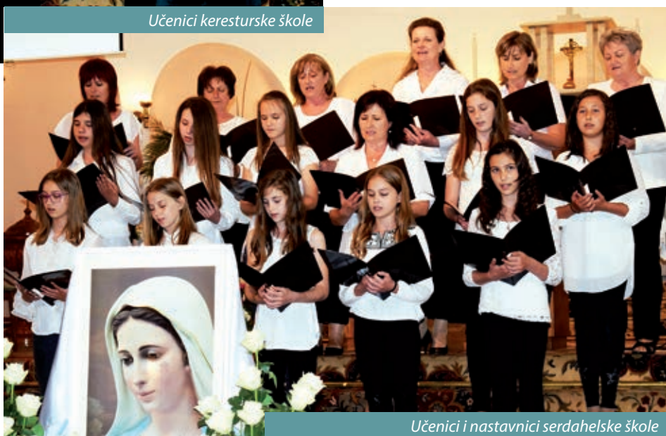
Učenici i nastavnici serdahelske škole