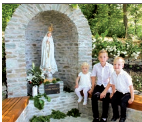
Blagoslovljen kip Fatimske Marije