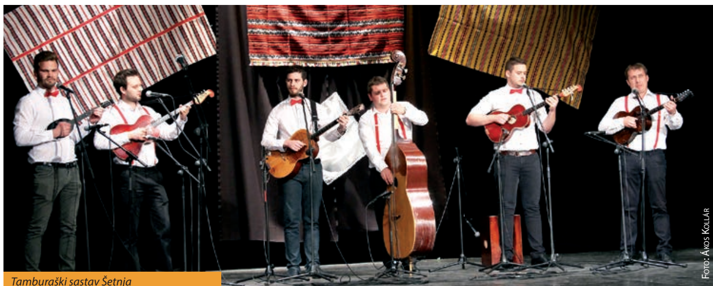
Tamburaški sastav Šetnja