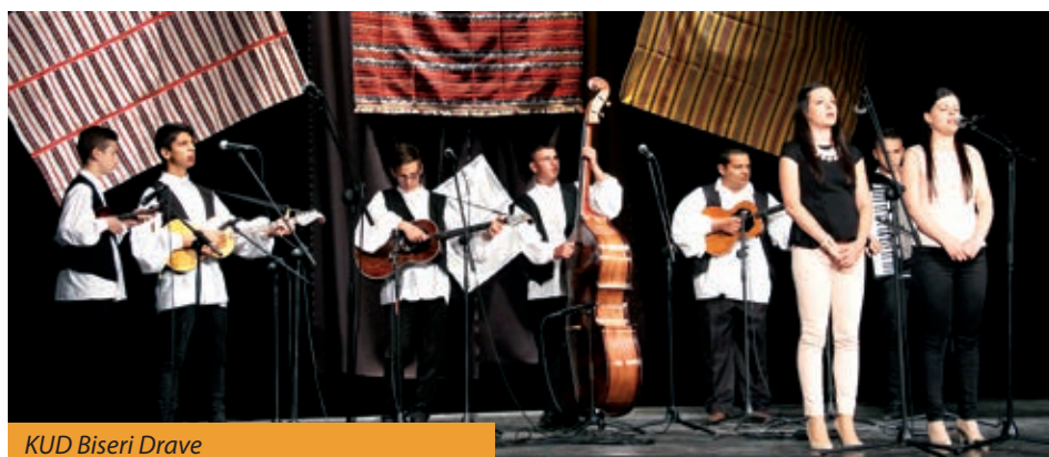
KUD Biseri Drave