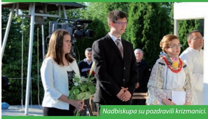
Nadbiskupa su pozdravili krizmanici.

ila je to prva od redovitih mjesečnih pobožnosti koje se svake godine održavaju u čast Gospe Fatimske od svibnja do listopada. Misno slavlje na otvorenom podno golemoga Gospina kipa, postavljenog i posvećenog u listopadu 2008. godine, predvodio je kalačko-kečkemetski nadbiskup Balázs Bábel, koji je mladima podijelio i sakrament krizme.