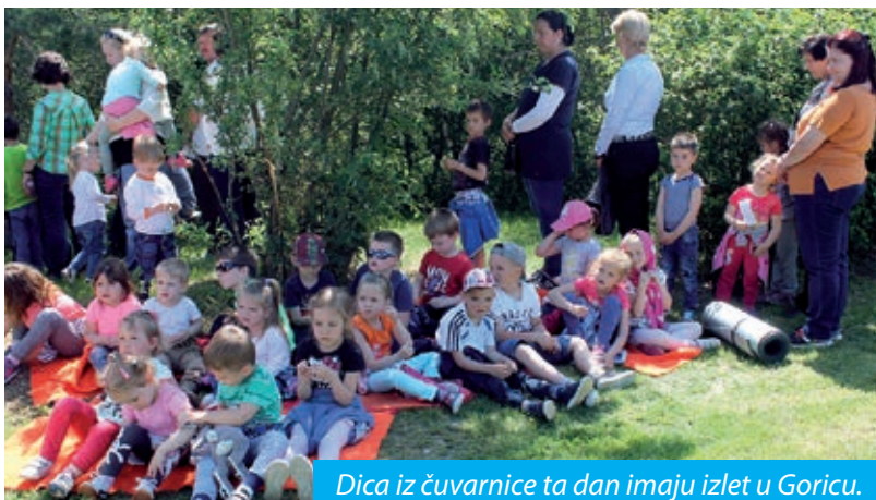
Dica iz čuvarnice ta dan imaju izlet u Goricu.