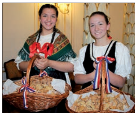
Uz Dan državnosti