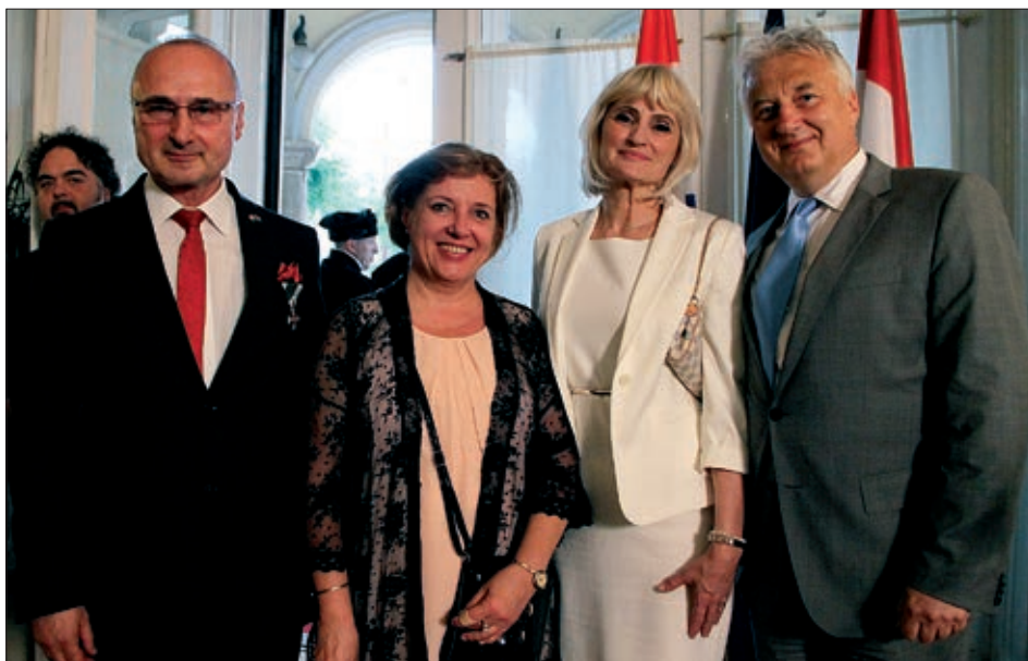
Zamjenik premijera Mađarske Zsolt Semjén i veleposlanik Gordan Grlić Radman sa suprugama

Obraćajući se nazočnima hrvatski veleposlanik Gordan Grlić Radman između ostalog reče da je moderna hrvatska država međunarodno priznata prije 25 godina. Prijateljska Mađarska, s kojom je Hrvatska umalo tisuću godina živjela poput sestre u jednoj državnoj zajednici, bila je među prvima koja je priznala samostalnu Hrvatsku. „Iako je prošlost bila bremenita, ono što je ostalo kao trajna odrednica jesu dobro i pozitivni osjećaji