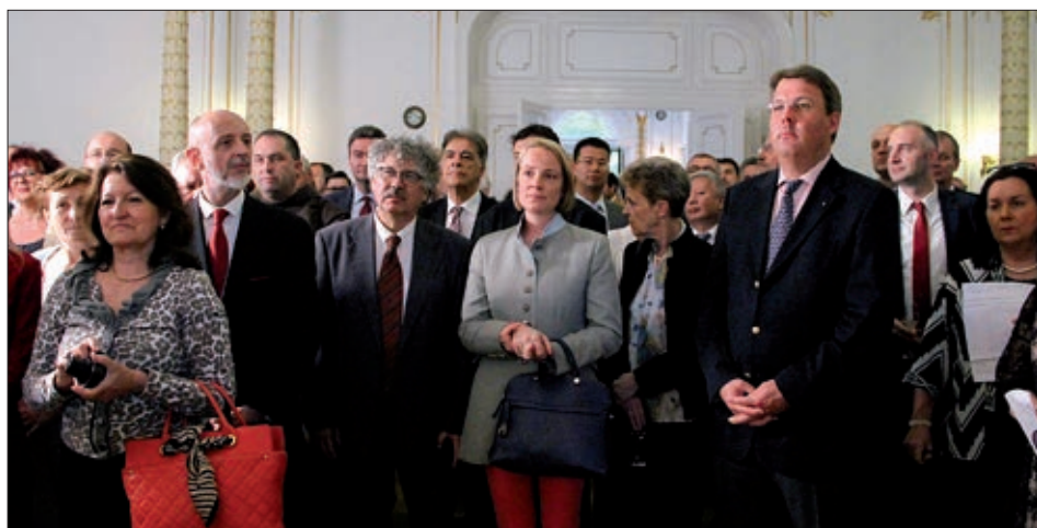
Dio od tristotinjak uzvanika