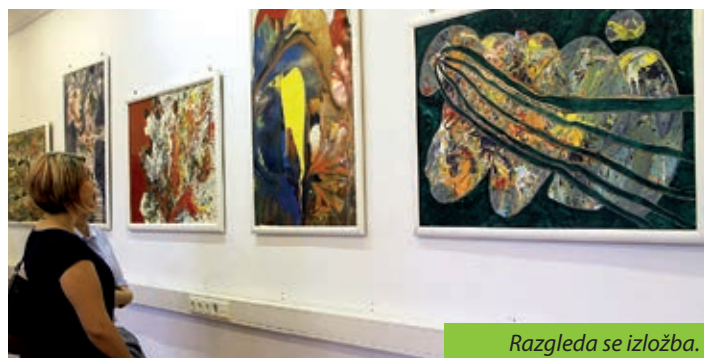
Razgleda se izložba.

aktivnim športom, postupno se vraća svojoj staroj ljubavi, slikarstvu (1990). Radi u tušu, temperi, emajlu i akrilu. Iza sebe ima brojne skupne i samostalne izložbe. Budimpeštanskoj se publici predstavio s petnaestak slika u emajlu. Postav je otvorila Maja Rosenzweig Bajić, koja je naglasila kako je Veleposlanstvu Republike Hrvatske uvijek drago kada se u mađarskome glavnom gradu predstavlja netko od hrvatskih umjetnika, jer se time dodatno ojačaju gotovo tisućljetne veze Hrvatske i Mađarske, dviju zemalja koje su uvijek i u najtežim trenucima stajale jedna uz drugu. „Šipek je naslutio vezu između događanja slike i potrebe za opredmećenjem vlastitih zanosa, i izradio poetiku kao vid apstraktnog izraza. Ponekad postoji asocijativnost predmetnog, no uglavnom djela su to nefigurativnog karaktera, vrlo bogate teksture, upravo tvarnosti, metričnosti plohe. (...) Šipek kreće od iskre ideje, udaljen od racionalnoga promišljanja i prepušta se uzbuđenjima koja kreativni luk nosi. A rezultat i nije iznenađenje, jer u avanturi slikarskog spontaniteta javljaju se i pravila i obrati, dinamika poteza traži svoju protutežu, koloristički trik točku smiraja“, napisao je o umjetničkom izričaju Miroslava Šipeka hrvatski povjesničar umjetnosti i likovni kritičar Stanko Špoljarić. Svirajući na gitari, otvorenje su glazbeno uveličali slikar i njegov sin Krunoslav. Potom su svi pozvani u klupsku prostoriju na sendviče, sokove i vino.