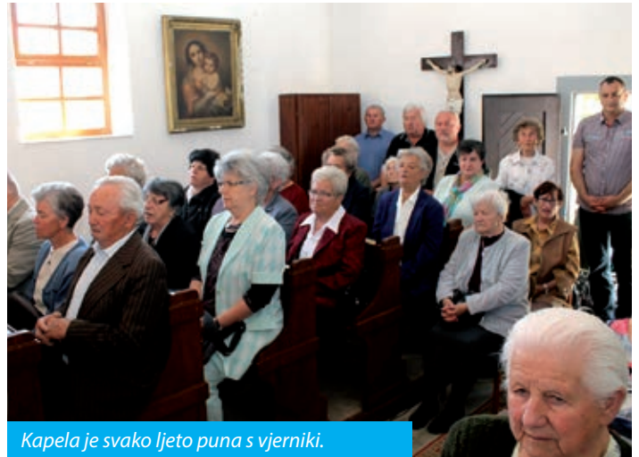
Kapela je svako ljeto puna s vjerniki.