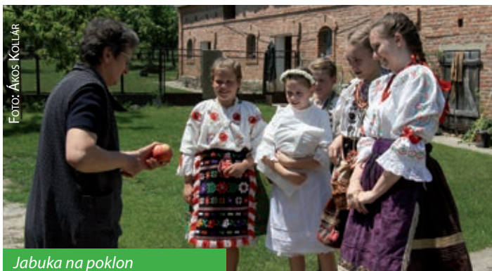
Jabuka na poklon

Današnje 70-godišnjakinje ne sjećaju se da su one kao djeca išle na Duhove od kuće do kuće obučene u „kraljice“. Ali kažu neki da je običaj „kraljica“ ipak živio u Salantskoj župi početkom 20. stoljeća. Sve u svemu, KUD „Marica“ prije dvadeset i nešto go-