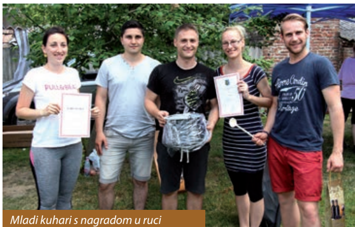
Mladi kuhari s nagradom u ruci

U organizaciji fočke Hrvatske samouprave, 3. lipnja upriličena je priredba koju su organizatori nazvali „Duhovska svečanost i natjecanje u kuhanju“. Druženje je započelo prijepodne oko deset sati dolaskom natjecatelja u revijalnom kuhanju i njihovom prijavom, a nastavilo se ocjenjivanjem jela i objavom rezultata, te zajedničkim objedom. Kuhala se riblja juha. Za ribu su se pobrinali organizatori. Svaka je družina dobila po tri kile ribe, šarana,