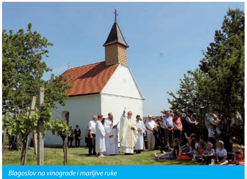
Blagoslov na vinograde i marljive ruke