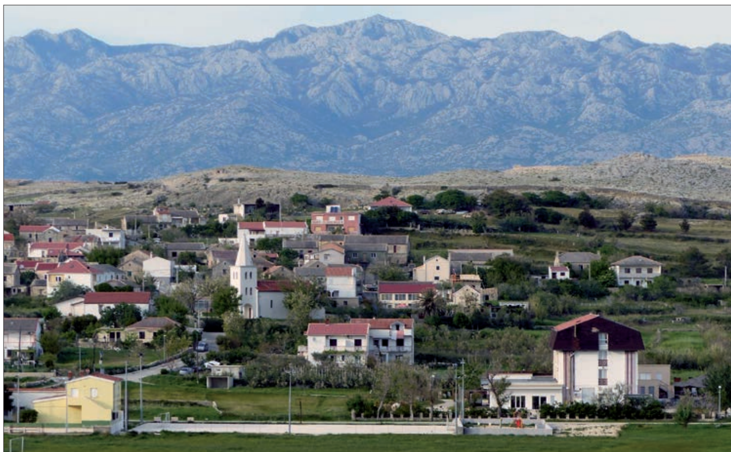
Naselje Vlačići u kojem od svibnja 2005. godine djeluje poduzeće u HDS-ovu vlasništvu.

ma ulaže i gazduje, krevete i namještaj to ćemo u roku od godinu-dvije godine mi sami financirati.