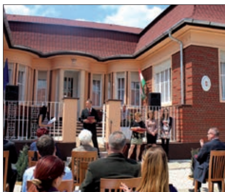
Novi čavoljski ured