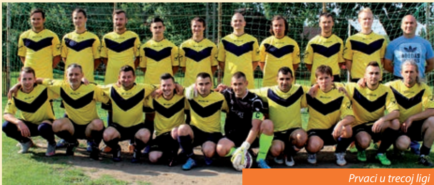
Prvaci u trecoj ligi