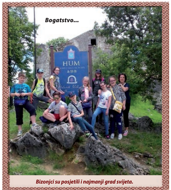
Bizonjci su posjetili i najmanji grad svijeta.