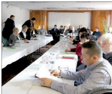
Sjednica HDS-ove Skupštine