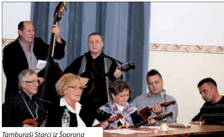
Tamburaši Starci iz Šoprona