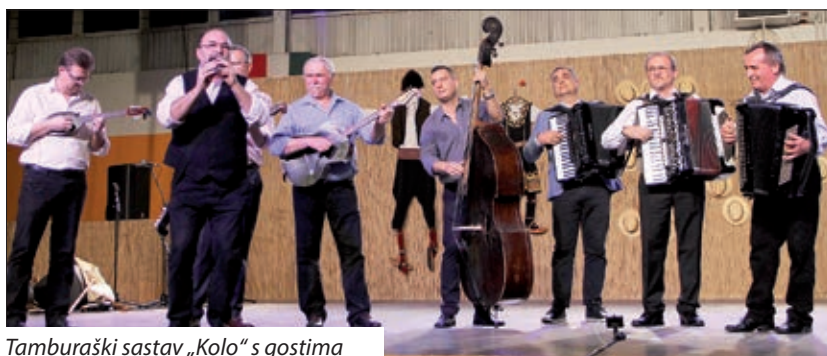
Tamburaški sastav „Kolo“ s gostima