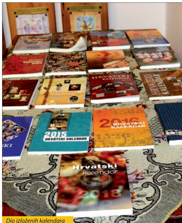
Dio izloženih kalendara