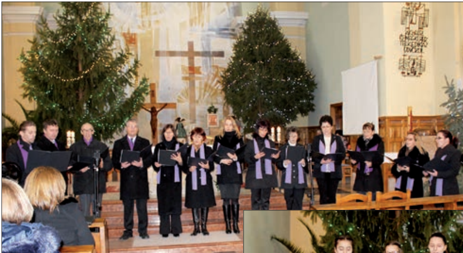
Santovački crkveni pjevački zbor

Posljednja godišnja priredba bačkih Hrvata u 2017. godini održana je u Dušniku. U suorganizaciji mjesne Hrvatske samouprave i Hrvatske vjerske zajednice rimokatoličke župe, između Božića i Nove godine, 28. prosinca 2017., u dušnočkoj župnoj crkvi svetih apostola Filipa i Jakova priređen je već uobičajeni Božićni koncert i Susret hrvatskih crkvenih pjevačkih zborova. Umalo dvadeset godina ovaj susret pridonosi njegovanju i očuvanju crkveno-vjerske i kulturne baštine, a uz to