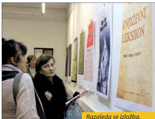
Razgleda se izložba.