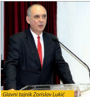
Glavni tajnik Zorislav Lukić

Prigodnim predavanjem glavnoga tajnika Matice hrvatske Zorislava Lukića, u prostorijama Croatice u Budimpešti, obilježena je 175. obljetnica utemeljenja Matice hrvatske. Na priredbi je pribivao i veleposlanik Republike Hrvatske u Mađarskoj Mladen Andrić, predsjednik Hrvatske državne samouprave Ivan Guban, ravnatelj Croatice Čaba Horvath i Hrvati mađarskoga glavnoga grada i njegove okolice. Priredbu su organizirali Matica hrvatska, Veleposlanstvo Republike Hrvatske u Mađarskoj i Croatia.