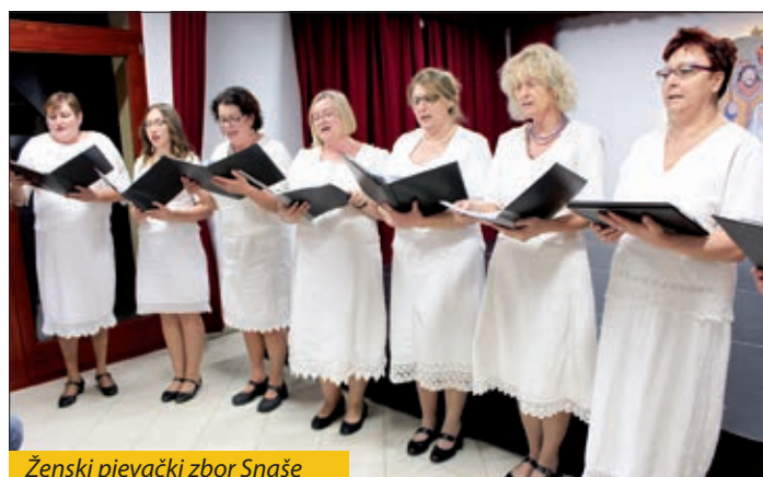
Ženski pjevački zbor Snaše

do demokratskih promjena, te na godišnjake onaslovljene Hrvatski kalendar, a posebna je pozornost dana predstavljanju sadržaja Hrvatskog kalendara 2018, što ga je za hrvatske obitelji u Poganu kupila i darivala im ga Hrvatska samouprava sela Pogana. I prije i nakon izložbe i predavanja listalo se i razgovaralo o kalendarškom štivu i važnosti pisane riječi u protoku opstanka i čuvanja samobitnosti Hrvata u Mađarskoj. MCC