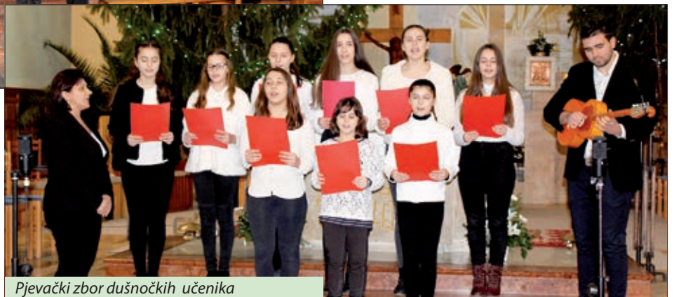
Pjevački zbor dušnočkih učenika

Posljednja godišnja priredba bačkih Hrvata u 2017. godini održana je u Dušniku. U suorganizaciji mjesne Hrvatske samouprave i Hrvatske vjerske zajednice rimokatoličke župe, između Božića i Nove godine, 28. prosinca 2017., u dušnočkoj župnoj crkvi svetih apostola Filipa i Jakova priređen je već uobičajeni Božićni koncert i Susret hrvatskih crkvenih pjevačkih zborova. Umalo dvadeset godina ovaj susret pridonosi njegovanju i očuvanju crkveno-vjerske i kulturne baštine, a uz to