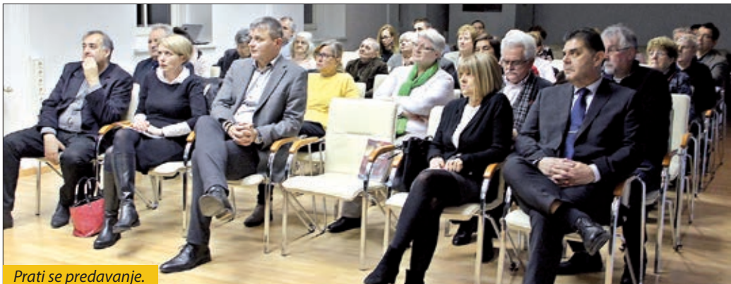
Prati se predavanje.