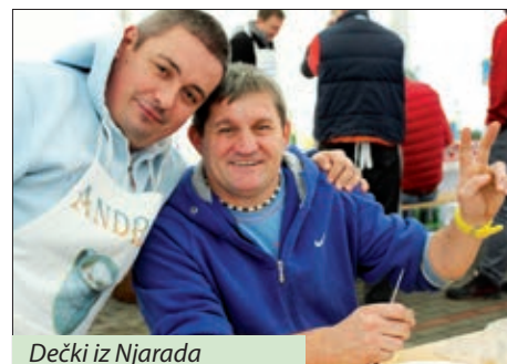
Dečki iz Njarada