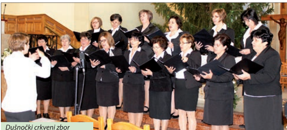
Dušnočki crkveni zbor