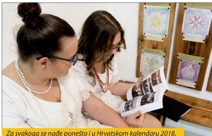
Za svakoga se nađe ponešto i u Hrvatskom kalendaru 2018.