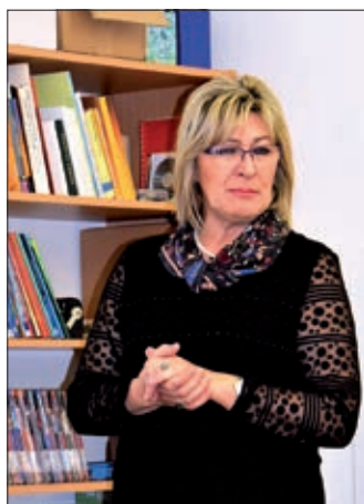
Profesorica govori o teškoćama ocjenjivanja.

prirode i društva, te glazbene kulture. Studenti sudjeluju i na raznim programima, prošle su godine bili na Hrvatskome državnom danu, a ove godine na Đačkoj konferenciji o povijesti pomurskih naselja, odnosno na programima Pomorskih književnih dana. Buduće učiteljice, učitelji svake se godine temeljito pripremaju na sate s najnovijim pjesmicama, igrama, informacijama o ljepotama matične domovine, predstavljeni su hrvatski izvorni proizvodi, nematerijalna kulturna baština Hrvatske, narodna kola, zaštićene životinje, razne priče i pjesme. Nastava je održana i u nižim i u višim razredima, dakako s prilagođenim nastavnim sadržajima pojedinoj dobi. Cilj je suradnje upoznavanje studenata s narodnosnim obrazovnim programom, te pružanje pomoći u učenju hrvatskoga jezika svim sudionicima obrazovanja u serdahelskoj školi, tj. govor na hrvatskom jeziku. Prema mišljenju profesorice Zrilić, tijekom 16 godina vidljiv je napredak: