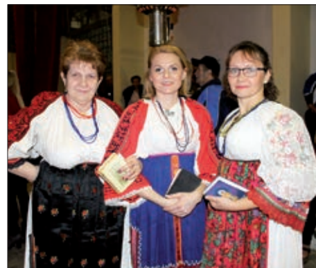
Koncert u Martincima