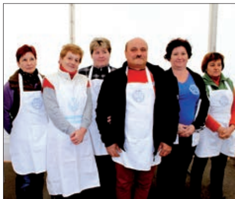
Druženje u Mišljenu