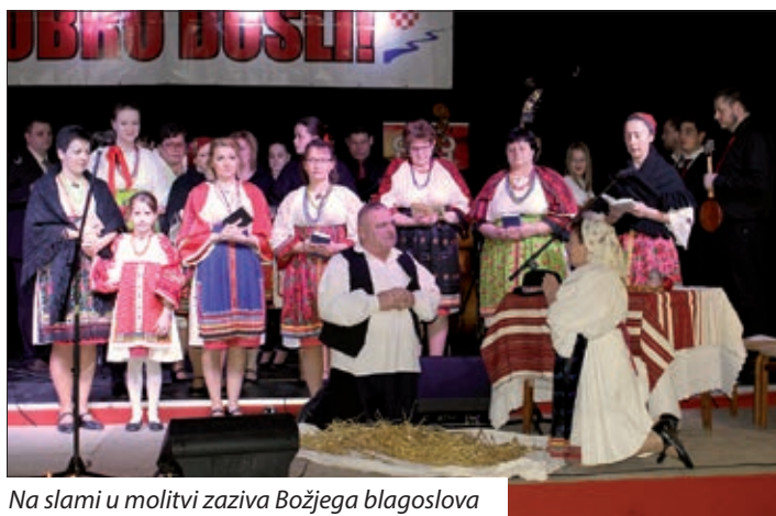
Na slami u molitvi zaziva Božjega blagoslova