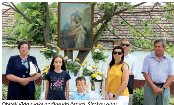
Obitelj Vida svake godine kiti četvrti, Širokov oltar

kon-laik Péter Szabó učinio je to kod mađarskih. Ispred svakog oltara uz čitanje Evanđelja, molitvu i blagoslov, naizmjenično na hrvatskom i mađarskom jeziku, pjevale su se blagdanske pjesme. Uslijedilo je misno slavlje na hrvatskom jeziku koje je služio santovački župnik Imre Polyák, u pratnji župnog kantora Zsolta Siroka.