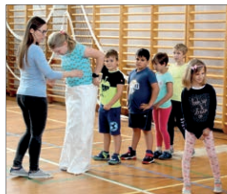
Ljetni tabor u Sambotelu