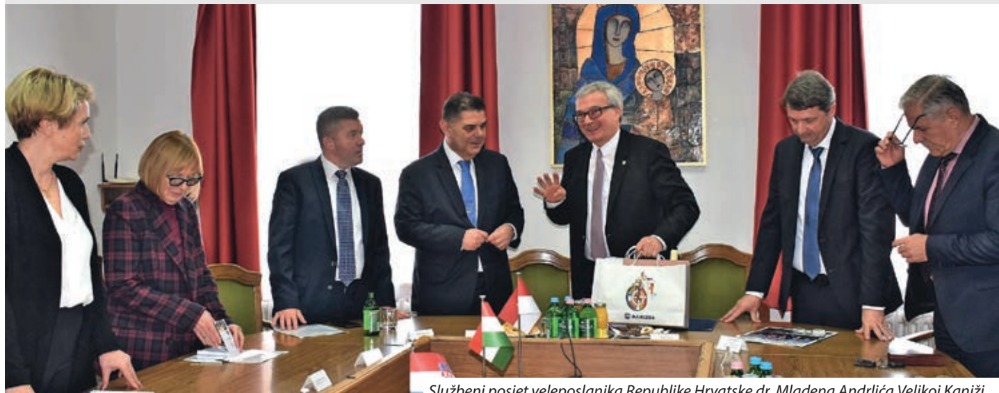
Službeni posjet veleposlanika Republike Hrvatske dr. Mladena Andrića Velikoj Kaniži

U vrijeme epidemije koronavirusa, dok su se s ciljem suzbijanja zaraze diljem svijeta uvodile drastične mjere, uključujući i zatvaranje granica, diplomatske su misije imale posebnu ulogu. Kako doznajemo od počasnog konzula Republike Hrvatske u Velikoj Kaniži dr. Atila Kosa, hrvatska diplomatska predstavništva u Mađarskoj su komunikaciju između dvije zemlje u vrijeme zatvaranja hrvatsko-mađarske granice provodila na vrlo visokoj razini, izvješćujući građane o epidemiološkoj situaciji u obje države i pružajući pomoć svima koji su zbog bilo kojeg razloga ostali u inozemstvu i željeli se vratiti u domovinu.