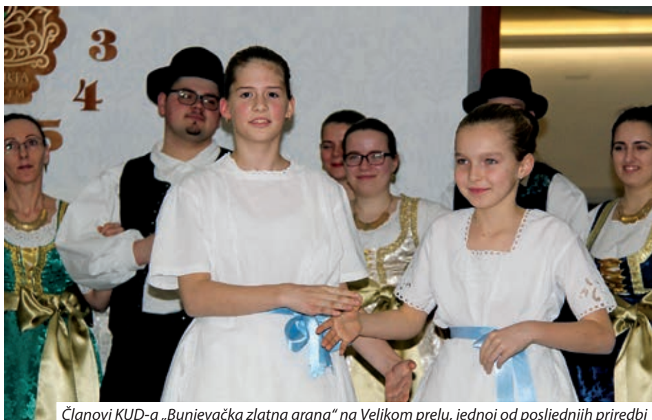
Članovi KUD-a „Bunjevačka zlatna grana“ na Velikom prelu, jednoj od posljednjih priredbi

bilo gostujućeg svećenika iz Subotice, no najavljeno je da će se u župnoj crkvi svetog Antuna Padovanskog nastaviti redovite mjesečne mise na hrvatskom jeziku. Hrvatske mise, koje služi fra Zdenko Gruber ili netko od franjevačke braće iz Su-