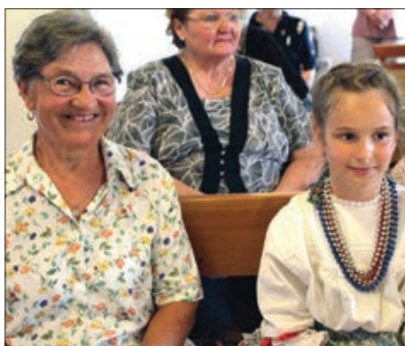
Srpnica, zaštitnica Udvara