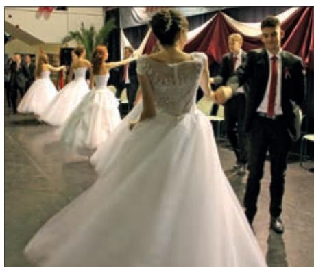
Predaje maturalnih vrpca u HOŠIG-u