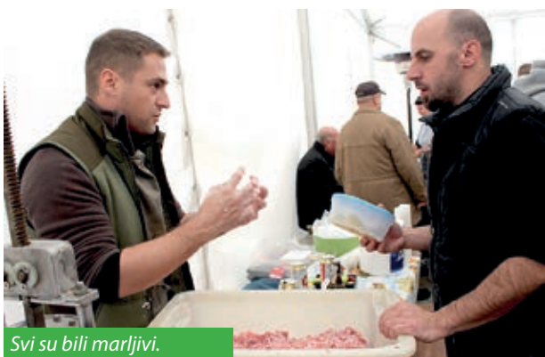
Svi su bili marljivi.