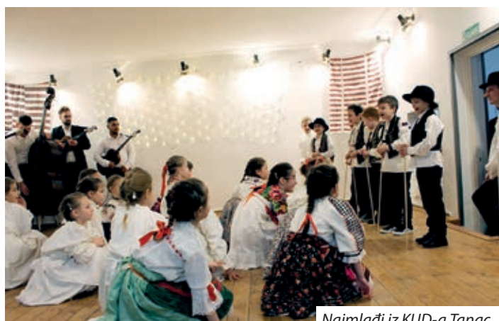
Najmlađi iz KUD-a Tanac