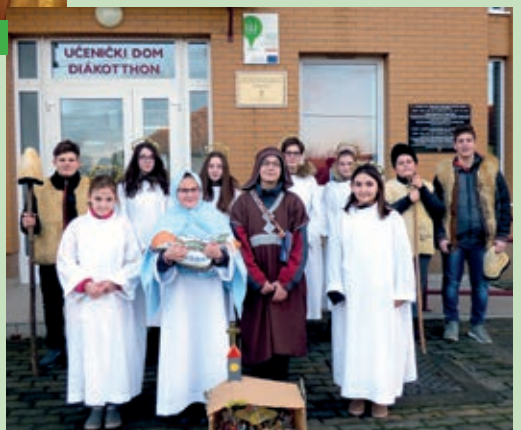
Betlehemari ispred učeničkog doma pred polazak