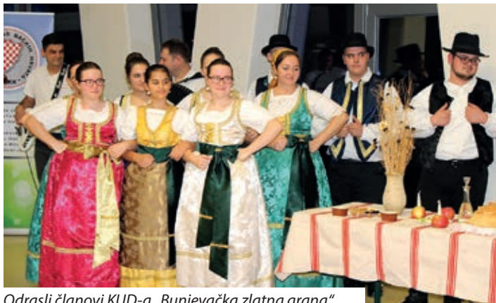
Odrasli članovi KUD-a „Bunjevačka zlatna grana“

Nakon programa gosti su dočekaeni narečenim tradicijskim blagdanskim jelima bunjevačkih Hrvata, nadalje dobrom kapljicom vina, ali suvenirima od slame i drugim koji su ponuđeni i na prodaju. U nastavku večeri druženje je nastavljeno uz garski Orkestar „Bačka“. Dodajmo da je pokrovitelj priredbe bila Gradska knjižnica „Endre Ady“.