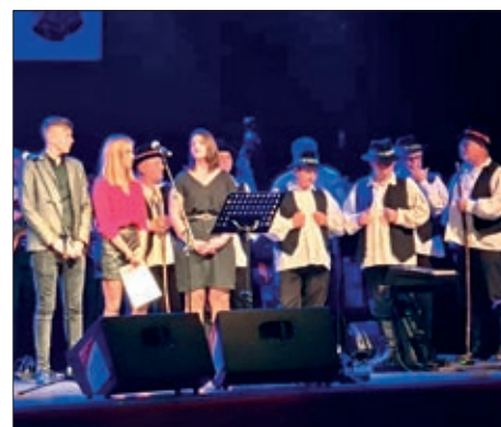
Druženje uz koncert Klape Iskon