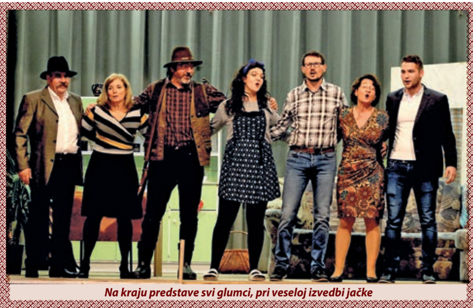
Na kraju predstave svi glumci, pri veseloj izvedbi jačke