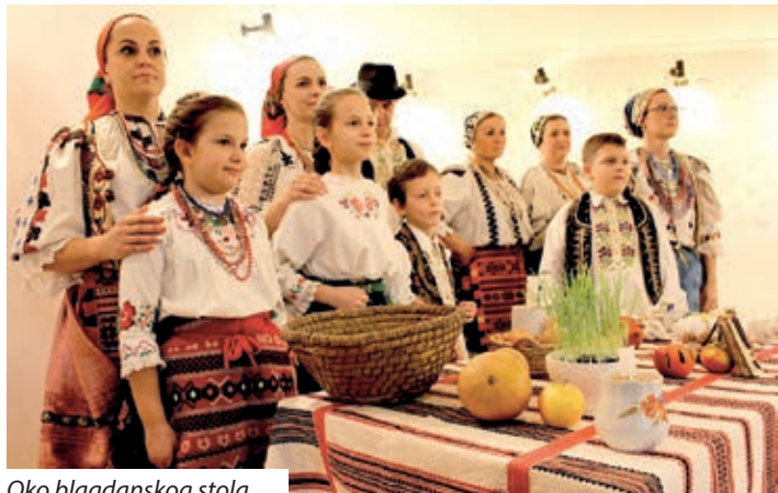
Oko blagdanskog stola

U organizaciji Hrvatske manjinske samouprave sela Kukinja, u tom je selcu 21. prosinca održana priredba pod nazivom „Radujte se, narodi“. Davno sam bila u Kukinju u takvom ozračju. Prepun dom kulture i prostor oko njega, mjesta ni za lijek. Brojni