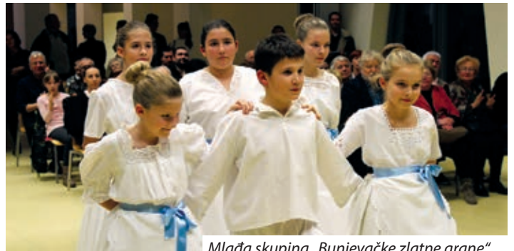
Mlađa skupina „Bunjevačke zlatne grane“