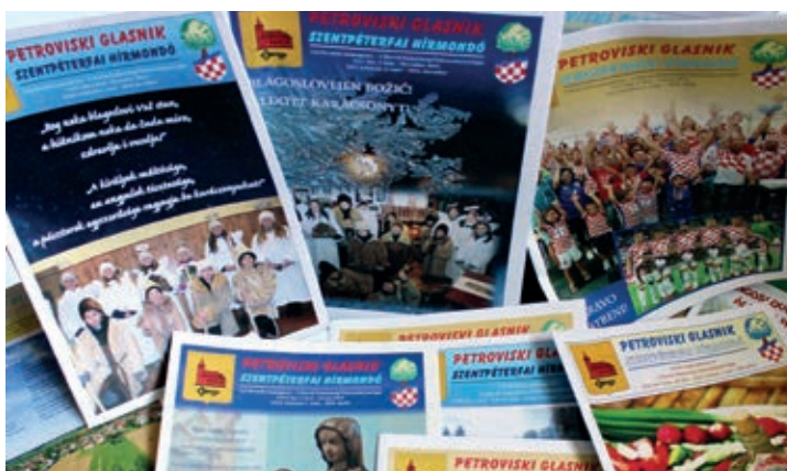
List Hrvatske samouprave Petrovoga Sela izlazi redovito jur 25 ljet dugo