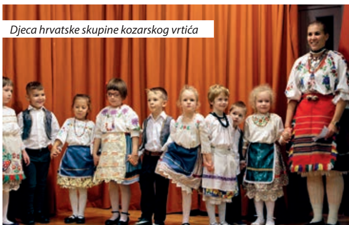
Djeca hrvatske skupine kozarskog vrtića