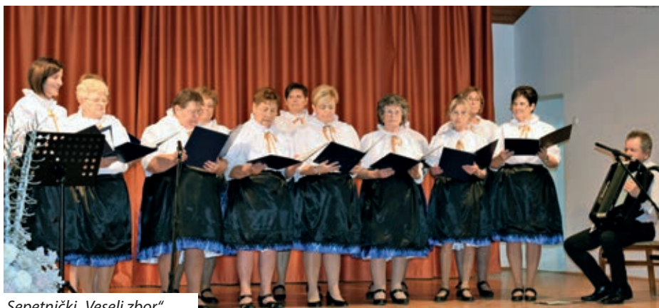
Sepetnički „Veseli zbor“