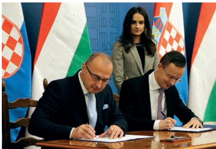
Hrvatsko-mađarska suradnja ojačana Sporazumom o suradnji diplomatskih akademija

Ministar vanjskih i europskih poslova Republike Hrvatske Gordan Grlić Radman boravio je u dvodnevnom posjetu Budimpešti, u sklopu kojeg je 13. prosinca 2019. predsjedao 93. sjednicom Dunavske komisije te se sastao s ministrom vanjske trgovine i vanjske politike Mađarske Péterom Szijjártóom. Nakon bilateralnog sastanka u Ministarstvu vanjske trgovine i vanjske politike dvojica su ministara održala konferenciju za medije.