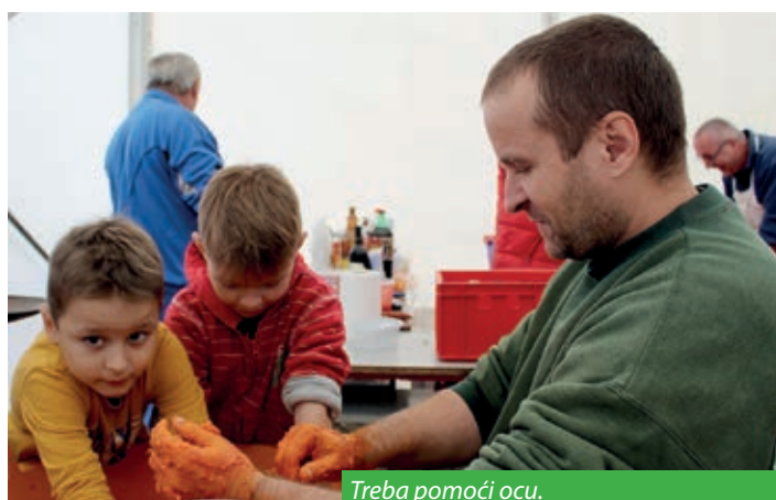
Treba pomoći ocu.