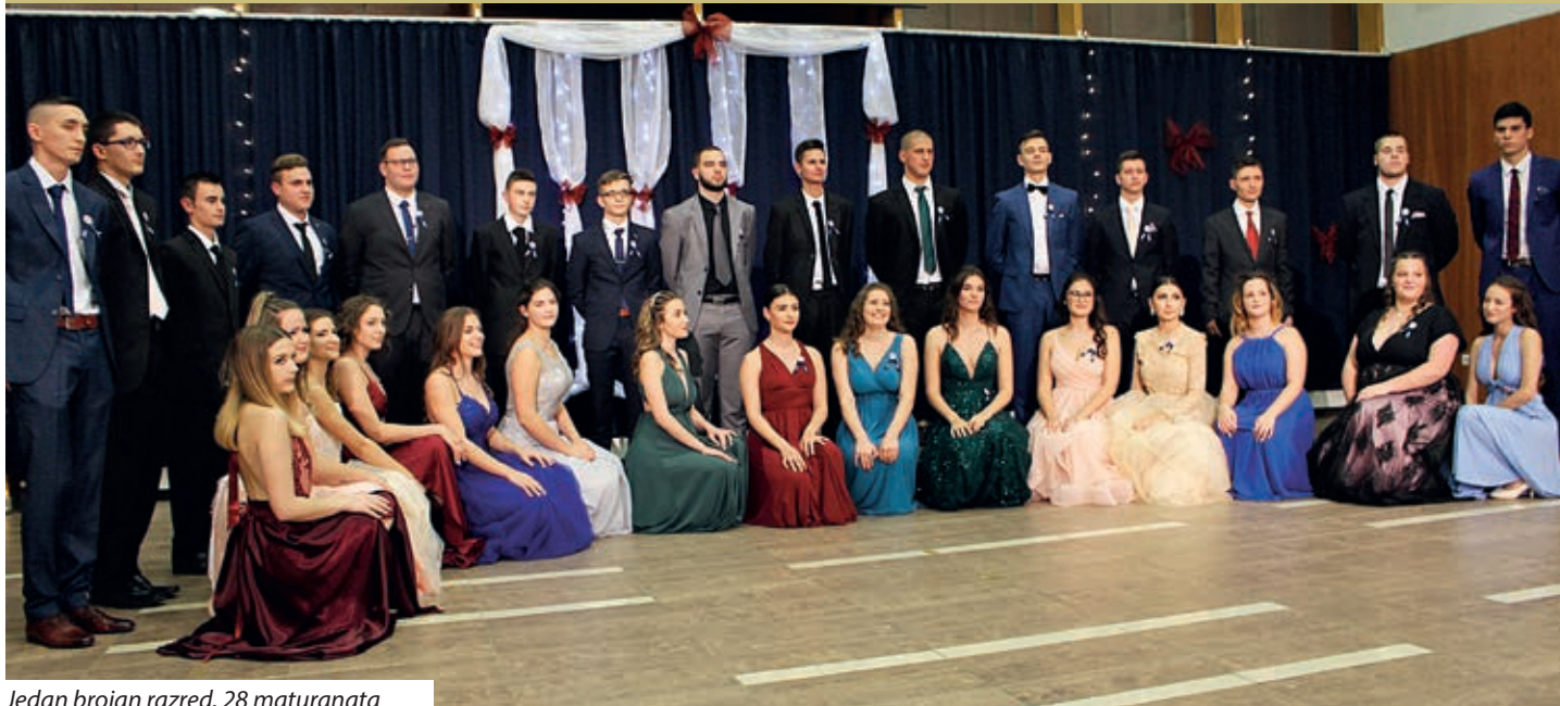
Jedan broj razred, 28 maturanata