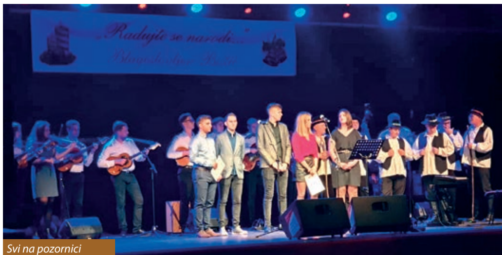
Svi na pozornici

U organizaciji Hrvatskoga kulturnog i sportskog centra „Josip Gujaš Džuretin“, hrvatskih mjesnih samouprava iz Podravine te civilne udruge Zajednice podravske Hrvata, 21. prosinca u HDS-ovoj ustanovi koja se nalazi u Martincima, Hrvatskome kulturnom i sportskom centru „Josip Gujaš Džuretin“, u njegovoj velikoj sportskoj dvorani priređena je već donekle uobičajena priredba pod nazivom Božićni koncert.