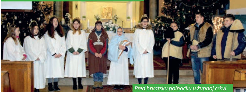
Pred hrvatsku polnočku u župnoj crkvi

Tradicijiski se običaj betlehemara u Santovu njeguje do naših dana. Nekada na Badnjak skupina dječaka, ministranata, odjevenih poput pastira u kožuhe i šubare, s pastirskim štapovima i jasicama od drveta sa Svetom obitelji, obilazila je hrvatske domove radosno navješćujući Isusovo rođenje s pastirskom igrom i božićnim pjesmama.