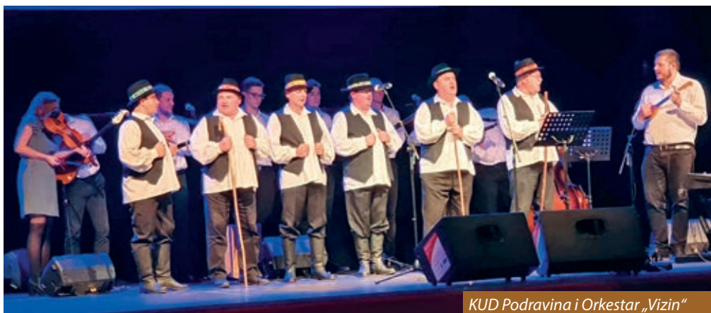
KUD Podravina i Orkestar „Vizin“

od nastupa mladih nadarenih pjevača i pjevačica, koji su svoju nadarenost višekratno pokazali na poznatome glazbenom festivalu MiCrofon u Petrovom Selu. Poslije prvog dijela programa slijedit će koncert poznate hrvatske Klape Iskon.