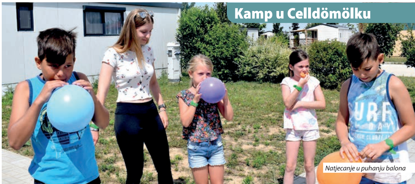
Natjecanje u puhanju balona

Udruga „Kulturno društvo Kerestur“ svako ljeto poziva osnovnoškolce i srednjoškolce u tematske kampove koji su posvećeni raznovrsnim područjima, od fotografiranja, biciklizma, tamburice i zdravog načina života do hrvatskog jezika. Ovogodišnji kamp posvećen hrvatskoj baštini i običajima priređen je između 13. i 17. srpnja u Celldömölku. Pored svakodnevnog kupanja sudionici su se u prijepodnevним satima bavili poviješću, glazbenom kulturom, tradicijom i običajima pomurskih Hrvata, a bilo je i radionica ručnog rada.