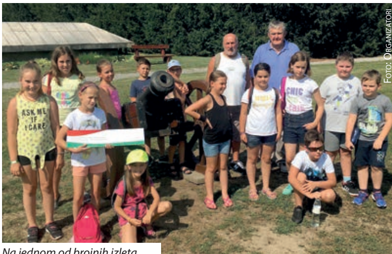
Na jednom od brojnih izleta