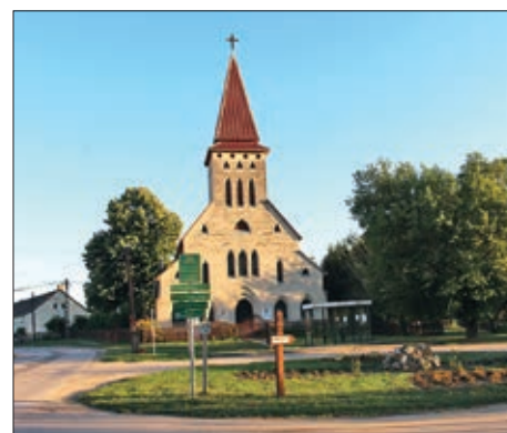
Starin, selo na obali Drave 12. stranica