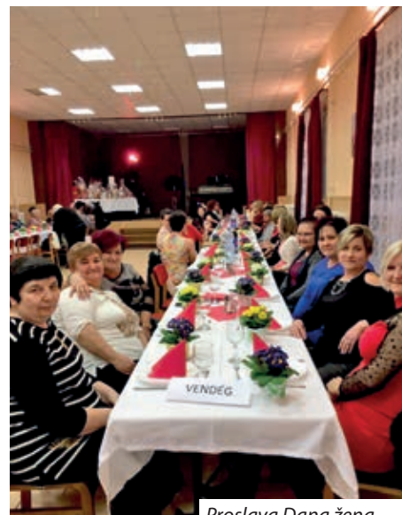
Proslava Dana žena

zgradu, zgradu samouprave i zgradu doma kulture ugrađen je solarni sustav, a obnovljeno je i pristanište na Dravi, u što je uloženo 23 milijuna forinti državne potpore. Samouprava Starina je kupila i preuredila postojeću zgradu kod pristaništa te uredila okoliš i pristanište. Natjecalo se kod brojnih, pa i EU fondova.