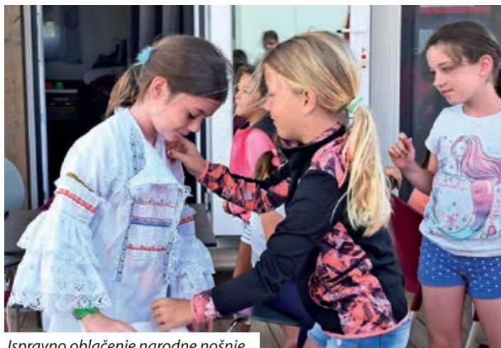
Ispravno oblačenje narodne nošnje

pomurske narodne nošnje, koja se trebala ispravno obući, rješavati križaljke, složiti mozaik naziva tjednika Hrvata u Mađarskoj i vješto riješiti zadaci spretnosti. Sve radionice odvijale su se na otvorenom, pa su djeca puno boravila na svježem zraku. Naravno, najviše im se sviđalo kupanje u društvu, plivačko natjecanje na bazenima, prskanje i skakanje u vodu, ali poseban doživljaj predstavljali su i sjedenje pred kućicom pod vedrim nebom u večernjim satima, razgovori, promatranje zvijezda, pričanje viceva i puno smijeha u dobrom društvu.