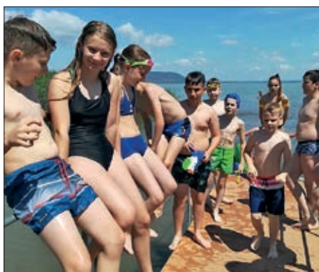
Dječji kamp Hrvatske samouprave VII. okruga 10. stranica