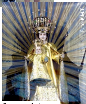
Gospa s malim Isusom