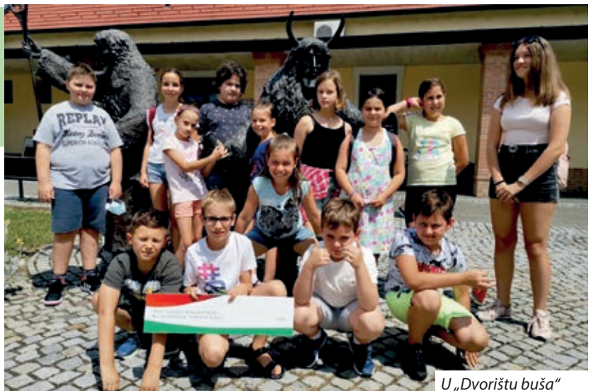
U „Dvorištu buša“