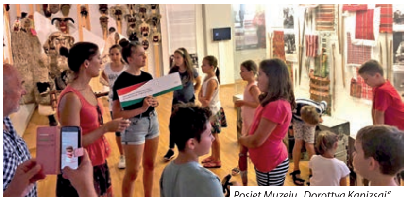
Posjet Muzeju „Dorottya Kanizsai“