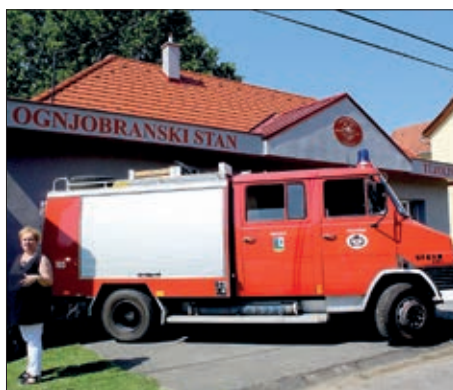
Djundje prisičke 11. stranica