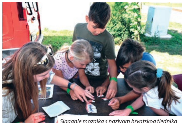
Slaganje mozaika s nazivom hrvatskog tjednika