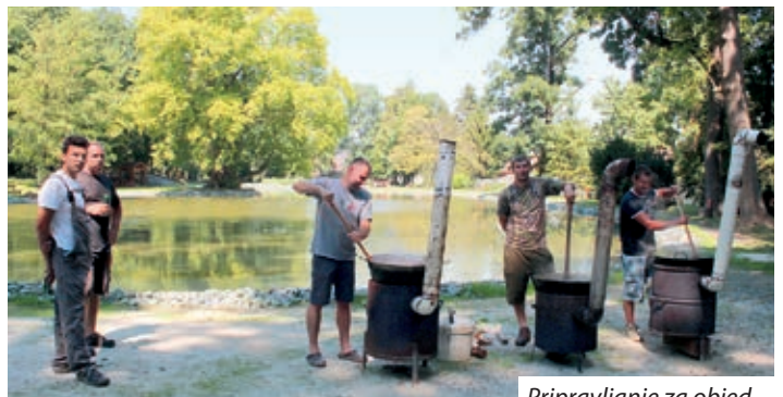
Pripravljanje za objed