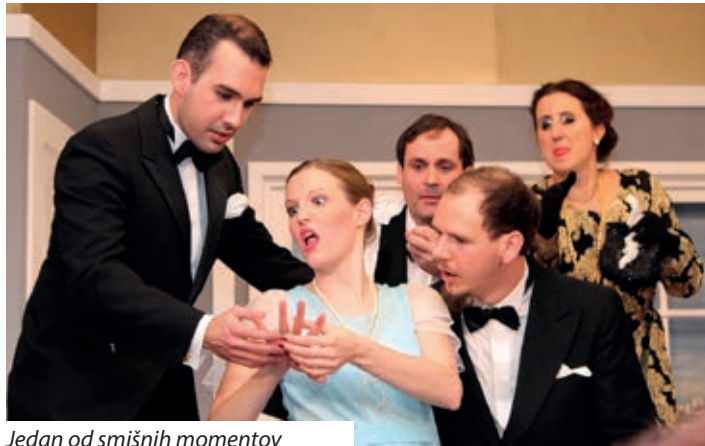
Jedan od smišnih momentov