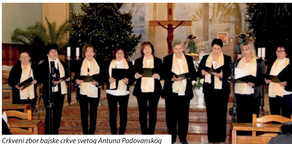
Crkveni zbor bajske crkve svetog Antuna Padovanskog