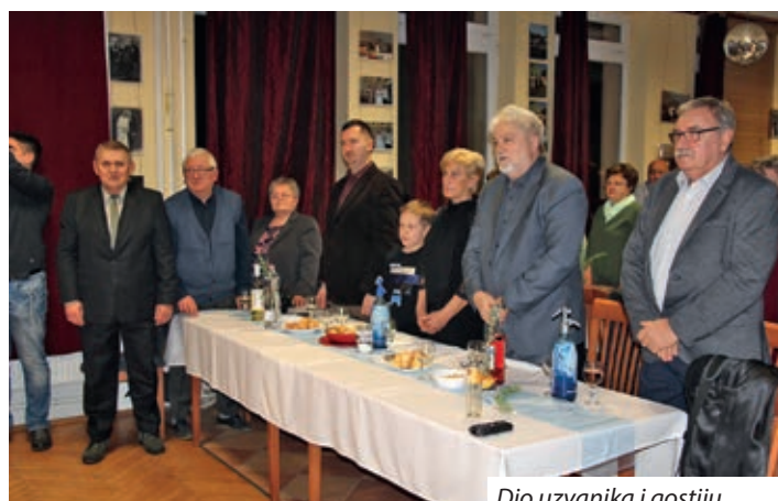
Dio uzvanika i gostiju