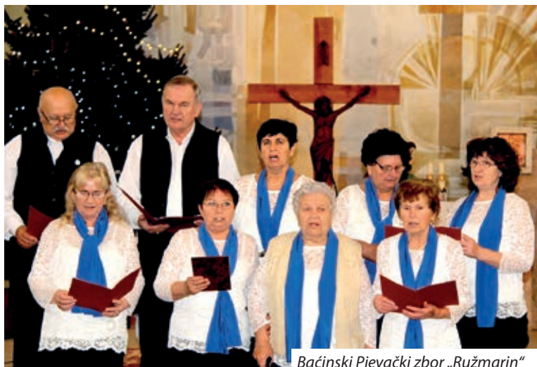
Bačinski Pjevački zbor „Ružmarin“