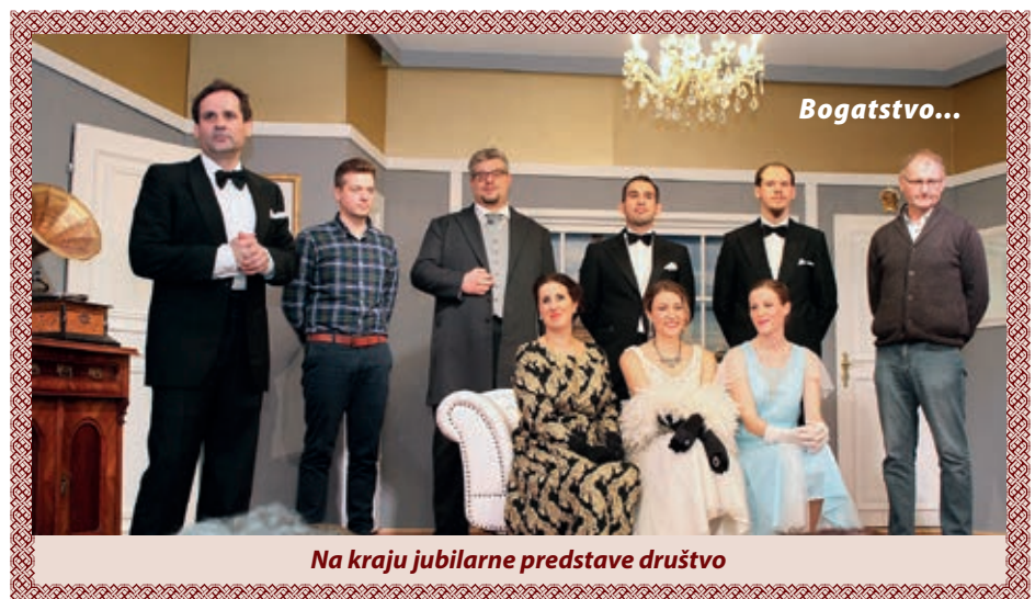
Na kraju jubilarne predstave društvo

liko ljet nevidjenja misli da pred njom stoji originalni Tito Mirelli. Kako izajti iz ove šlamastike, skokom blizu koncerta, da sve štima, svi budu zadovoljni i da i spektakl uspije i donese hasni? Pitanje je to menedžera koncertov ki u paniki je sklon izgubiti i glavu, ali svenek dojde rješenje i odlučni nastup rodjaka, zeta ki na kraju predstave med trimi tenori si najde vridno mjesto. Glumačka sedmica ne samo oduševi u ovoj predstavi nego i prikazuje svoju neutišivu i neminovnu ljubav prema igrokazanju i preskrajnu volju ter smisao za humor. Tenore je užitak slušati na koncertu, a u finalu još jednoč se predstavljaju najvažniji elementi komedije u trku. Gledališće prepuno, smih na licu, ovacije i burni aplauz su okrunili šest domaćih predstavov i jedan nastup u Beču. Ki nikako ne kani izostaviti filešku glazbenu i teatarsku atrakciju, ima zadnju šansu u Stinjake projti pogledati ov zvanaredni igrokaz, 29. februara, u subotu. Dame i gospodo, ovo je „koncert“ koji se jednostavno ne propušća... Tiho