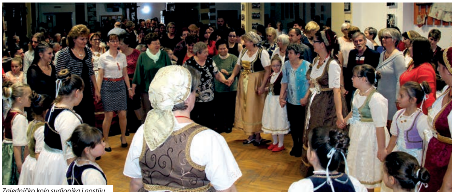
Zajedničko kolo sudionika i gostiju