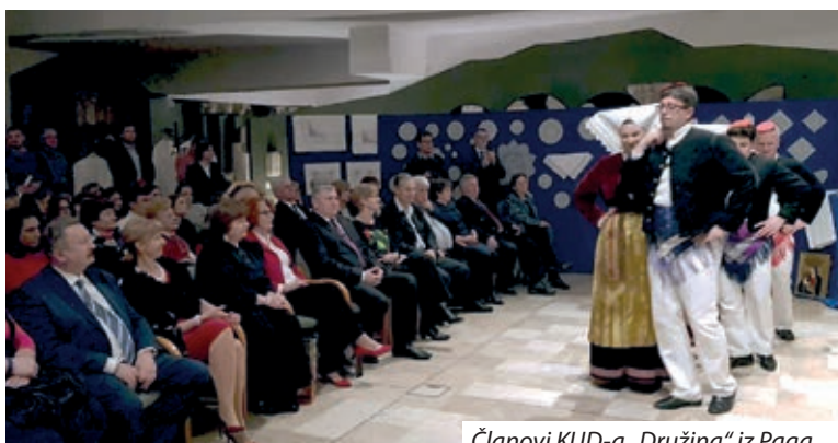
Članovi KUD-a „Družina“ iz Paga