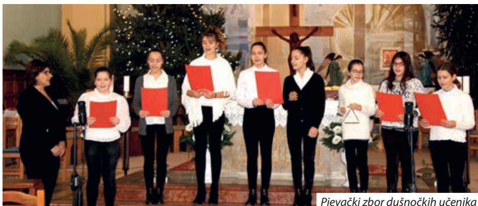
Pjevački zbor dušnočkih učenika

Misno slavlje u župnoj crkvi svetih Filipa i Jakova, kako je od samih početaka, i ove godine predvodio je santovački žup-