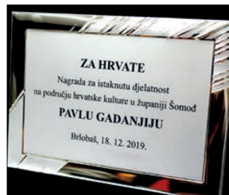
„Županijski dan Hrvata 2019“