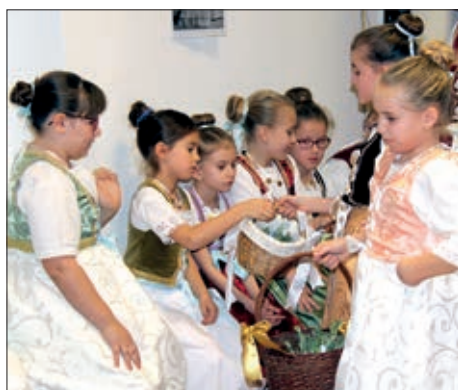
90. bunjevačko prelo u Čavolju