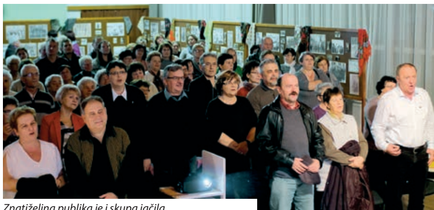
Znatilježna publika je i skupa jačila