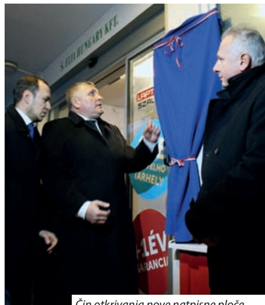
Čin otkrivanja nove natpisne ploče

Generalni konzulat Republike Hrvatske u Pečuhu, 14. siječnja priredio je otkrivanje nove natpisne ploče Generalnog konzulata Republike Hrvatske u Pečuhu, u povodu početka predsjedanja Republike Hrvatske Vijećem Europske unije i 28. obljetnice priznanja Republike Hrvatske.