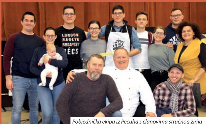
Pobjednička ekipa iz Pečuha s članovima stručnog žirija