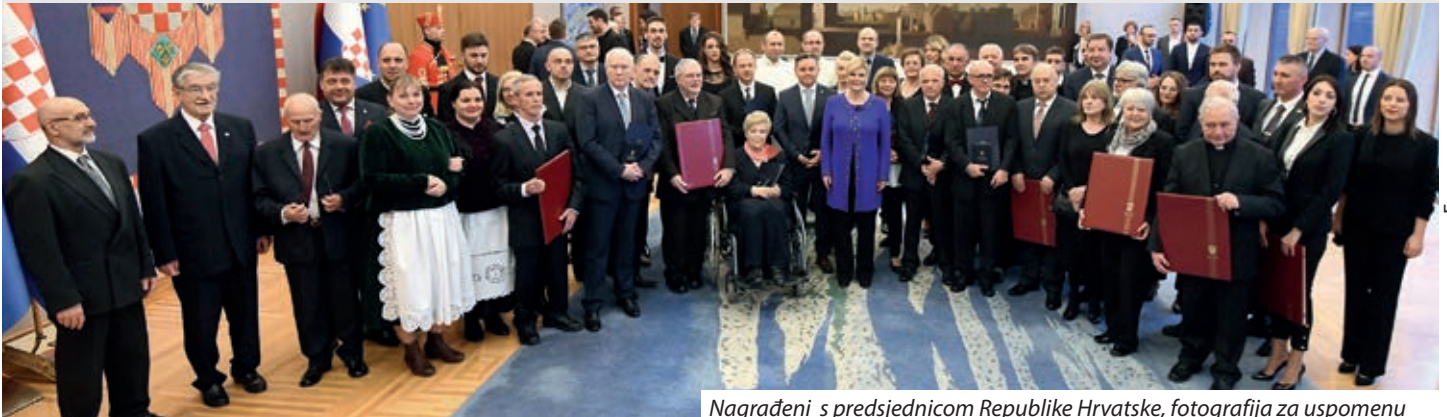
Nagrađeni s predsjednicom Republike Hrvatske, fotografija za uspomenu

Predsjednica Republike Hrvatske Kolinda Grabar-Kitarović dodijelila je 4. veljače 2020. u Predsjedničkim dvorima na Pantovčaku 29 odličja i 11 priznanja pojedincima, udrugama i ustanovama koji svojim radom pridonose očuvanju hrvatske kulture i identiteta te razvoju i ugledu Republike Hrvatske.