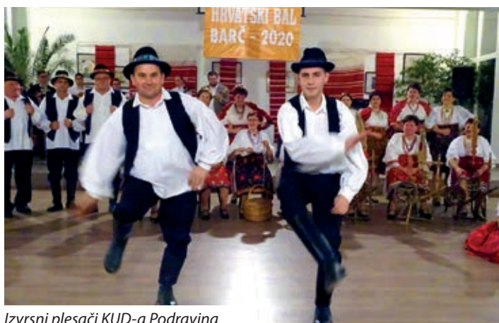
Izvršni plesači KUD-a Podravina