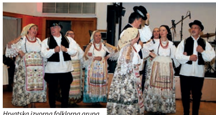
Hrvatska izvorna folklorna grupa