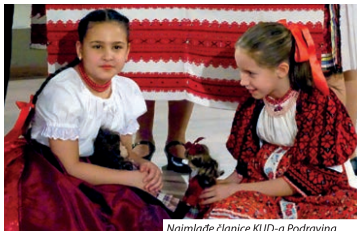
Najmlađe članice KUD-a Podravina