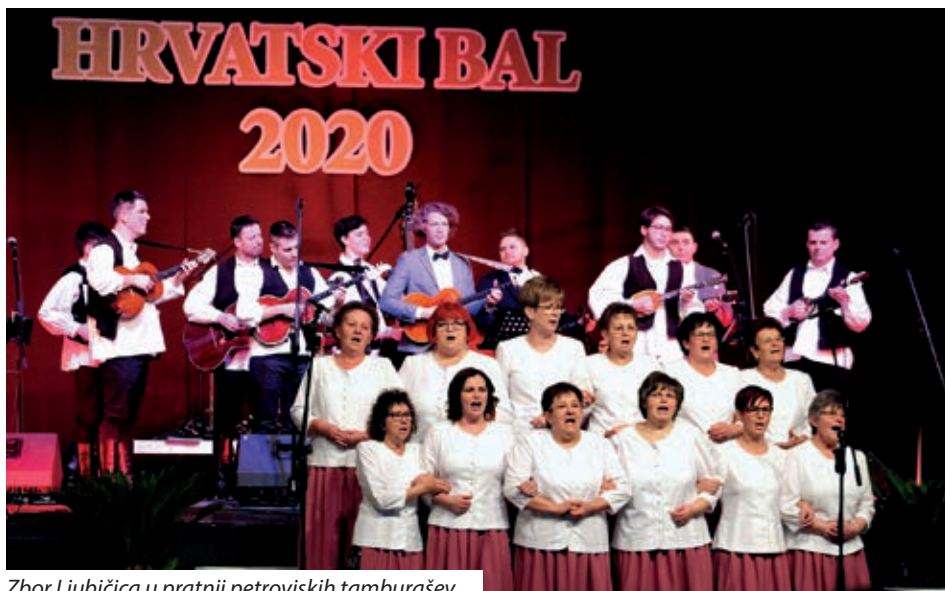
Zbor Ljubičica u pratnji petrovskih tamburašev