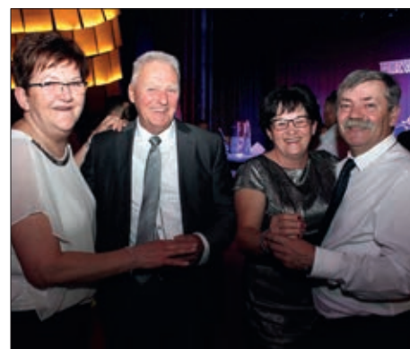
„Gizdav sam da sam Hrvat“