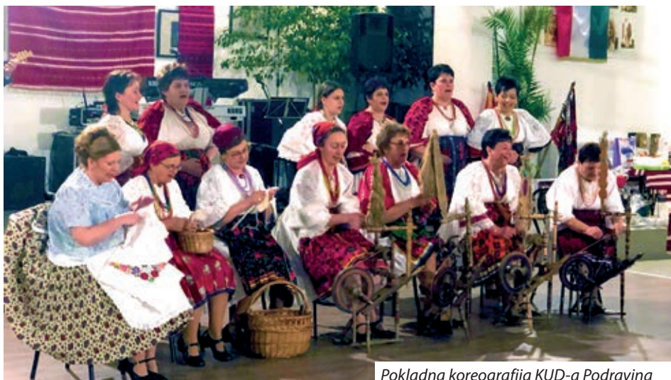
Pokladna koreografija KUD-a Podravina