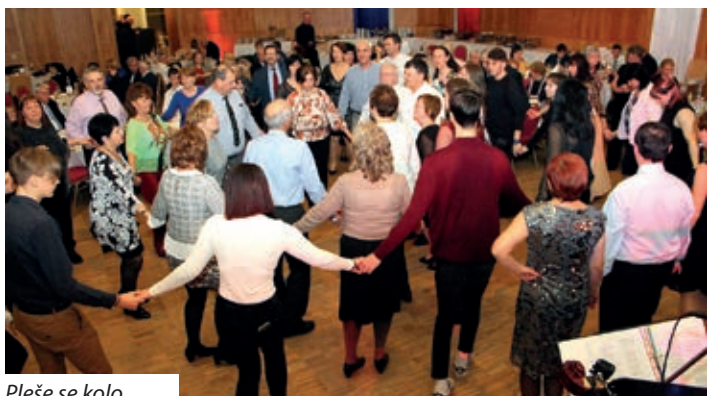
Pleše se kolo