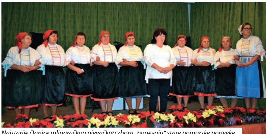
Najstarije članice mlinaračkog pjevačkog zbora „popevaju“ stare pomurske popevke

Hrvatska samouprava Mlinaraca krajem prošle godine obilježila je 50. obljetnicu postojanja KUD-a „Poleti paune“. Povodom obljetnice u domu kulture priređena je izložba fotografija i dokumentarne građe. Uzvanike – među kojima su se nalazili i članovi obitelji pokojnog osnivača i voditelja udruge, učitelja Joške Vlašića te bivši i današnji članovi - pozdravila je predsjednica Hrvatske samouprave Žuzana Kotnjek.