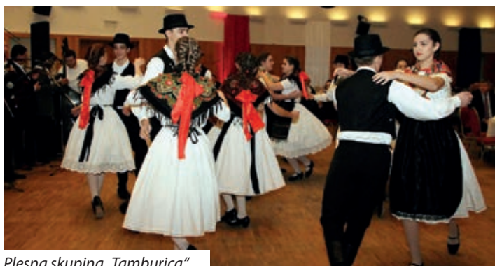
Plesna skupina „Tamburica“