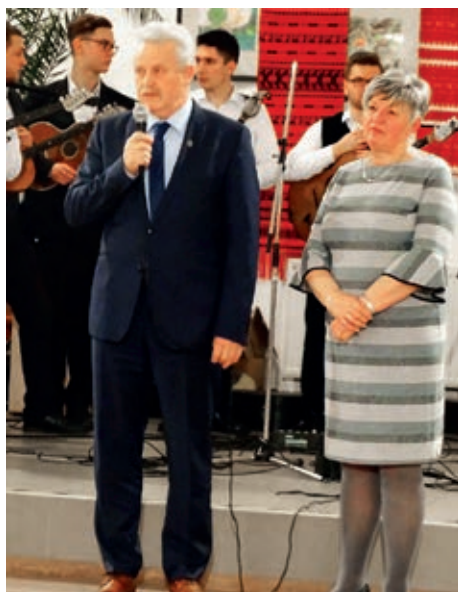
Nazočne je pozdravio i gradonačelnik Barča