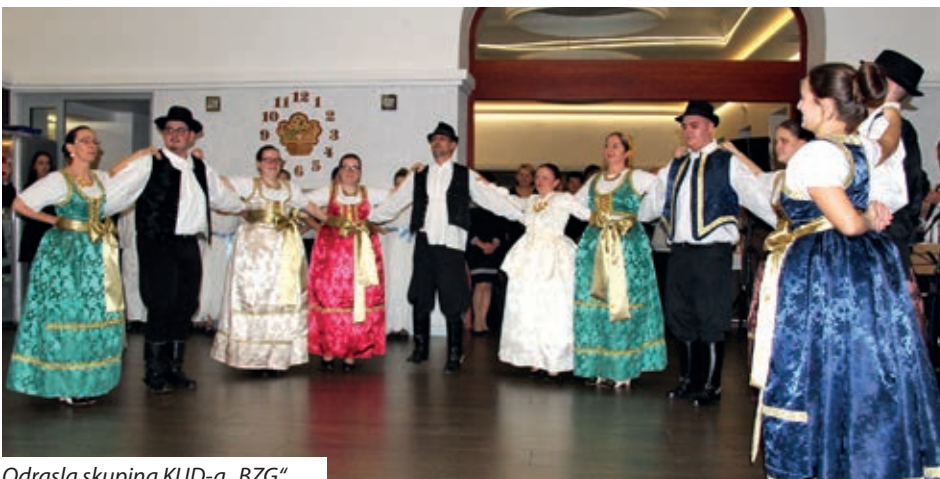
Odrasla skupina KUD-a „BZG“

izrazila zadovoljstvo što može prisustvovati pokladnoj zabavi bajske Hrvatske, naglasivši kako to za nju nije nikakva novost: ranije je živjela na Dolnjaku u blizini Čitaonice gdje se često slušala hrvatska glazba.