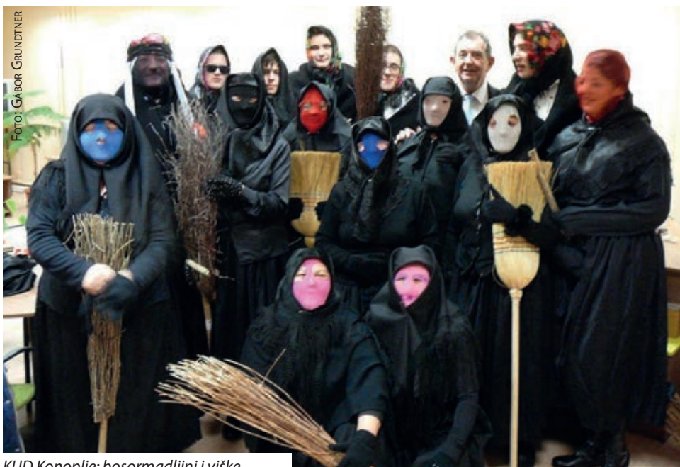
KUD Konoplje: bosormadljini i viške