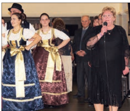
Veliko bajsko prelo