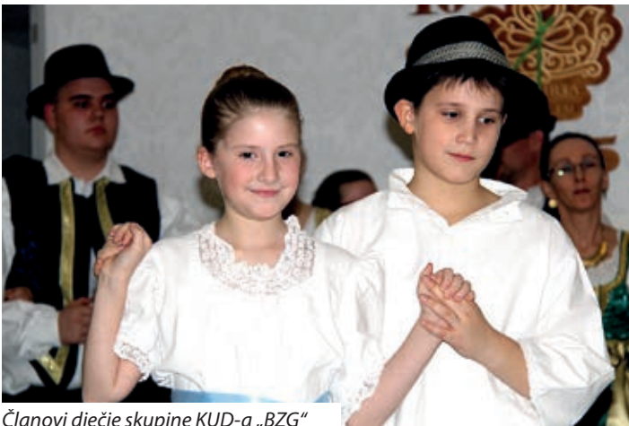
Članovi dječje skupine KUD-a „BZG“

čeri slavlju se pridružila i novoizabrana gradonačelnica Baje Klára Nyirati, koja je