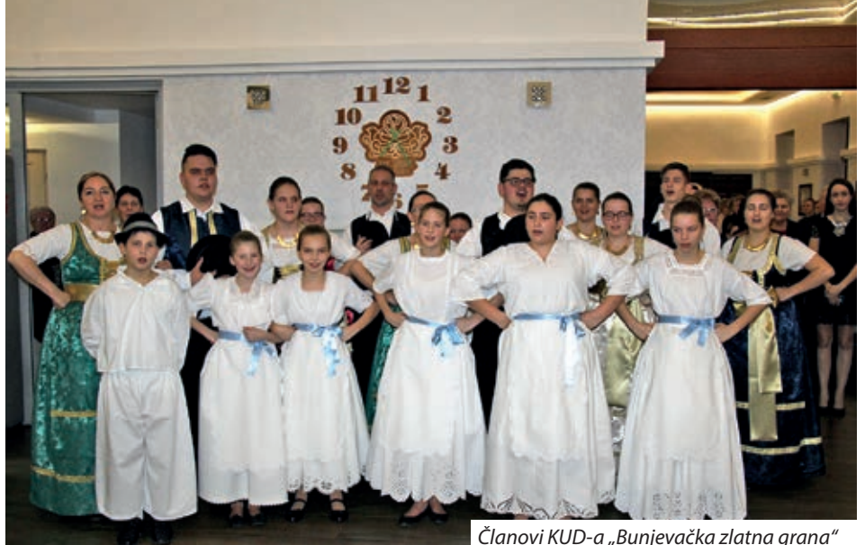
Članovi KUD-a „Bunjevačka zlatna grana“

Svojim prisustvom priredbu su uveličali predstavnici gradova prijatelja Labina, Biograda na Moru i Požege na čelu s gradonačelnicima, parlamentarni glasnogovornik Hrvata u Mađarskoj, čelnici Hrvatske državne samouprave i Saveza