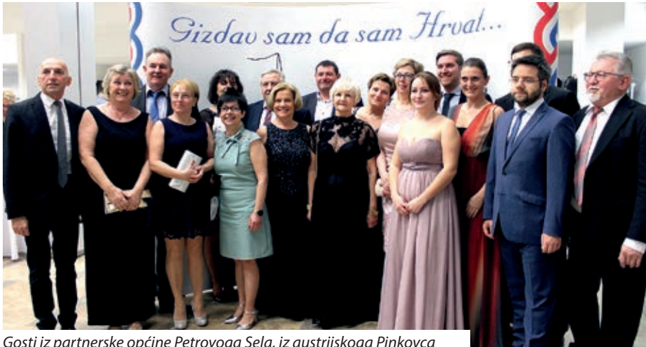
Gosti iz partnerske općine Petrovoga Sela, iz austrijskoga Pinkovca