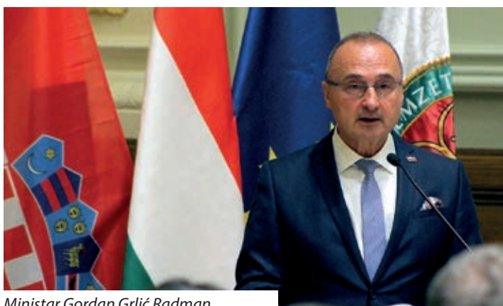
Ministar Gordan Grlić Radman

Ministar vanjskih i europskih poslova Republike Hrvatske Gordan Grlić Radman 12. prosinca 2019. imao je izlaganje u Institutu za strateške studije pri Nacionalnome sveučilištu javnih službi u Budimpešti, o prioritetima hrvatskog predsjedanja Vijećem Europske unije, od 1. siječnja 2020. godine. Njegovo su predavanje pratili predstavnici diplomatskih tijela pojedinih zemalja u Mađarskoj, bivši i sadašnji predstavnici mađarske vlade, profesori i studenti toga Sveučilišta. Potom je slijedila panel-rasprava, u kojoj su sudjelovali: ministrica pravosuđa Mađarske Judit Varga, bivši povjerenik Europske komisije Tibor Navracics, mađarski veleposlanik u Berlinu Péter Györkös, a moderator susreta bio je ravnatelj Instituta za strateške studije Gergely Pröhle.