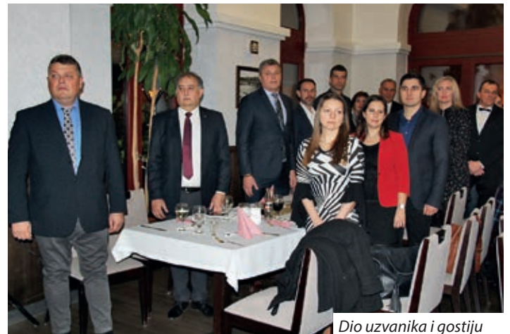
Dio uzvanika i gostiju