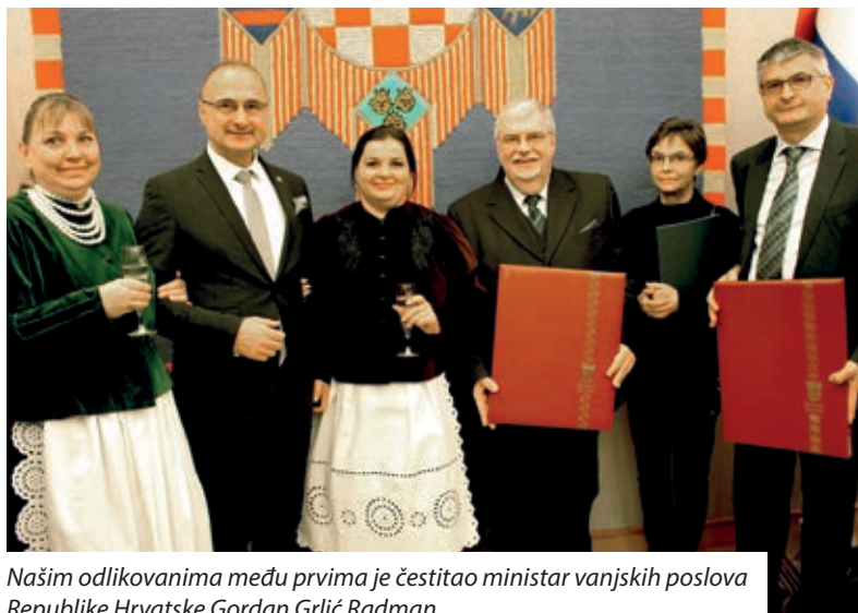
Našim odlikovanima među prvima je čestitao ministar vanjskih poslova Republike Hrvatske Gordan Grlić Radman