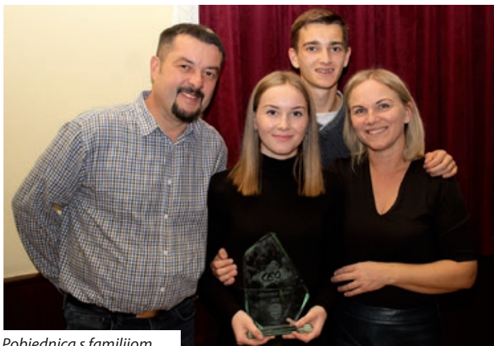
Pobjednica s familijom