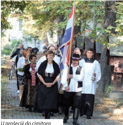
U prošeciji do cimitora