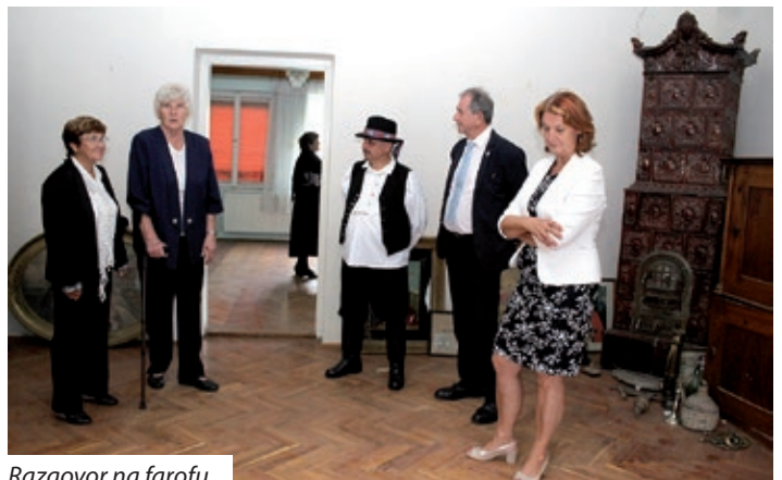
Razgovor na farofu

tako misli načelnica sela. Ako bude gotov, u Kemlji će ovo biti jur peti društveni stan. „U popovskom vrtu smo otprli novu ulicu, ovde će se proširiti Ognjobranski dom, grunti su jur prodani, a na dvoru farofa moć će održati čitalačke tabore, festivale i kulturne priredbe, ali nije isključeno da će se izgraditi i dom za hodočasnike. Moramo dati procjeniti stanje same zgrade, pogledati zašto pucaju stijene. Ako budemo imali konačne plane, moramo još iskati financijske izvore. Po prethodnom šacanju ova investicija stat će kih 50 milijun Ft i onda još nisam čuda rekla. Optimistična sam, tako mislim da za dvi-tri ljeti novi društveni dom će stati ovde“, dodala je još odlučna liktarica Kemlje. Tiho