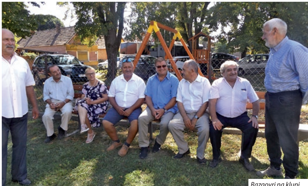
Razgovri na klupi

Dan raseljenih Križevčana održan je uz Križevo, bučuru Križevaca – naime, svetom Križu posve-