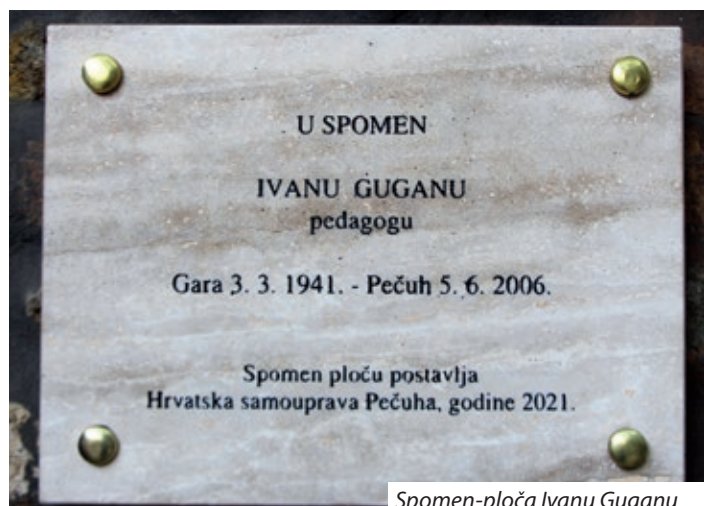
Spomen-ploča Ivanu Guganu