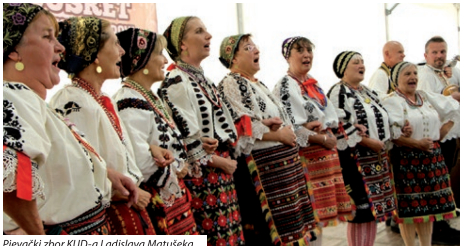
Pjevački zbor KUD-a Ladislava Matuška

U organizaciji Hrvatske samouprave Harkanja 25. rujna u Harkanju, u Osnovnoj i glazbenoj školi „Pál Kitaibel” održan je II. Susret hrvatskih zborova