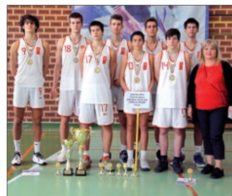
Košarkaški turnir „Dražen Petrović“ 10. stranica