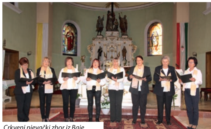
Crkveni pjevački zbor iz Baje

nije pozvan hrvatski svećenik iz susjedne Vojvodine misno slavlje na mađarskom jeziku služio je aljmaški župnik Zsolt Huszák, a hrvatskim pjesmama uljepšao aljmaški crkveni pjevački zbor.