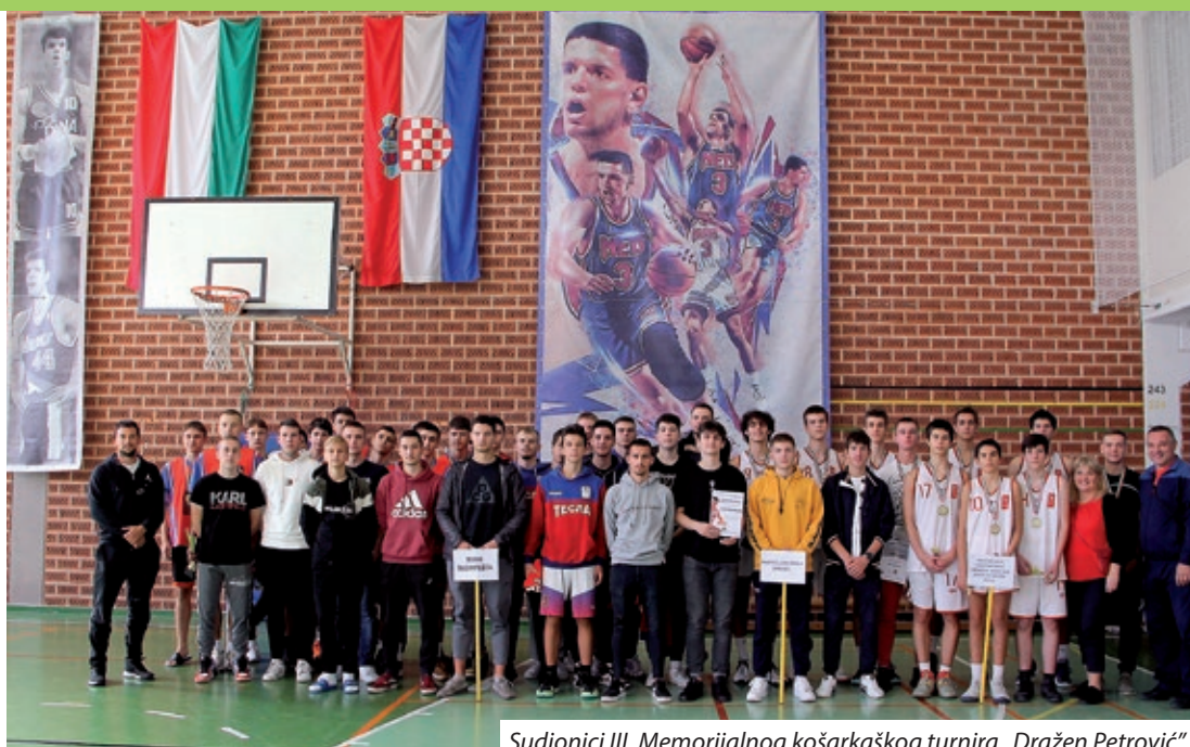
Sudionici III. Memorijalnog košarkaškog turnira „Dražen Petrović“

Tih dana svaki je školski kutak predstavljao životni put Dražena Petrovića. Naime, u auli je postavljena prigodna izložba, a na svečanom otvorenju turnira Hošigovci su izveli kazališni igrokaz o karijeri i čudesnim potezima tog košarkaškog Mozarta, a djevojke su otplesale ritmični ples, jačajući navijački duh. Okupljenima se obratila ravnateljica škole Ana Gojtan, koja je pozdravljajući sve nazočne, među ostalim veleposlanika Republike Hrvatske u Mađarskoj Mladena Andrića, konzulicu Mađarske u Splitu Anu Mladenović, predsjednika Hrvatske samouprave Budimpešte Stipana Đurića i predsjednika HOŠIG-ove Zaklade za hrvatsku prosvjetu i kulturu Ladislava Romca naglasila kako sport ima važnu ulogu u izgradnji osobnosti i u njemu se mogu razvijati ljudske vrline poput hrabrosti, marljivosti, predanosti, istrajnosti i požrtvornosti. „Sportska događanja i druženja također povezuju mlade, daju im poticaj za njegovanje identiteta i jačanje zajedništva. Pored hrvatskog materinskog jezika, kultura i sport predstavljaju most koji nas povezuje s matičnom domovinom“, istaknula je ravnateljica Gojtan. U svom prigodnom govoru hrvatski veleposlanik Mladen Andrić pozdravio je sve sudionike, naglasivši kako prisutnost Škole košarke „Dražen Petrović“ iz Šibenika i Graditeljske škole Čakovec predstavlja mogućnost i