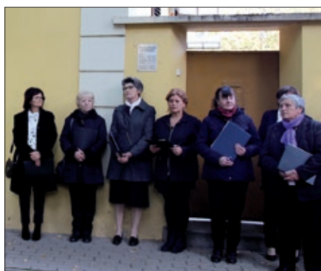
Spomendan biskupa Ivana Antunovića 6. stranica