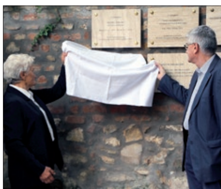
Spomen ploča Ivanu Guganu 8. – 9. stranica