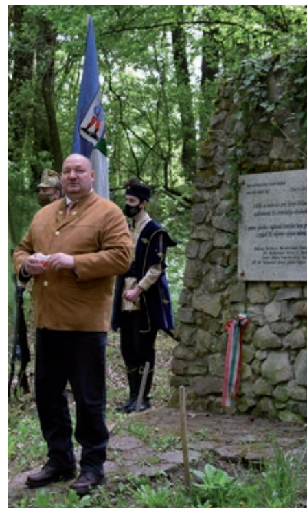
Državni tajnik Szilárd Németh govori o proglašenju mjesta nacionalnim spomen-parkom