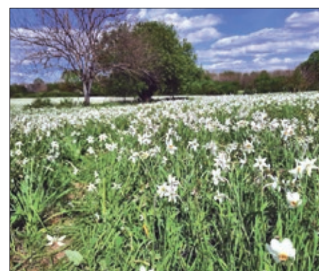
Bobovečki Pašin vrt