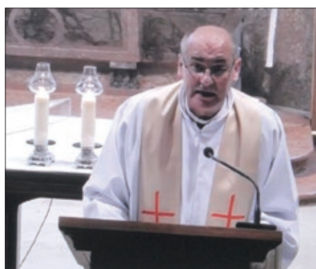
Jursko shodišće u online-formatu