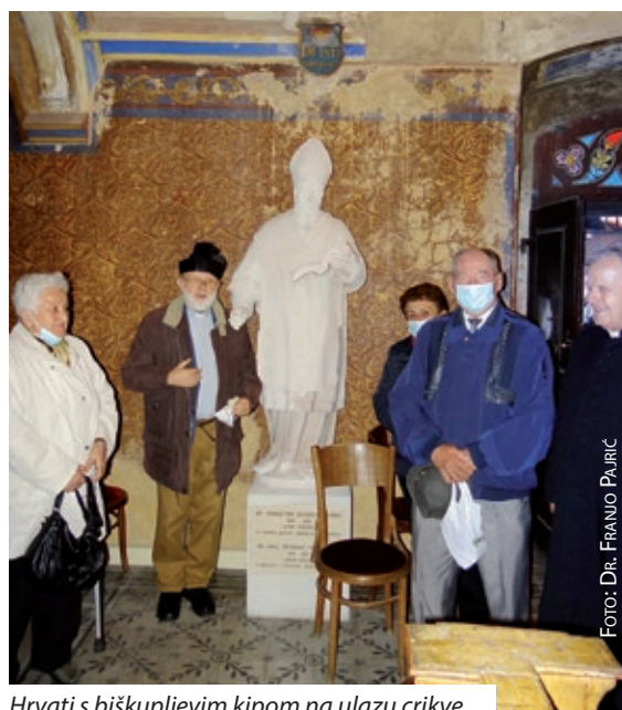
Hrvati s biskupljevim kipom na ulazu crikve