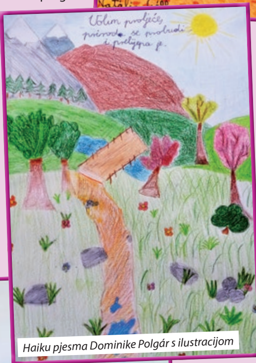
Haiku pjesma Dominike Polgár s ilustracijom

Krleži, 4 video uratka o Miroslavu Krleži, 9 eseja o hrvatskim spomenicima i jedan rad o pogreškama u medijima, dok je na online kvizu sudjelovalo 56 učenika. Organizatori se i ovim putem zahvaljuju svim sudionicima natjecanja i njihovim nastavnicima koji su doprinijeli da natjecanje bude uspješno, odnosno sponzorima koji su omogućili da sudionici Krležijade budu nagrađeni vrijednim nagradama. Koliko su djeca hrvatskih škola kreativna i spretna u stvaranju na hrvatskome jeziku u raznim žanrovima moći ćete se uvjeriti i sami, naime, najuspješnije radove ćemo objaviti na našoj „Maloj stranici“ u nadi da će se mali čitatelji ohrabriti i češće slati svoje radove za našu dječju stranicu, na zadovoljstvo svih čitatelja Hrvatskog glasnik.