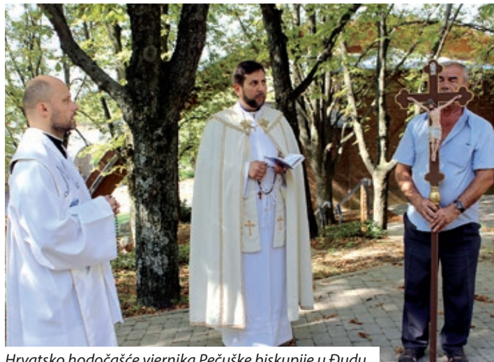
Hrvatsko hodočašće vjernika Pečuške biskupije u Đudu

– Tako je. Uostalom, sva potrebna sredstva i pomagala imamo, jer smo uz pomoć Đakovačke nadbiskupije nabavili sve liturgijske i obredne knjige te ih možemo osigurati svim svećenicima koji žele sudjelovati u pastorizaciji na hrvatskom jeziku. I za obrede krštenja, ukopa, i misne knjige, čitanja i molitve vjernika. Bilo tko ima bilo kakve potrebe, i to je zadaća hrvatske referature, može tražiti, i ako je potrebno obratit ćemo se za pomoć crkvenim vlastima u matičnoj zemlji. Ono što je uz nedostatak svećenika problem, to je nedostatak kantora, jer u malim naseljima gdje žive Hrvati, ako i nisu Hrvati, tamošnji kantori su naučili hrvatske pjesme koje se tamo pjevaju. Međutim, na većim priredbama, i na umjetničkoj razini nemamo kantora koji bi mogli udovoljiti našim potrebama. Među planovima imam, vjerujem da će i preuzvišeni biskup poduprijeti moju ideju, ako nađemo odgovarajuću osobu, onda ćemo podupirati i njezino školovanje u Hrvatskoj, jer postoji potreba.