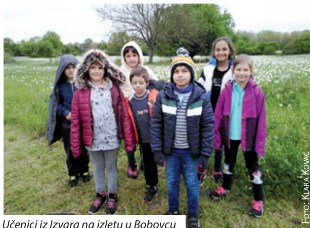
Učenici iz Izvara na izletu u Bobovcu

Jeste li znali kako u bobovečkom Pašinom vrtu krajem travnja i početkom svibnja cvjetaju milijuni strukova narcisa? Babócsa (Bobovec) je naselje u južnoj Mađarskoj, u Šomođskoj županiji. Nalazi se u blizini podravskih naselja koja su u povijesti naseljavali Hrvati, kao što su Bojevo, Rasinje, malo dalje Izvar, a nije daleko ni Csokonyavisonta, niti sam grad Barč. Zasigurno su i u Bobovcu nekada živjeli Hrvati. Nedaleko od ovog naselja, danas u sastavu Barčanske mikroregije, kroz koje prolazi i željeznička pruga je bobovečki Pašin vrt, koji se prostire na nešto više od trinaest hektara. Za njega iskreno nisam znala sve dok me na polje narcisa nedavno nije upozorila moja poznanica, a potom su se s mrežnih strani-