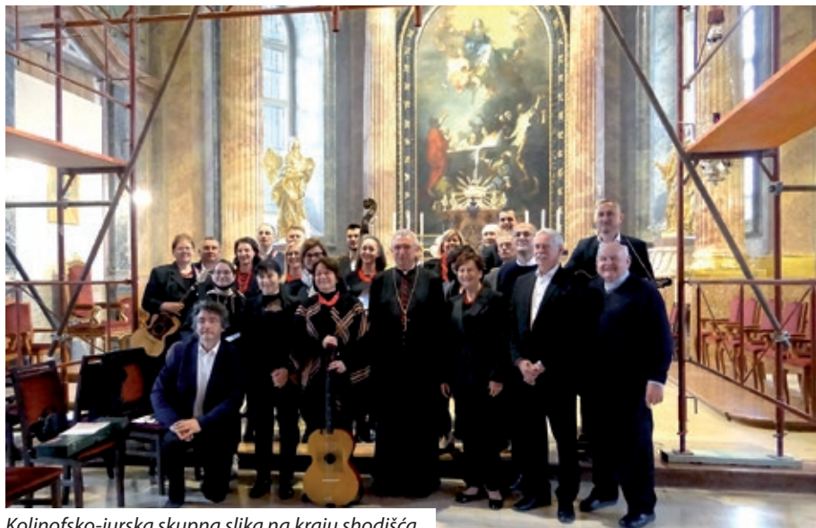
Koljnofsko-jurska skupna slika na kraju shodišća