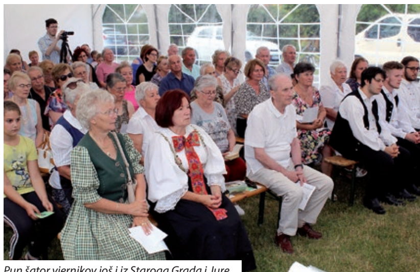
Pun šator vjernikov još i iz Staroga Grada i Jure