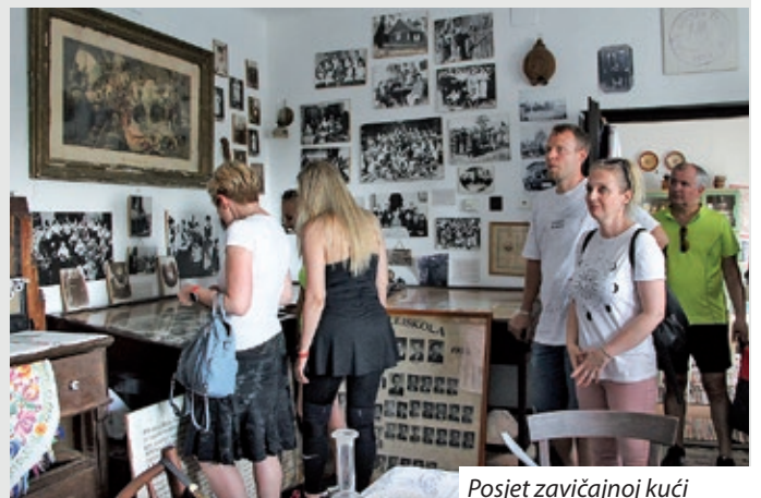
Posjet zavičajnoj kući