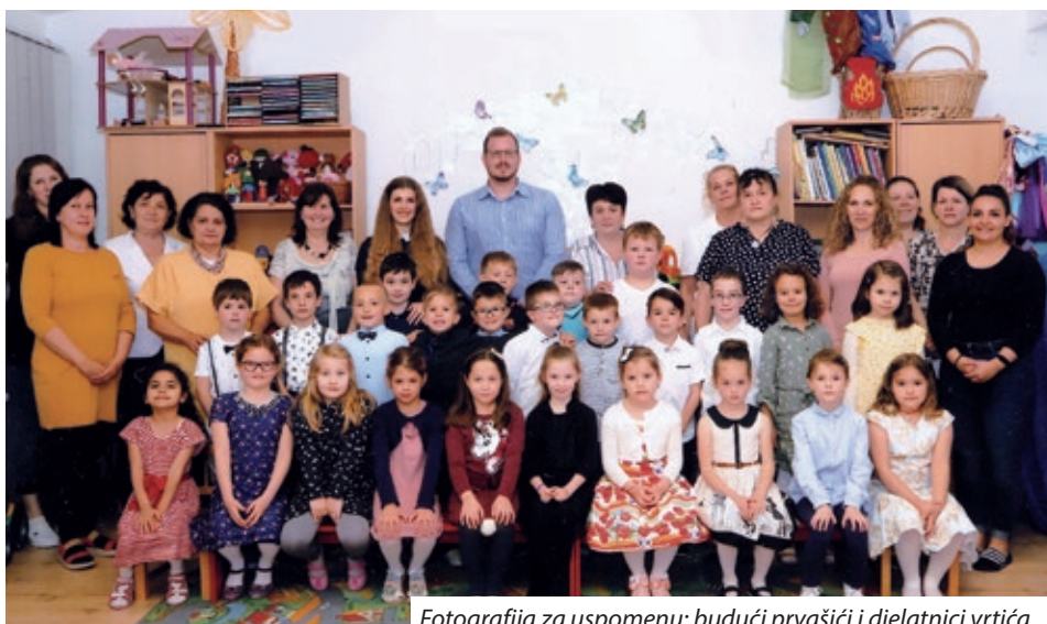
Fotografija za uspomenu: budući prvaci i djelatnici vrtića