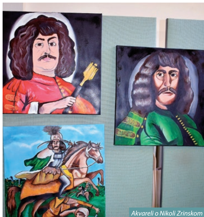
Akvareli o Nikoli Zrinskom