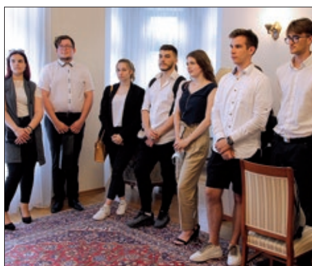
Prijem za maturante HOŠIG-a