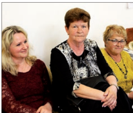
Koordinacijski sastanak u Pečuhu