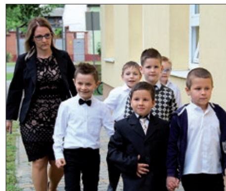
U Santovačkom vrtiću