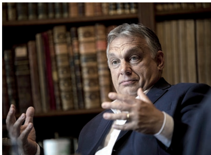
PREDSEDNIK MAĐARSKE VLADE VIKTOR ORBÁN

– Ne možemo još govoriti o preporodu, iako se mnogo toga promijenilo. I duhovnost države uvelike se promijenila. Život se cijeni puno više, ali još ne dobiva potpuno poštovanje. Postoje pažnja i zainteresiranost prema poruci Crkve i Boga, ali nema masovnih obraćenja. Mogu reći da do preporoda nije došlo, ali smo u puno boljem stanju u odnosu na ono što je bilo te je šansa za preporod danas veća nego prije 30 godina. Međutim, u kvantitativnom smislu ne možemo govoriti o masovnom obraćenju niti o novoj duhovnosti jer Mađarska je još uvijek najvećim dijelom sekularizirana država, koja traži put k Bogu, traži oslonce na tom putu. Poljski papa znao je i političko izbavljenje, jer izbavljenje je čin slobode, on nam je donio to izbavljenje u političkom smislu. Smatramo da se ne bismo riješili komunista da nismo imali poljskoga papu. Možemo biti vjernici ili ne, ali poljskoga