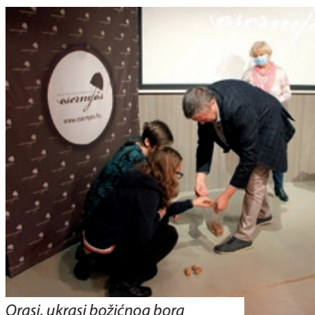
Orasi, ukrasi božićnog bora

što je pojašnjena njihova uloga u božićnom ciklusu stavljali na vremensku crtu, to jest komad špage. Blagdan svete Kate (25. studenog) je po pučkom vjerovanju početak došašća, adventa. Od tog dana zabranjene su svadbe i veselja, a u pučkom kalendaru označava posljednji dan jeseni i početak zime. Iz „čarobne kutije“ vadili su se orasi i jabuke, plodovi s kojima se nekada ukrašavao božićni bor, a našli su se i na blagdanskome stolu, te pšenica koja se sije na dan svete Lucije. Prema narodnom vjerovanju ovisno o izgledu iznikle pšenice saznat će se kakva će biti žetva iduće godine. Iznikla pšenica također je na blagdanskome stolu, naime, po sredini se stavila svijeća koja se zapalila na Badnjak. Za svetu Luciju vezuje se još i predbožićno proricanje o budućim muževima. Naravno, neizostavni božićni običaj su betlemari, tj. tradicijski božićni ophod, kada skupina dječaka odjevenih u kožuhe poput pastira s pastirskim štapom nosi jaslince sa Svetom obitelji. Obilaze selo na Badnju večer ili koji dan poslije pjevajući božićne pjesme, za što su ih ukućani darivaju. Publika je doista uživala u predavanju dr. Šandora Horvata, koje ih je vratilo u djetinjstvo, nizale su se uspomene i priče.