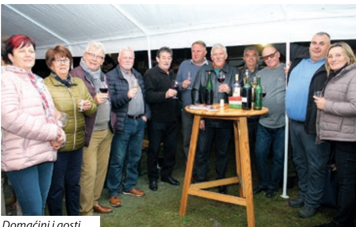
Domaćini i gosti