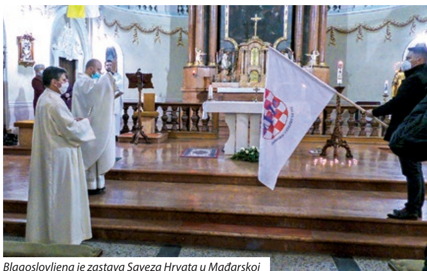
Blagoslovljena je zastava Saveza Hrvata u Mađarskoj