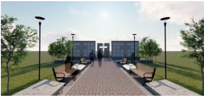
Izgradnja i uređivanje zida za urne na mjesnom groblju-idejni projekt

godine nastaviti će se s drugom fazom, a u planu je i odavno potrebna izrada digitalnog registra goblja. Iz potpore od 15 milijuna forinti Srpska pravoslavna parohija može izvesti naknadnu izolaciju zidova tehnikom rezanja, odnosno riješiti problem odvoda oborinskih voda. Državna udruga šokačkih Hrvata za dvije godine za 13 milijuna forinti uspjela je kupiti i obnoviti nekadašnju vlastelinsku zgradu na Trgu Alkotmány, koja je stara preko 300 godina. U bivšem Seoskom domu smjestit će se društvene prostorije, likovna zbirka i umjetnine. Osim toga Mjesna je samouprava za milijun forinti uspjela vratiti u svoje vlasništvo zgradu budžacke škole. U suradnji s mjesnim poljoprivrednicima osnovana je udruga za održavanje priselskih i poljoprivrednih cesta, a udruga je za kupnju nekretnine sjedišta i godišnji rad dobila 6 milijuna forinti. Potporom Fonda „Gábor Bethlen“ i Programa „Déryné“ iznosom od 2 milijuna forinti pojačana je suradnja s prijateljskim naseljem Kupusinom i na zavidnoj razini održan niz kulturnih priredbi.