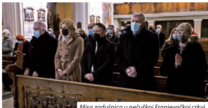
Misa zadušnica u pečuškoj Franjevačkoj crkvi

U svom govoru Ostrogonac se osvrnuo na protekle godine. „Dana 2. i 3. studenoga 1990. godine sa svih strana države gdje obitava hrvatska zajednica u Sambotelu se okupilo sto pedesetak zastupnika, koji su nakon dugih rasprava, usuglašavanja i kompromisnoga rješenja donijeli odluku o osnutku prve hrvatske organizacije s državnim djelokrugom. Dogodilo se sve to u ushićenome ozračju 1989.-90., tada, kada je Hrvatska učinila