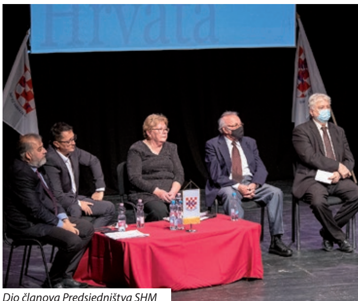
Dio članova Predsjedništva SHM

prve korake ka samostalnosti. Savez je tijekom tridesetogodišnjeg postojanja preživio mnogobrojne strukturne promjene. Zajedništvo, udruženje regija nije bila niti je laka Savezova zadaća. Česte su bile nesuglasice i konfliktna situacije koje su narušavale Savezovo zajedništvo i njegov opstanak. Ali nesuglasice smo uspjeli ublažiti i smjestiti u pozadinu promišljenim kompromisom, ljudskim pristupom, osnovnim načelima demokracije i zrelim razmišljanjem. Valjda i zbog toga mađarska i hrvatska politička elita Hrvate u Mađarskoj smatra najbolje organiziranom narodnosnom skupinom", rekao je Ostrogonac.