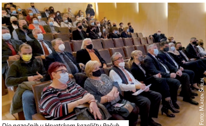
Dio nazočnih u Hrvatskom kazalištu Pečuh