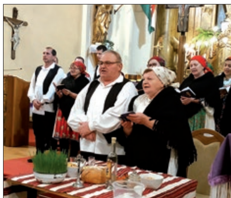
Hrvatska misa u Barči