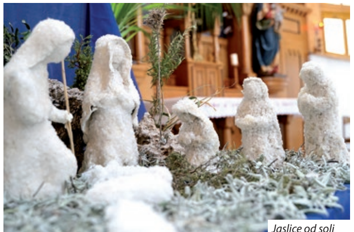
Jaslice od soli

molu, a ostali su lijepili kristalice krupne soli. Potom je uklopljen i paški kamen i slavulja koja je značajna za Pag. Godine 2009. nakon Rima jaslice su bile izložene u Gradskom muzeju u Bratislavi, a 2010. godine i u crkvi svete Elizabete u Pečuhu. U crkvi pored samostana časnih sestara franjevki našle su svoje pravo mjesto.