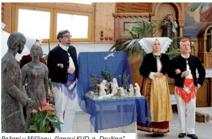
Pažani u Mišljenu, članovi KUD-a „Družina“

Istoga dana u Mišljenu su boravili i predstavnici grada prijatelja Paga, koji su izložili nadaleko poznate paške „jaslice od soli“.