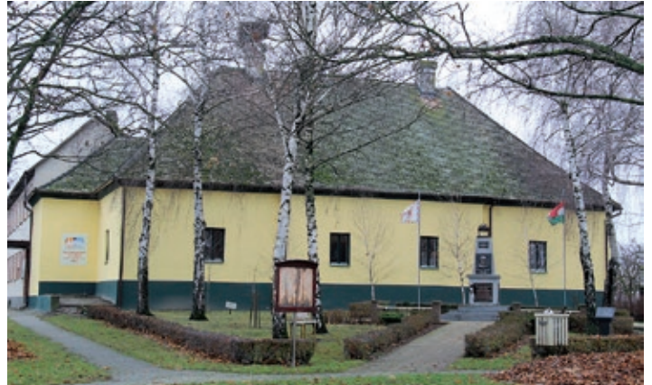
Obnovljen stari Seoski dom – društvene prostorije Šokačke udruge i zavičajne zbirke

Krajem godine načelnik Gábor Varga u prigodnom božićnom izdanju ukratko je izvijestio mještane o prošlogodišnjem radu i planovima Mjesne samouprave za 2022. godinu. Kako je uz ostalo naglasio, Samouprava je u proteklom razdoblju uspješno aplicirala za sredstva Programa „Mađarsko selo“, pri čemu su prihvaćeni skoro svi prijavljeni projekti, od kojih su brojni ostvareni. Tako će se iz potpore od 30 milijuna forinti u zgradi Stomatološke ordinacije potpuno obnoviti službeni liječnički stan. U vrijednosti od 36 milijuna završeno je asfaltiranje Ulice Zrýnyi i središta Hódune, zapadnog dijela naselja. Zahvaljujući potpori od 25 milijuna forinti ostvarit će se potpuna obnova krovništa mjesnog Kulturnog doma, a uz to i rasvjeta pozornice. Za 15 milijuna forinti nabavljen je mikrobus za socijalne usluge Centra „Kolping“. Započelo je uređivanje groblja, a u tijeku je i prva faza izgradnje zidova za urne s pristupnom stazom u vrijednosti 5 milijuna forinti, a usto groblje je uljepšano i sa 70 sadnica stabala. Sljedeće