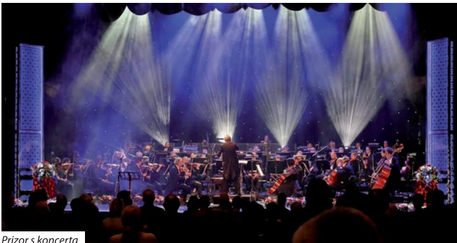
Prizor s koncerta

„Hrvati i Mađari susjedi su od pamtivjeka, što istodobno znači sudbinu i zajedništvo, povijest i identitet. Uz sve naše različitosti dijelimo zajedničke korijene i