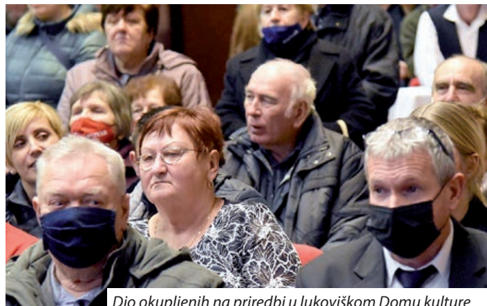
Dio okupljenih na priredbi u lukoviškom Domu kulture

Glasnogovornik Hrvata u Mađarskom parlamentu Jozo Solga skrenuo je pozornost na dva važna događaja u 2022. godini, parlamentarne izbore i popis stanovništva, koji će odrediti sudbinu Hrvata u Šomođu u narednom razdoblju. Pozvao je članove zajednice da se registriju i na parlamentarnim izborima glasuju za hrvatsku listu, jačajući time legitimitet hrvatskog predstavnika u Mađarskom parlamentu. Skrenuo je pozornost na činjenicu da se prema zakonu mjesna hrvatska samouprava može uteme-