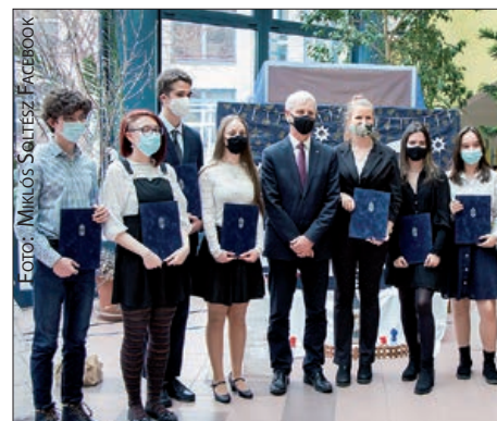
Dodjela srednjoškolskih stipendija