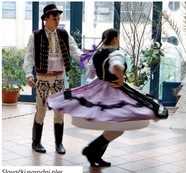
Slovački narodni ples