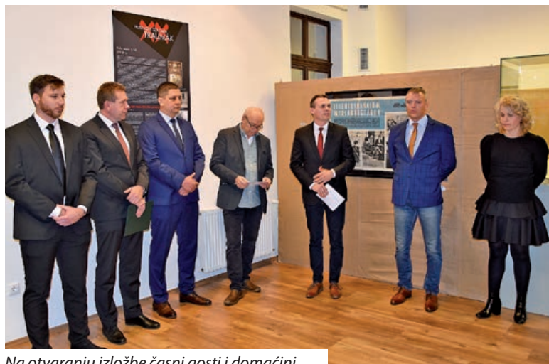
Na otvaranju izložbe časni gosti i domaćini