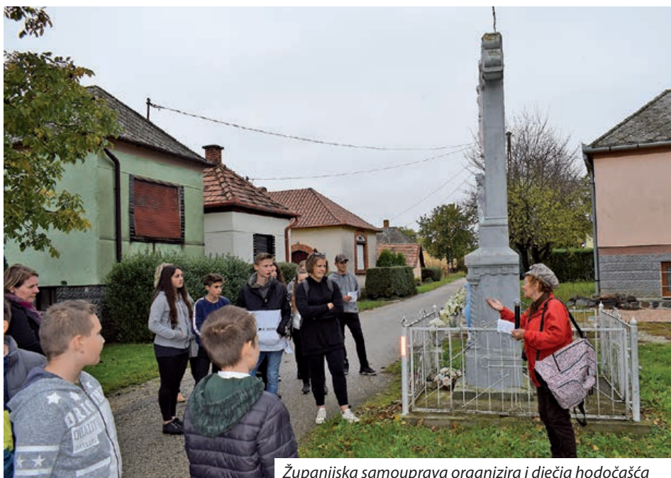
Županijska samouprava organizira i dječja hodočašća