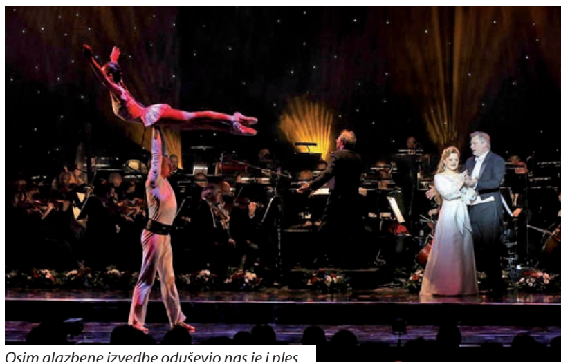
Osim glazbene izvedbe oduševio nas je i ples