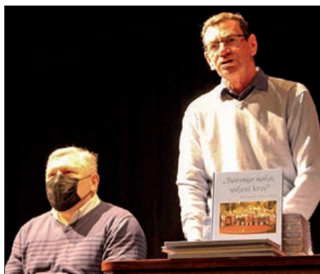
Koordinacijski sastanak u Pečuhu