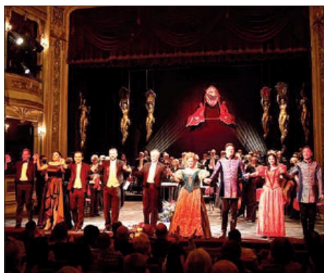
„On the Bridge of Music”