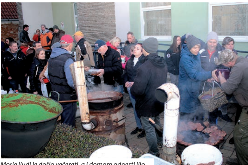
Morje ljudi je došlo večerati, a i domom odnesti jilo